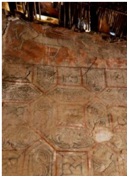
>> Les pintures murals de la Casa dels Lleons de Banyoles.

La Casa dels Lleons | Fa anys, Juan Marsé va publicar un conte en què un escriptor a poc a poc esdevenia invisible a causa de la seva negativa a sortir a la tele. L'anècdota ve a tomb perquè a Banyoles fa temps que se sap que hi ha pintures gòtiques a la Casa dels Lleons, però semblava que, tret de quatre erudits, el tema no feia fred ni calor a ningú. El Centre d'Estudis va organitzar una jornada de reflexió sobre el patrimoni cultural al Pla de l'Estany dedicada a «Les pintures murals de la Casa dels Lleons de Banyoles: un patrimoni desconegut». TV3 va dedicar-hi una notícia que no arribava a dos minuts i que també parlava d'una casa de Serinyà. Serà d'aquesta manera que, a diferència de l'escriptor de Marsé, aquestes pintures incises no es degradaran d'una manera irreversible? Esperem-ho.