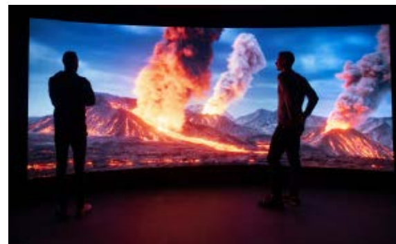
>> Imatge de l'audiovisual del final del recorregut de l'Espai Cràter, que representa l'erupció del volcà del Croscat.

Montsacopa, i s'hi expliquen els volcans de la Garrotxa i del món a partir de diversos àmbits i llenguatges expositius. Cal assenyalar que la superfície expositiva està semisoterrada precisament a l'interior d'un volcà, el del Puig del Roser, fet que s'ha aprofitat per fer-hi un gran talús de greda (que és una paret del conjunt expositiu) i, per tant, s'entra a les entranyes d'un volcà, una experiència inèdita. Sobre el museu semisoterrat s'ha format un parc urbà de tres mil metres quadrats, amb gespa i arbres propis de la zona. És interessant constatar que és un edifici sostenible, que no consumeix gens d'energia fòssil, ja que disposa d'energia geotèrmica gràcies a disset pous de cent metres de fondària. L'Espai Cràter es vol erigir en un referent nacional i internacional en l'àmbit de la vulcanologia amb l'ajut del Consell Superior d'Investigacions Científiques, que li permet accedir a l'espai científic més important de tot l'Estat. A més, ha desenvolupat un projecte socioeducatiu amb la UdG i algunes empreses d'educació ambiental, que n'han dissenyat la guia d'activitats educatives. Aquest significatiu projecte ha estat possible gràcies a les aportacions provinents de la Unió Europea, de la Diputació de Girona i de la Generalitat de Catalunya, que en representen el 70 %, i la resta, dels fons municipals olotins. El resultat és que és la mostra de referència en vulcanologia de tot l'Estat.