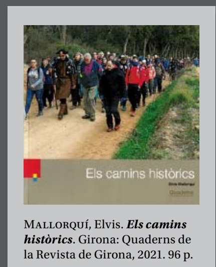
MALLORQUÍ, Elis. Els camins històrics . Girona: Quaderns de la Revista de Girona, 2021. 96 p.

Per bé que el llibre us permetrà reconèixer una part del traçat d'alguns d'aquests camins en carreteres o corriols que soleu transitar, no es tracta d'una guia de camins històrics. És, això sí, un compendi de tot allò que atresoren (l'origen, els pobles que van fer créixer a la rodalia, els fets rellevants que s'hi van esdevenir...) i que, molt probablement, desconexíeu. I és que, ja ho diuen també, que com més vell, més savi, i això ho tenim ben clar, que no hi ha res més vell que els camins.