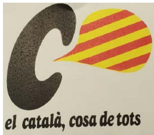
>> Un adhesiu que es va fer molt popular en els anys vuitanta.

mateix que la correcció, i que hi ha multituds que cal guanyar per a la llengua; per a aquesta nostra llengua d'ara, probablement». En la confiança està el perill, diria jo. Els hem sabut guanyar? Ara es veu que la immersió lingüística a l'escola no era tan eficaç com ens han volgut fer creure, que la salut de la llengua és incerta. En més de quaranta anys de democràcia, la Generalitat ha estat incapaç de blindar la llengua o no ha pogut; de dotar-la d'un estatut sobirà, com del que gaudeix el francès al Quebec. Quan en els segles XV-XVI les cultures veïnes (castellana i francesa) advocaven per les seves llengües enfront del poderós llatí, les poques de-