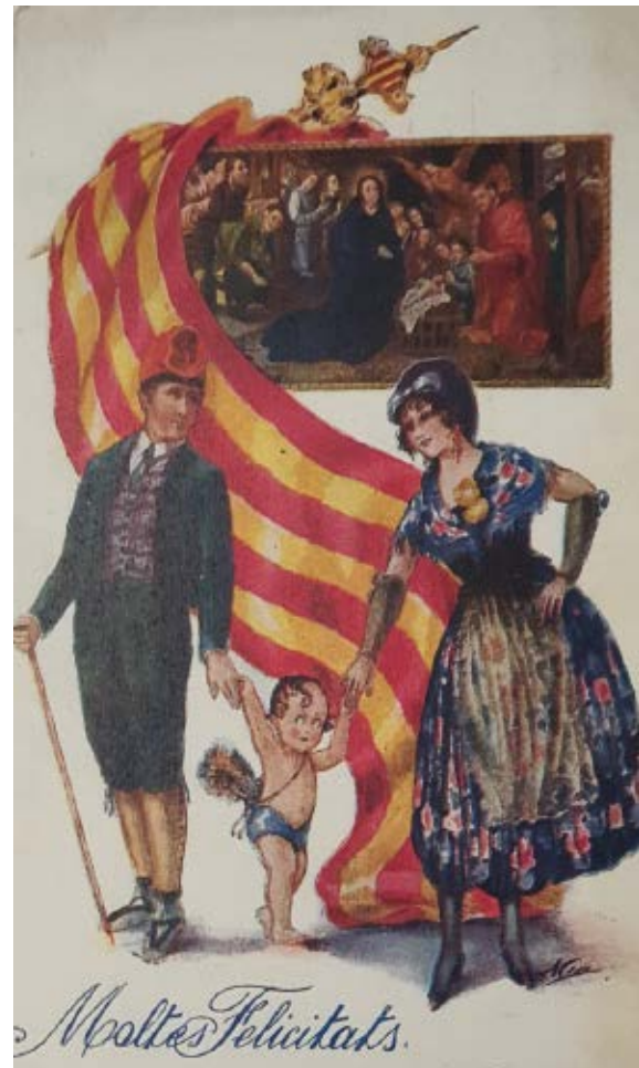
>> Una felicitació en català.