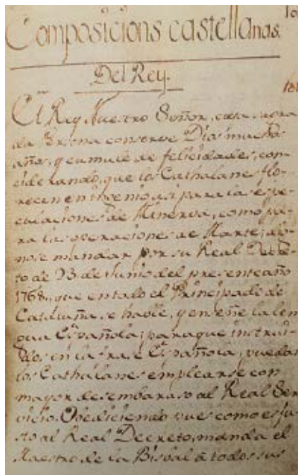
>> Reial cèdula de 1768 signada per Carles III amb l'objectiu d'imposar l'ensenyament del castellà.

Avui: "Ni templadas, ni disimuladas, con la legalidad vigente."