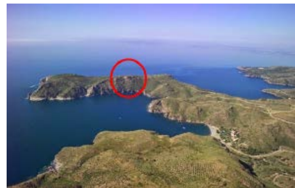
>> Vista aèria del cap Norfeu, amb el puig d'en Mamet (encerclat).

Tots els arguments presentats, si es consideren per separat, són poc concrets i fàcilment refutables. Tanmateix, crec que hi ha prou elements de judici per resoldre satisfactòriament els dubtes sobre l'origen dels topònims Norfeu i Mamet , i per proposar que el lloc on realment estava edificat el desaparegut temple d'Afrodita era al puig d'en Mamet, al cap Norfeu de Roses.