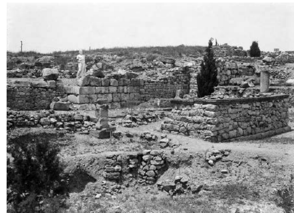
>> El temple de Serapis, a Empúries, poc després d'haver-se excavat, a principi del segle XX.

No deixa de ser curiós, però a Grècia hi ha diverses poblacions on hi va haver temples dedicats a Afrodita que, amb l'arribada del cristianisme, van canviar