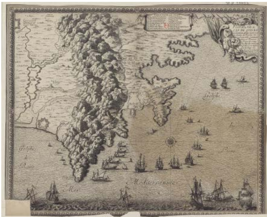
>> Plànol del setge de Cadaqués de 1655 del cavaller Beaulieu, editat el 1660.

En els segles XII i XIII, els geògrafs àrabs Yaqt, Abu-l-Fida i Al-Idrissi parlen d'un lloc al final del Pirineu conegut com a Haykal al-Zuhara o Haykal al-Zahra . Tradicionalment, s'ha considerat que feia referència al temple de Venus, però s'ha transcrit com «el lloc del culte de la flor» (sic). Altrament, el terme haykal pot significar també 'escultura' o 'estàtua'. Zahra es refereix, efectivament, a 'flor', però la paraula àrab per al color rosa és zahri , de fonètica molt semblant. Els musulmans van ocupar Roses uns setanta anys durant el segle VIII dC, de manera que és lògic