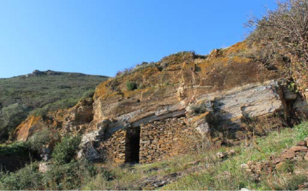
>> Exterior de la cova de les Ermites, al cap Norfeu.

que tinguessin prou coneixements del lloc. Per tant, probablement van traduir literalment el color que evoca el nom de la ciutat de Roses (el rosa) en àrab ( zahrī ) per denominar el temple, Haykal al Zhari ('estàtua de rosa'), del qual encara haurien pogut veure les ruïnes.