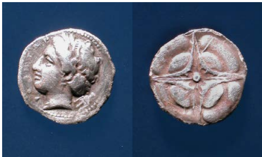
>> Dracma de Roses, amb una figura femenina i un trident a l'anvers i una rosa al revers.

A finals del segle IV aC, els focs, els grecs de Marsella, van fundar la ciutat de Roses (Rhode) i li van donar el nom de Rhodos, que significa 'rosa'. Després van crear una seca per encunyar mo-