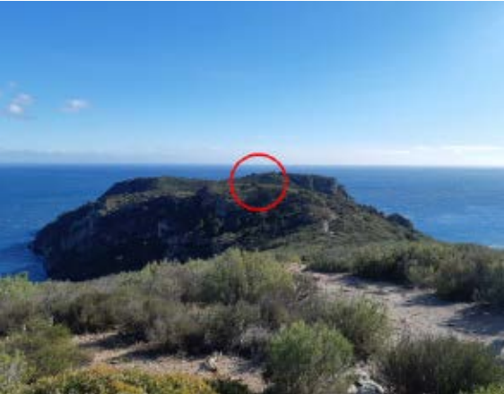
>> El puig d'en Mamet (encerclat), des de la torre de Norfeu.

nedes, les dracmes. A les excavacions del petit barri hel·lenístic de Roses se'n van trobar unes quantes. Al revers d'algunes hi ha el símbol distintiu de la ciutat, que és una rosa vista per sota, i, a l'anvers, hi sol haver la llegenda (ΡΟΔΗΤΩΝ o Rodeton , 'dels de Roses') i un cap femení. Per analogia amb altres monedes gregues del mateix període, s'ha suposat que es tractava d'Aretusa o potser de Persèfone. La nimfa Aretusa se solia representar quasi sempre amb figures de dofins, i la deessa Persèfone, amb espigues. En canvi, a les dracmes de Roses no apareixen cap d'aquestes dues siluetes. El que es mostra gravat en algunes monedes és el di-