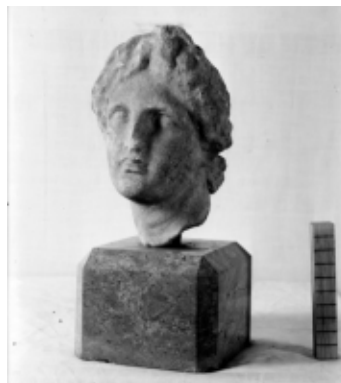
>> Cap de la deessa Afrodita datat del segle IV aC i trobat a Empúries.

Com que era una construcció molt primitiva, feta per mercaders i mariners, no es tractaria del característic temple grecoromà, sinó d'un edifici més senzill