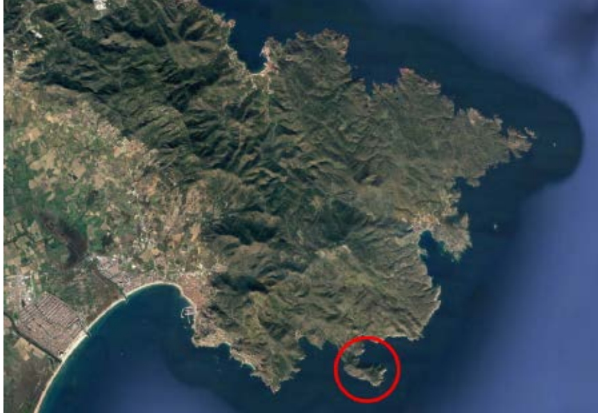
>> Situació del cap Norfeu, al cap de Creus.

Com que el temple ja no existeix i la darrera referència que se'n té data del segle II dC, les restes haurien d'estar, amb tota seguretat, sota els fonaments de les construccions que amb el temps es van aixecar al mateix lloc. Però en les nombroses prospeccions arqueològiques que s'han fet (on ha estat possible) no ha aparegut res de destacable, cosa que encara porta a més confusió.