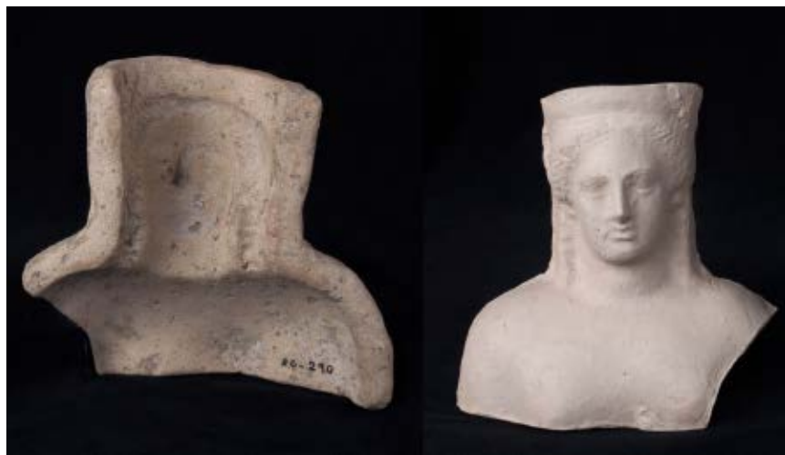
>> El motlle d'argila cuita trobat a Roses i el buidatge en guix.