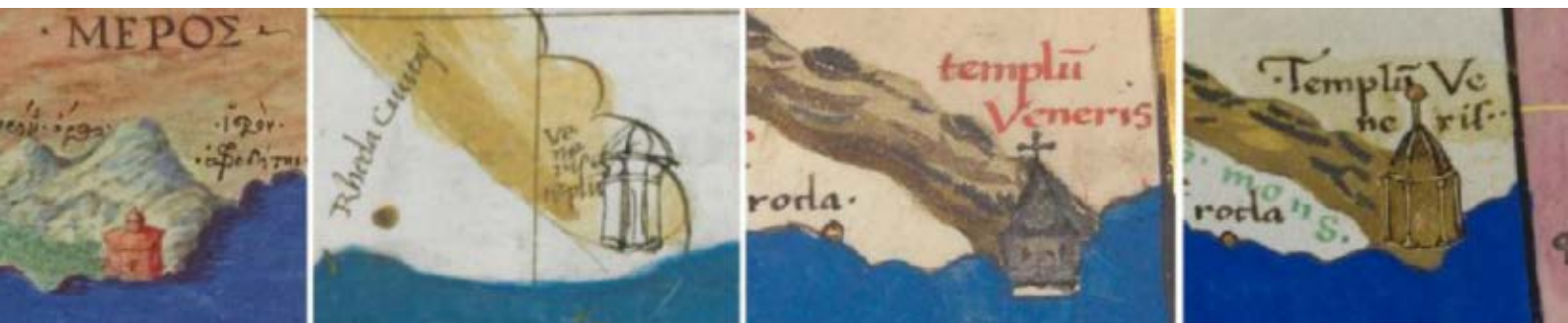
>> El temple de Venus segons diferents interpretacions del llibre Geographica de Ptolemeu.

Per tant, com que no hi ha acord entre els historiadors, diversos indrets competeixen per ser la ubicació real del temple. De sud a nord s'han postulat, amb més o menys fortuna, el lloc on s'ubica l'actual far del cap de Creus, el castell de Verdura, el monestir de Sant Pere de Rodes, el cap de Biarra i el fortí anomenat Reducte del Fanal (que és el que té més probabilitat de ser-ho), a Portvendres (és a dir, 'Port de Venus', que prové de Portus Veneris ), i el fort de Sant Elm, a Cotlliure. S'ha parlat també del poblet de Sant Martí d'Empúries i, fins i tot, d'algun paratge proper a la fortalesa de Salses, molt més al nord.