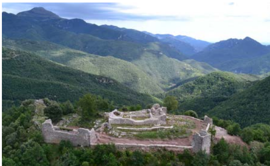
>> Vista aèria del conjunt del castell de Rocabrúna, durant el procés de consolidació.

>> Seguiment i conservació del peix espinós al riu Daró.