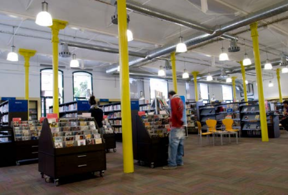
>> Biblioteca Pública Iu Bohigas, ubicada a la Factoria Cultural Coma Cros de Salt (2009).

UNED i la Universitat Politècnica. Al final d'aquesta etapa també es van crear el Consorci de la Costa Brava, la Comunitat Turística de la Costa Brava i el Museu d'Ullastret, es va fundar el Patronat Eiximenis i es va garantir la conservació del Parc Natural del Montseny.