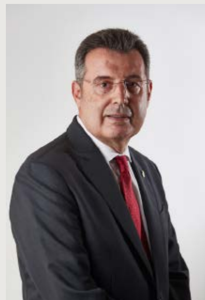
>> El president de la Diputació de Girona.

En aquests dos-cents anys, la Diputació de Girona ha estat un actor fonamental tant per al restabliment de les institucions del país (la Mancomunitat, per exemple) com per a la reconstrucció d'un territori castigat per la dictadura. Avui som indispensables per al present i per al futur, desenvolupant polítiques de sostenibilitat i fent costat als municipis per activar-hi l'economia. En un context global extremament complicat, la proximitat genera estabilitat i contribueix a