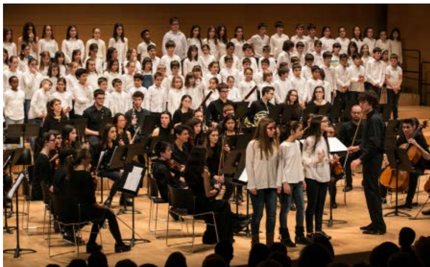
>> Concert amb motiu del 75è aniversari del Conservatori Isaac Albéniz, a l'Auditori de Girona, amb la participació d'alumnes i professors del centre (22 de febrer de 2017).

Són dos-cents anys de servei a la ciutadania. I sigui com a Diputació o com a consell de vegueries, la tasca de la institució continuarà sent bàsica com a ajuntament d'ajuntaments.