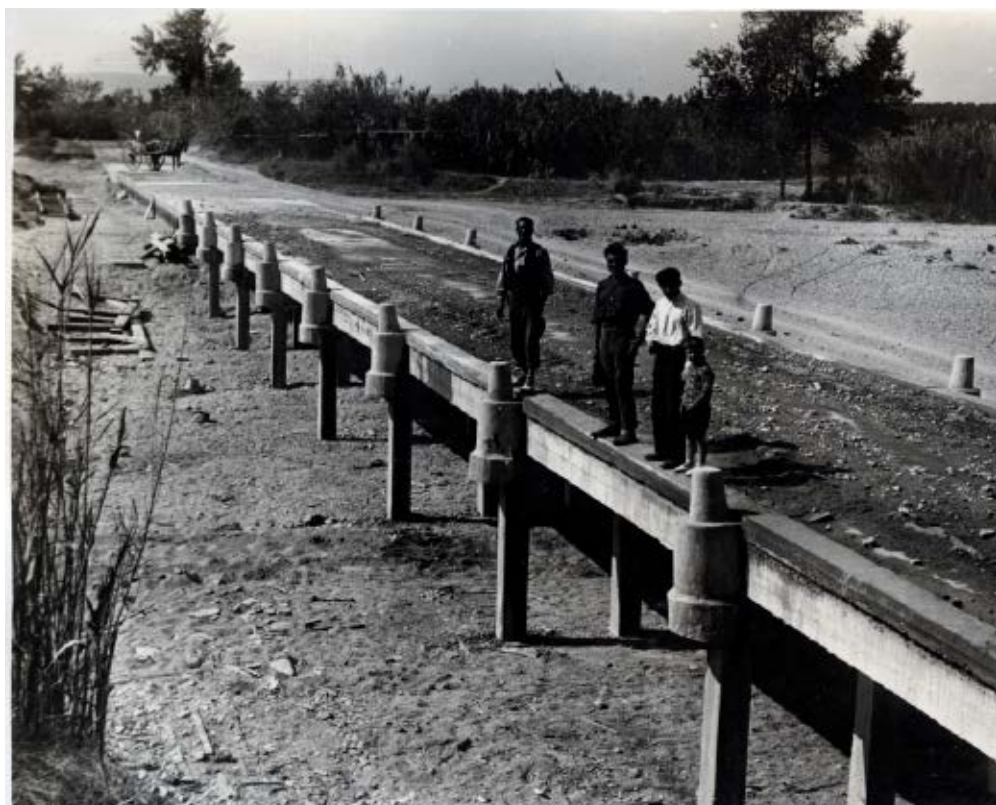
>> Construcció d'un pont sobre el riu Muga, al terme de Peralada, l'any 1932.

la segona dècada del segle XX. Per tant, la Diputació de Girona, propera als moviments socials, es va posar al cantó de les expressions artístiques, literàries, arquitectòniques i també de sentiment nacional, i ja el 1909 va