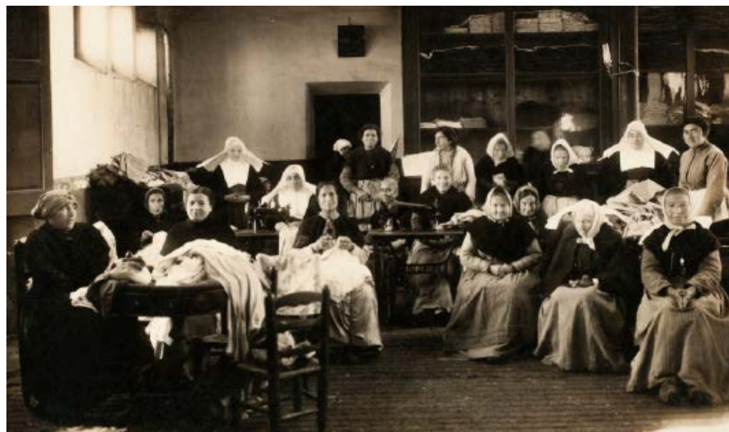
>> Treballadores i monges de l'Hospital Psiquiàtric de Salt (1918-1924). Les treballadores eren internes del psiquiàtric, que cosien i ajudaven en tasques de bugaderia.