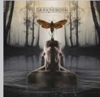
A DARK REBORN. My light . Tornado Music, 2021. < https://adarkreborn.com >

Les onze cançons del disc es mouen en les línies habituals del gènere i en el que s'ha batejat com a death melòdic, «molt melòdic i potent alhora». Totes les cançons del disc són en anglès, exceptuant «Tus notas», que tanca l'àlbum, un tema al piano que ens permet copsar la intensa veu de Lur. My light és un disc intens i treballat, en què destaquen guitarres i veus contundents i afilades però també una gran presència del piano i els teclats, i uns impressionants canvis de ritmes que sacsegen l'esperit.