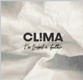
CLIMA. The trobat a faltar . Halley Supernova, 2021. < https://www.instagram.com/clima_oficial >