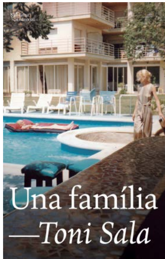
>> Coberta d'Una família.

Al principi d'aquests tres capítols ens esperen, respectivament, una escena dramàtica, una descripció poètica i una síntesi reflexiva. El llibre culmina amb un recull de fotografies de l'època, on prenen cos els personatges que hem anat coneixent.