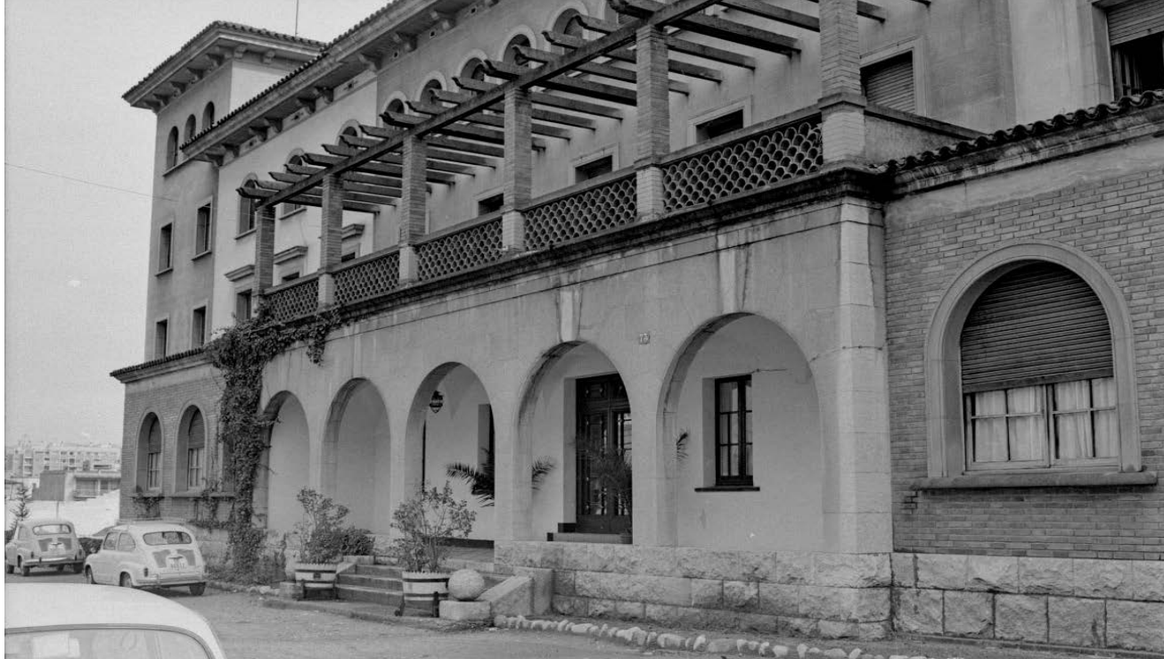
>> La residència d'oficials.

gada». Descriu també les noies que els feien passar una estona agradable: «Las putas, al margen de la frecuencia con la que uno se ocupase de ellas, se convertían en camaradas de barra y botella. Y eso hacía las noches largas y amables. Generalmente, cuando estábamos muy borrachos, nos quedábamos a dormir. A dormir más bien que a otra cosa. Aunque no siempre lo confesábamos».