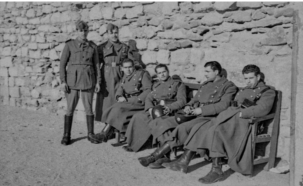
>> Grup de soldats a la caserna d'artilleria, l'any 1949.

complir-la als dinou. La llei de 1991 va incorporar, així mateix, una carta de drets del soldat i la possibilitat d'integrar la dona a les forces armades.