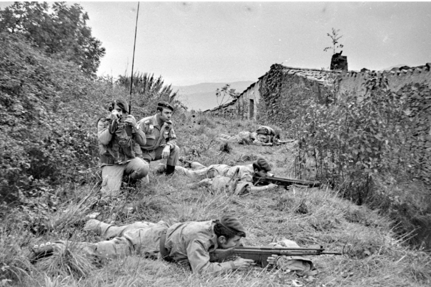
>> Una escena de l'Operació Gavarres, exercici que es va fer l'any 1972.