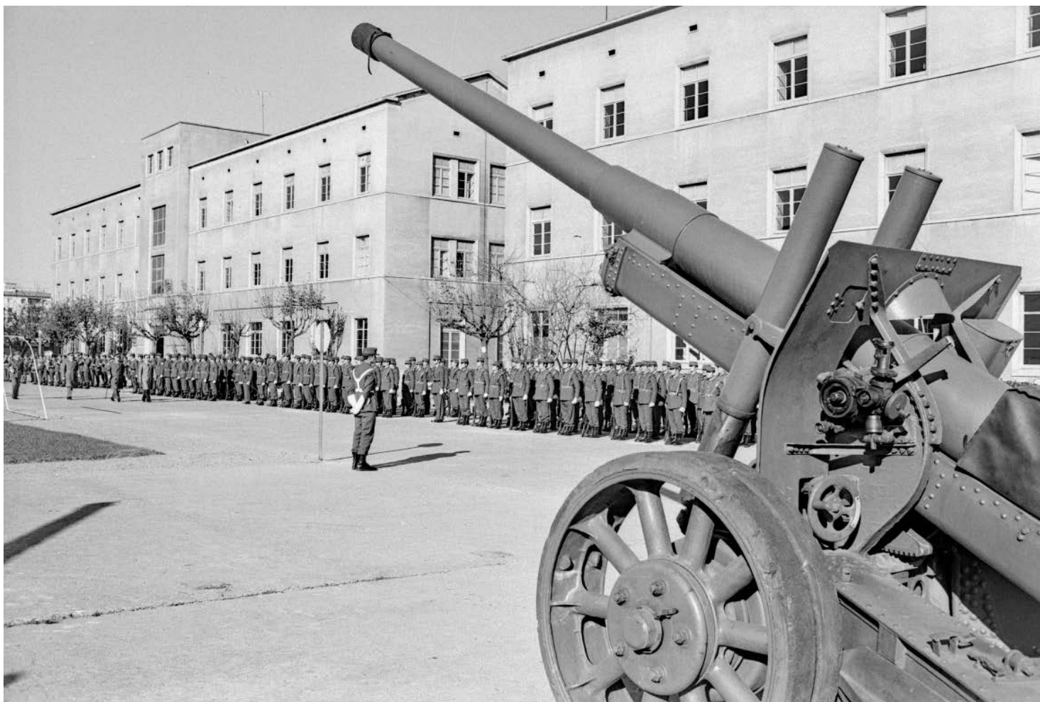
>> Acte militar a la caserna del Regiment d'Artilleria 22, amb un canó a primer terme.

A partir de la nova organització de 1984 i la reducció de la presència militar a Catalunya, la disminució de personal i la dissolució de moltes unitats, els efectius de soldats es van concentrar a la Base Militar de Sant Climent Sescebes, on el 1987 es va constituir la Brigada de Caçadors de Muntanya XLI, la qual fins a l'any 1995 va tenir el quarter general a Girona i després es va traslladar a la dita població empordanesa. En aquesta darrera etapa va promocionar-se també el soldat