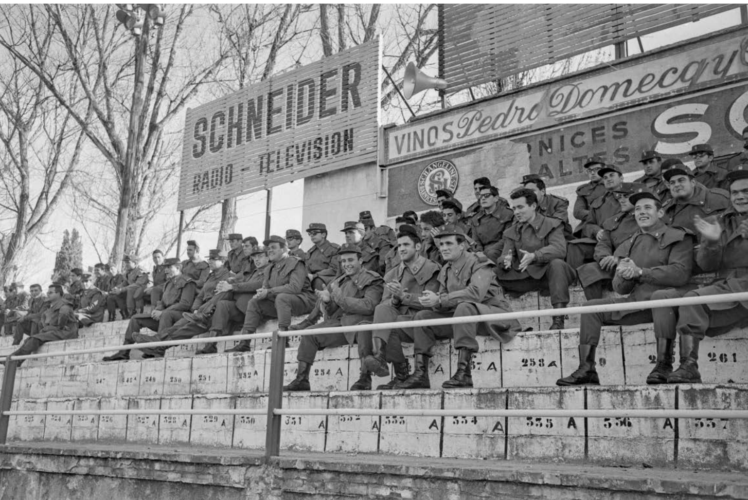
>> Soldats al camp de futbol de Vista Alegre, l'any 1968.

professional, fet que va coincidir amb uns anys de resistència generalitzada al servei militar per part d'objectors, insubmisos i desertors. No es tractava solament de suprimir la prestació, sinó d'abolir l'exèrcit i activar un debat entorn de la defensa.