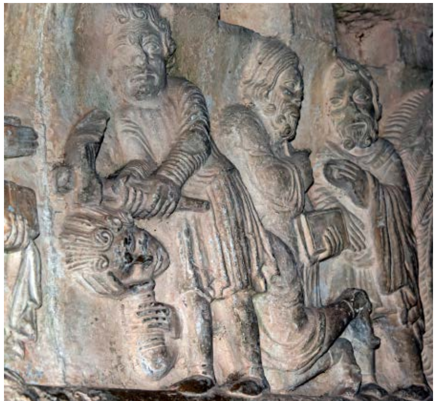
>> Capitell de la Catedral, amb el detall d'una tortura.