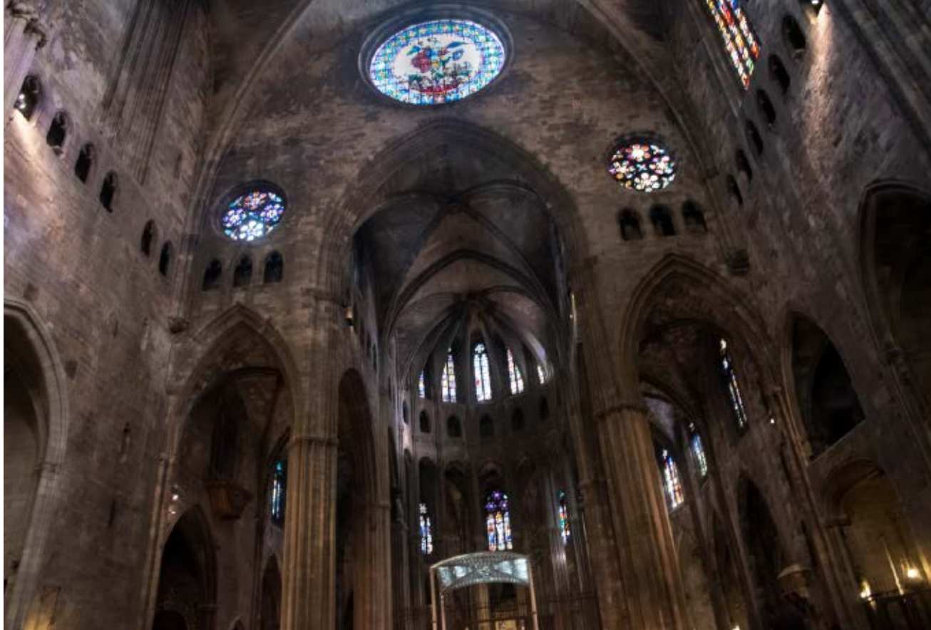
>> Interior de la Catedral.

un manual «canònic» incontrovertible. L'aportació de Nicolau Eimeric al món va ser definitiva; va oferir la coartada ideològica i, sobretot, reglada i ben servida a una comunitat de torturadors i assassins que Vicent Ferrer atiava. Va crear una interpretació de la Bíblia (primer testament), la més terrible i sanguinària del cristianisme; un document que pel fet d'existir justificava la tortura des d'una mentalitat jurídica. Fins llavors ningú no havia sistematitzat l'horror. A partir d'ell hi havia un mètode.