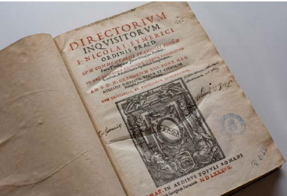
>> El llibre d'Eimeric es pot trobar a la Biblioteca Carles Rahola.