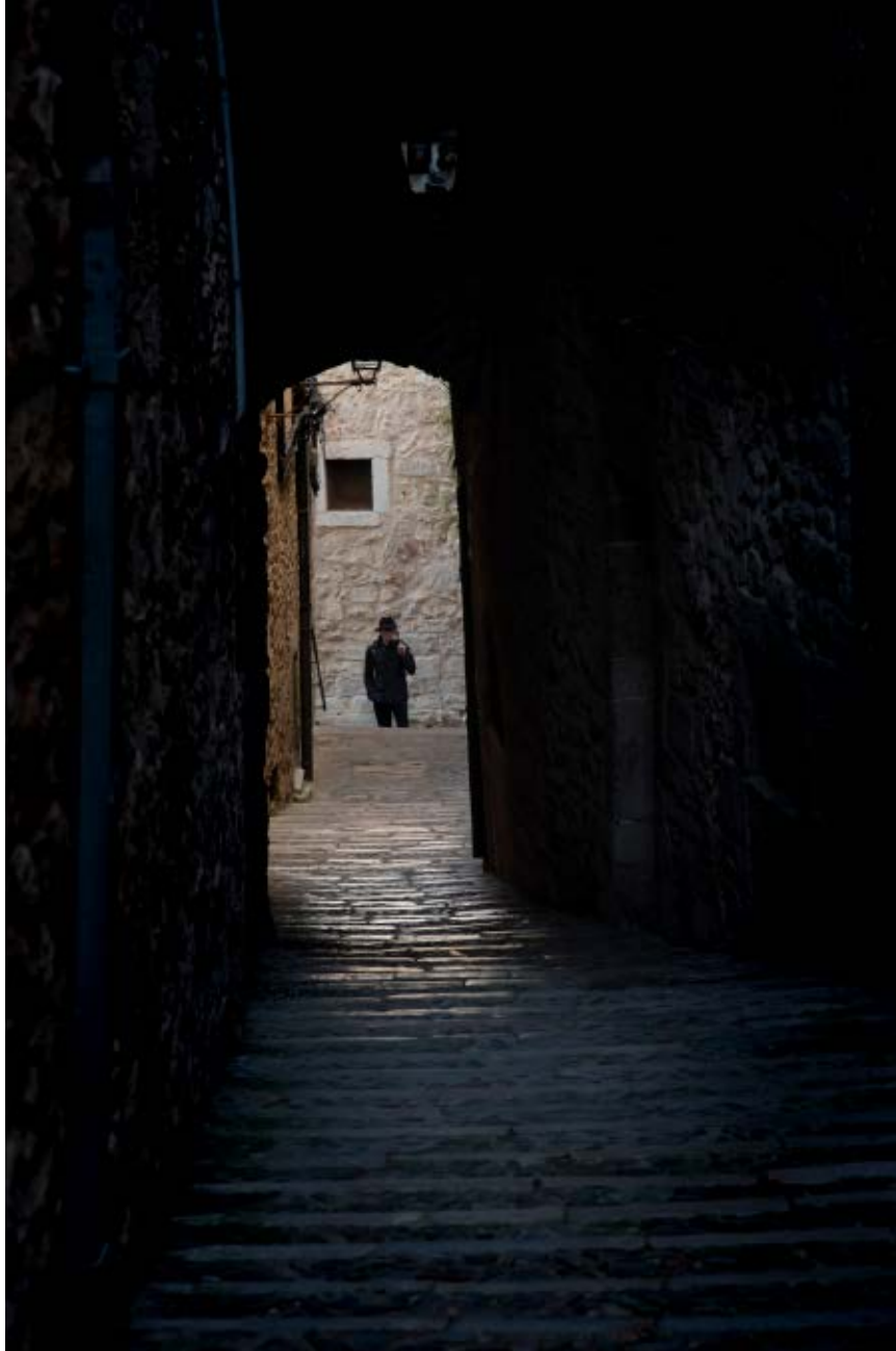
>> Carrer de Cúndaro.

da, la decadència moral de molts monestirs era ben manifesta a la ciutat del segle xv. A la Girona del segle xiv i xv trobem esclaus tàrtars, sarraïns, russos, etc. [...] El seu valor depenia de l'edat i de la utilització per al treball. Exercien de criats, d'objectes de producció i de plaer, i en posseïen totes les classes socials, fins i tot alguns clergues».