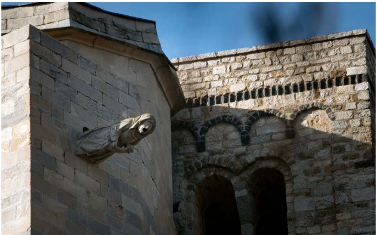
>> La bruixa de la Catedral.

sorgit abans que la impremta. Més endavant es va traduir a altres llengües. Se'l va adaptar a cada inquisició. Dins d'un món tan tenebrós com era el de la Inquisició transfronterera, va ser un best seller . La trajectòria d'Eimeric és complexa i estranya. És un personatge que va estar a favor d'un rei i d'un altre i d'un papa i del contrari, que es va apuntar al cisma i que després el