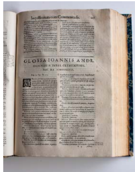
>> El manual, en què es detallen diverses formes de tortura.

ara Sant Feliu de Pallerols, Susqueda, Rupit, Tavertet o Viladrau, on es van executar catorze dones a la forca.