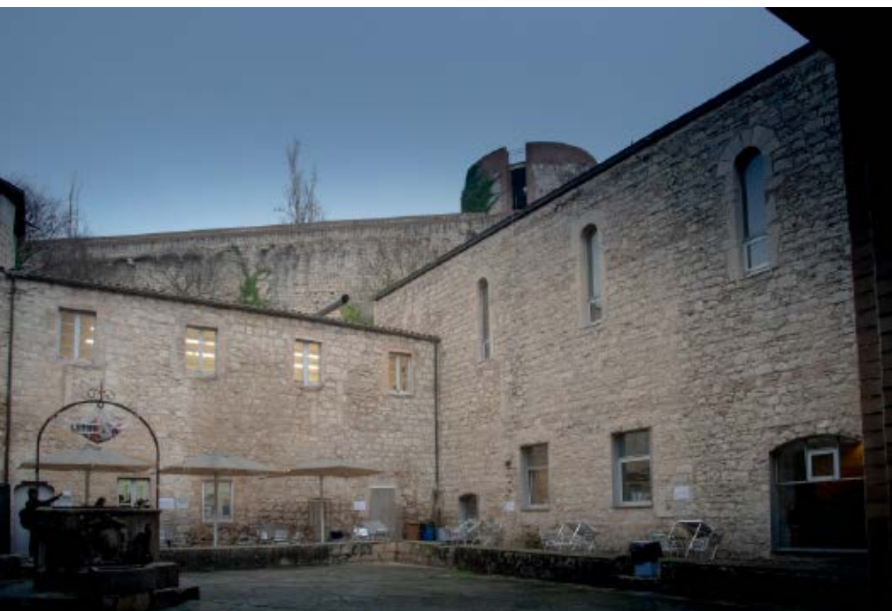
>> Claustre de l'antic convent de Sant Domènec.

Vicent Ferrer no s'entenia amb Nicolau Eimeric, el qual, quan se li havien ensorrat les ànsies de poder, va sortir d'Avinyó d'una manera tranquil·la i reptiliana. En tot cas, quan se'n va anar duia un text fonamental en contra dels heretges. A partir del seu llibre, la Inquisició i els poders locals van disposar d'un llibre reglat,