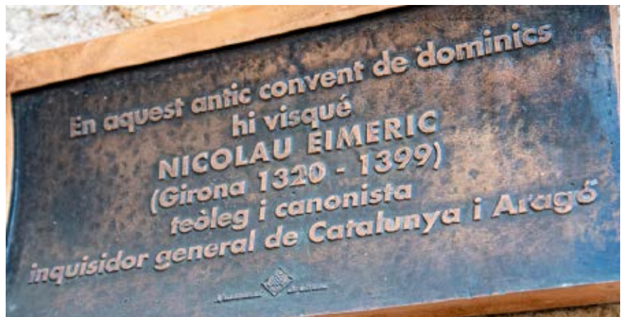
>> Placa que recorda en quin lloc de Girona va viure l'inquisidor.

«Els eclesiàstics constituïen un sector privilegiat, força nombrós. La reacció en contra d'una església poderosa i allunyada de la doctrina de Crist fou protagonitzada per un grup beguí (religiosos laics - 1320), tres membres del qual moriren a conseqüència d'una condemna inquisitorial. D'altra ban-