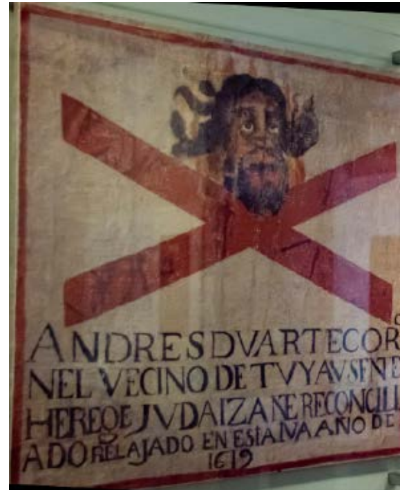
>> Referència a una víctima d'Eimeric, al Museu dels Jueus.

Sembla que Nicolau Eimeric va escriure el llibre a Avinyó. Era l'època del Cisma d'Occident. Hi havia dos papes, l'un a Avinyó i l'altre a Roma. Llavors, l'orfe recollit pels dominics de Girona que havia arribat a ser una persona important va ser desterrat i va anar a Avinyó, on va acabar el llibre. El Directorum Inquisitorum havia