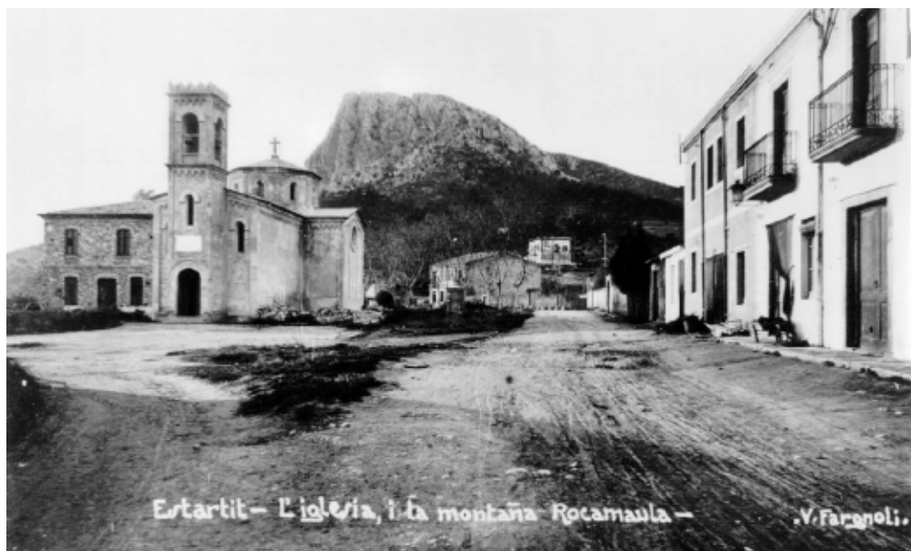
>> L'església i la muntanya.

Sense recursos per pagar-se el passatge cap a les Amèriques, Pere Coll va fer de barber al vaixell, tallant els cabells i afaitant el capità, de qui es va fer bon amic. La travessia era llarga i plena de perills, i amb cap comoditat. La primera feina que va trobar Pere Coll en arribar a l'Havana, el 1867, va ser al port; una feina dura per a un noi de