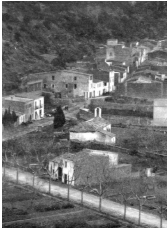
>> Ermita de l'any 1750 vista des de la muntanya.