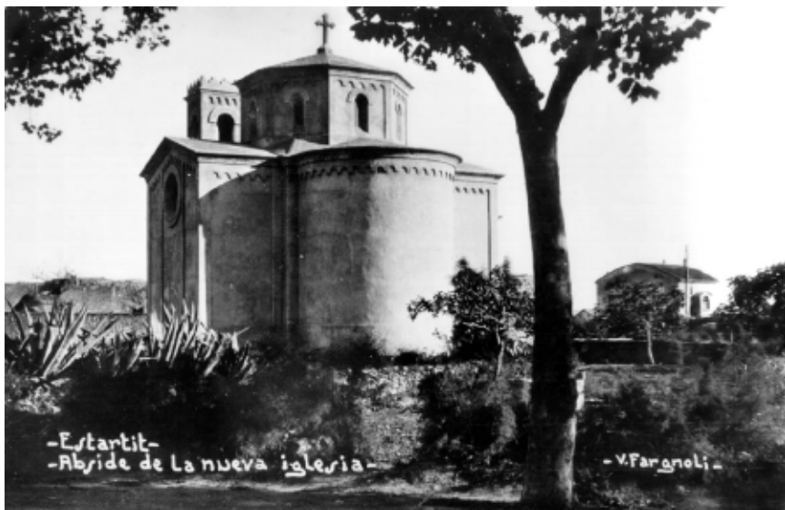
>> Absis de la nova església.