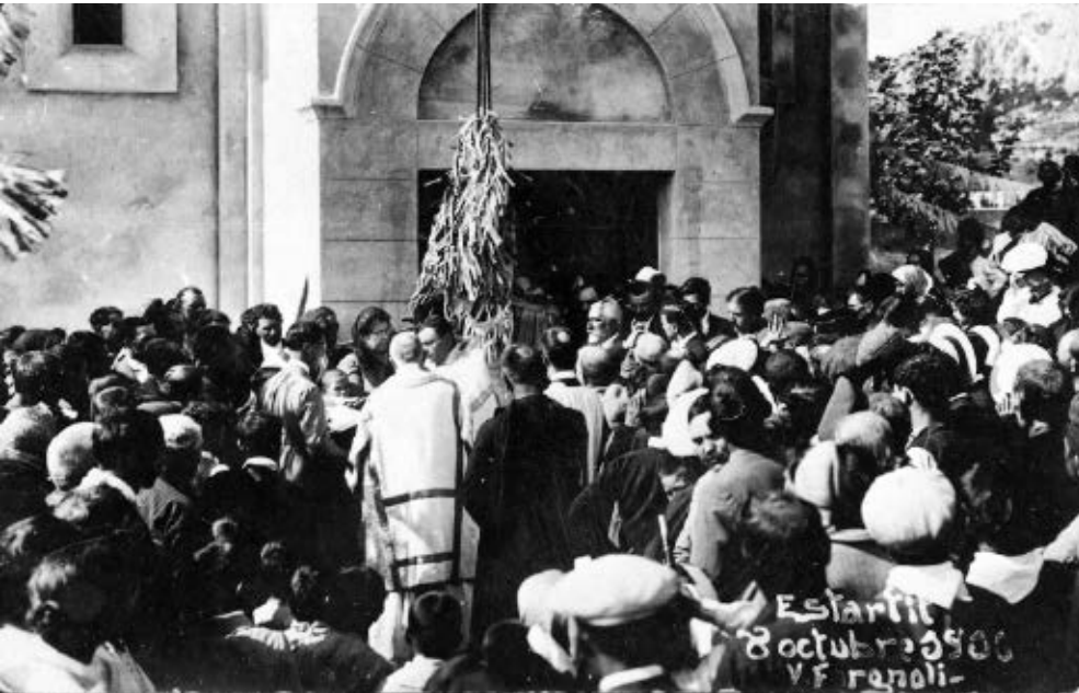
>> Benedicció de la nova campana, el 1916.