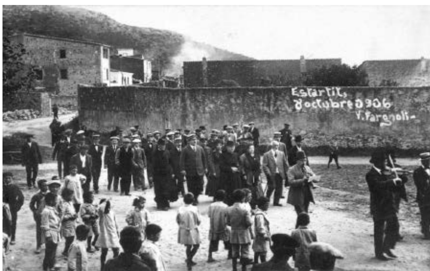
>> Processó de les autoritats, el 1916.