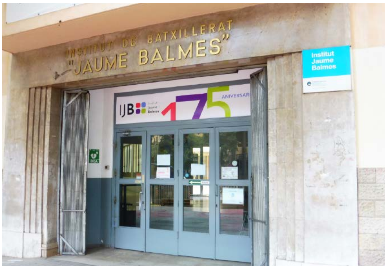
>> Façana de l'Institut Jaume Balmes, situat a la cruïlla dels carrers Pau Claris i Consell de Cent de Barcelona.

P er damunt dels noms i cognoms i de la seva connexió amb el centre, crec que és bo acollir-se a qualsevol circumstància —en aquest cas concret una commemoració històrica— per evocar (no goso emprar el verb celebrar en aquests temps tan negres i difícils) unes persones dedicades a l'exercici de la docència i, millor encara, a formar adolescents i joves i també a valorar les seves aportacions