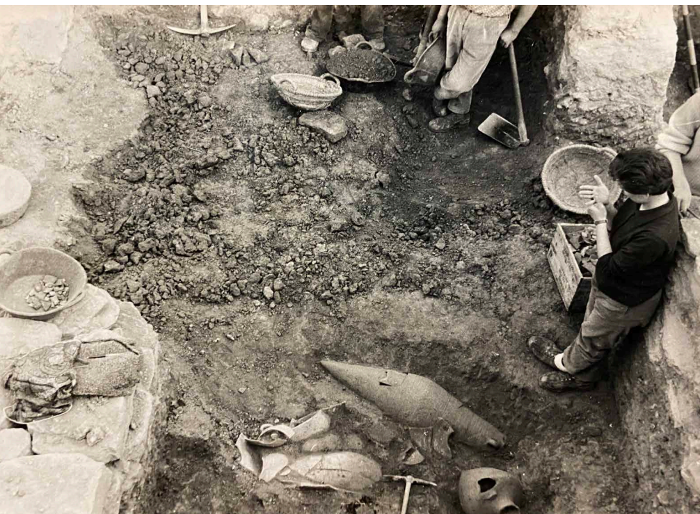
>> En una excavació a Ullastret.

fragment ja saps què és. També és una manera de parlar amb la gent. En un quadre del circ que vaig fer, només es veu la cua d'uns elefants. És una manera de suggerir. Tu ja imagines que els elefants van caminant.