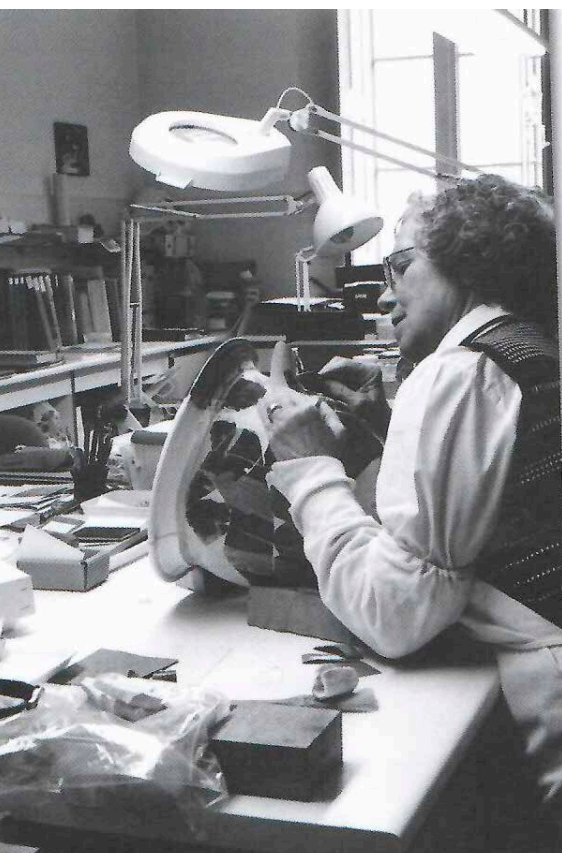
>> Restauració del crater de Pontós.

El que pinto es basa en la realitat. Abans sortia i agafava apunts. Feia com un croquis. A dalt, a l'estudi, tinc carpetes de temes diferents plenes de retalls i esbossos. Quan vull fer un quadre de segadors, per exemple, agafo la