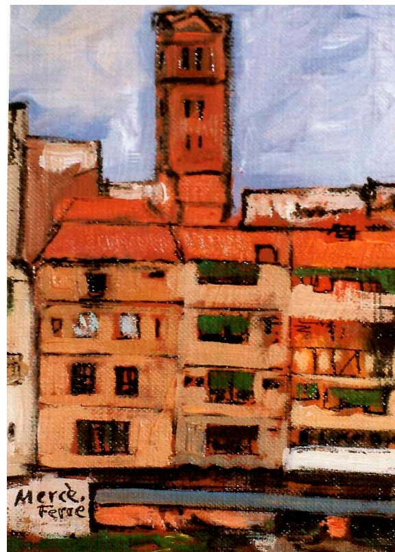
>> Un dels seus olis sobre tela.