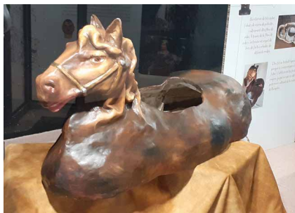
>> Un dels cavallets de la mostra que es va poder visitar a Can Tarradas, a Banyoles.

tinada», escenifica el conflicte històric entre els Cairuts i els Rodons, bandositats banyolines partidàries del monestir i la vila, respectivament. L'exposició també va posar en relleu banyolins anònims que havien participat en la cultura popular de la ciutat.