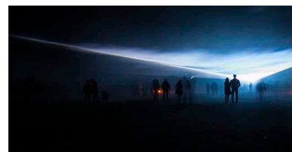
>> L'hort de la llum, instal·lació creada per Antoni Arola a la pista d'atletisme en l'última edició de Lluèrnia.

Es va mantenir l'essència característica del festival del foc i de la llum, amb instal·lacions d'arquitectes, dissenyadors d'il·luminació, escenògrafs, interioristes, artistes visuals i videocreadors, a més d'alumnes de diversos nivells.