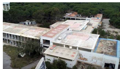
>> Estat actual de les antigues instal·lacions de Ràdio Liberty.

estan en un espai amb un alt valor natural i paisatgístic. Malgrat que el Ministeri per a la Transició Ecològica (els terrenys són de titularitat estatal) planeja encarregar un projecte tècnic per tirar a terra les edificacions i tornar a naturalitzar l'espai, a hores d'ara no hi ha cap notícia sobre les dates concretes. Les trenta-tres hectàrees que ocupa aquest recinte fantasmagòric són a primera línia de mar, dins dels límits del Parc Natural del Montgrí, les Illes Medes i el Baix Ter. No seria hora de fer el pas definitiu per protegir el terreny de possibles especulacions urbanístiques i adequar-lo per ser visitat? S'hi podrien marcar itineraris de natura i punts d'informació sobre la història i l'evolució del lloc al llarg dels segles, i també sobre l'episodi de la presència nord-americana al litoral gironí i la Guerra Freda, per què no?