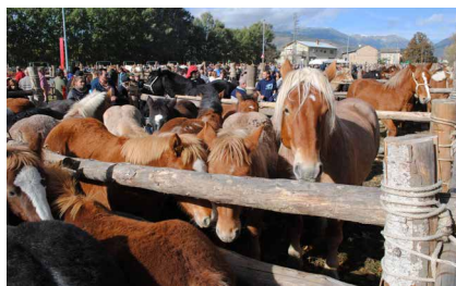
>> Un moment del quarantè Concurs de Cavalls durant la Fira de Puigcerdà.

Després d'un any sense fires arreu a causa de la pandèmia, la demanda ha augmentat i els ramaders cerdans preveuen molt bones vendes per al 2022.