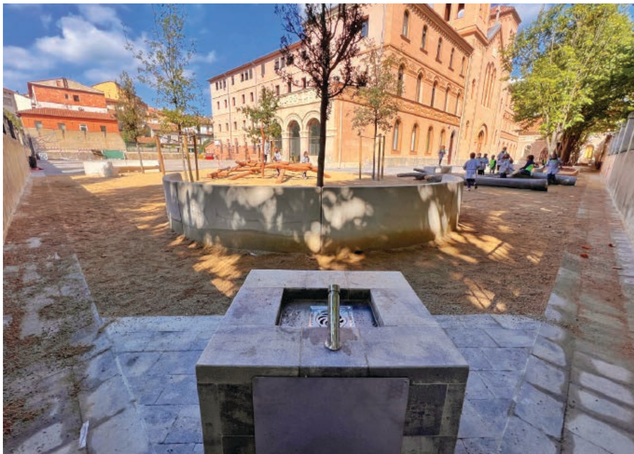
>> Un moment de joc dels alumnes d'educació infantil al pati del centre.

estandarditzades, que s'imparteixen amb metodologies i recursos diversos. El projecte SUMMEM, tot i tenir unes directrius generals compartides per totes les escoles pies del país, s'adapta a la realitat de cada centre.