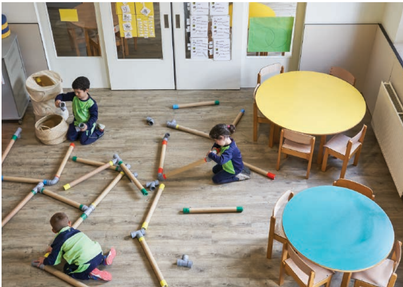
>> El taller de construccions amb material reciclat estimula la creativitat i el treball en equip.