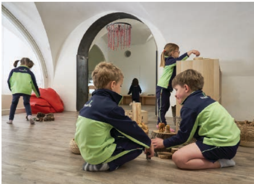
>> Un grup d'alumnes d'educació infantil del centre fent una activitat de joc simbòlic.

És una escola gran, si tenim en compte la mida de les escoles de la ciutat i la comarca: té dues línies que van des de P3 fins a quart d'ESO, a més d'alguns cicles formatius de grau mitjà i superior i PFI. És una escola amb tradició, tant per les característiques de l'edifici (un edifici gran, amb una façana