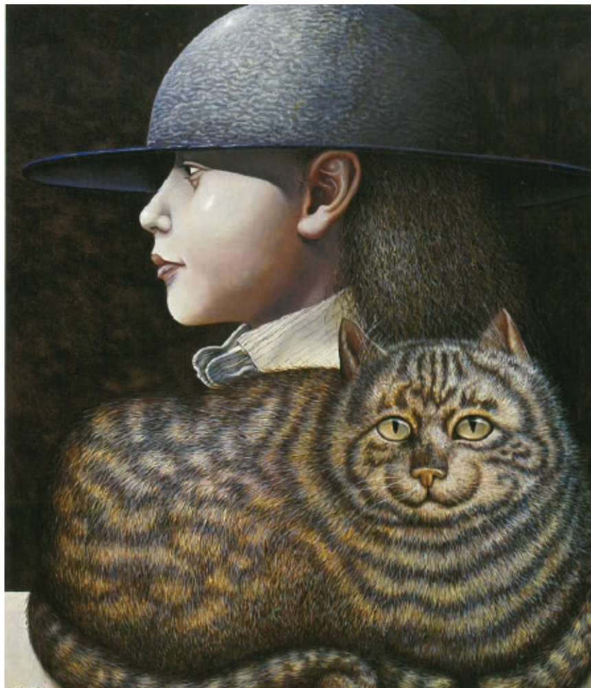
>> Nena i gat, oli sobre fusta, 39 x 47 cm, 1983. Col·lecció particular, Barcelona.