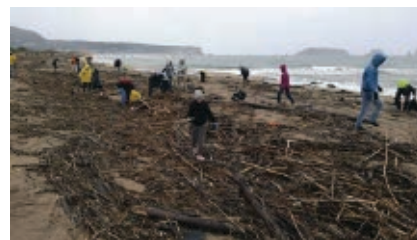
>> Recollida de brossa després del pas del Gloria a la Gola del Ter.

Vint anys defensant la natura L'associació Gent del Ter fa vint anys que du a terme campanyes i accions destinades a preservar el territori i les seves qualitats mediambientals a la zona del Baix Ter. Un patrimoni com el del Parc Natural del Montgrí, les Illes Medes i el Baix Ter necessita, a més de l'esforç de totes les administracions implicades i la bona voluntat dels ciutadans i ciutadanes, disposar d'una veu, de vegades amable i de vegades crítica, com la de l'associació sense ànim de lucre Gent del Ter. L'entitat es mou en diferents camps tècnics i pràctics, com ara la recerca, la difusió i la conserva-