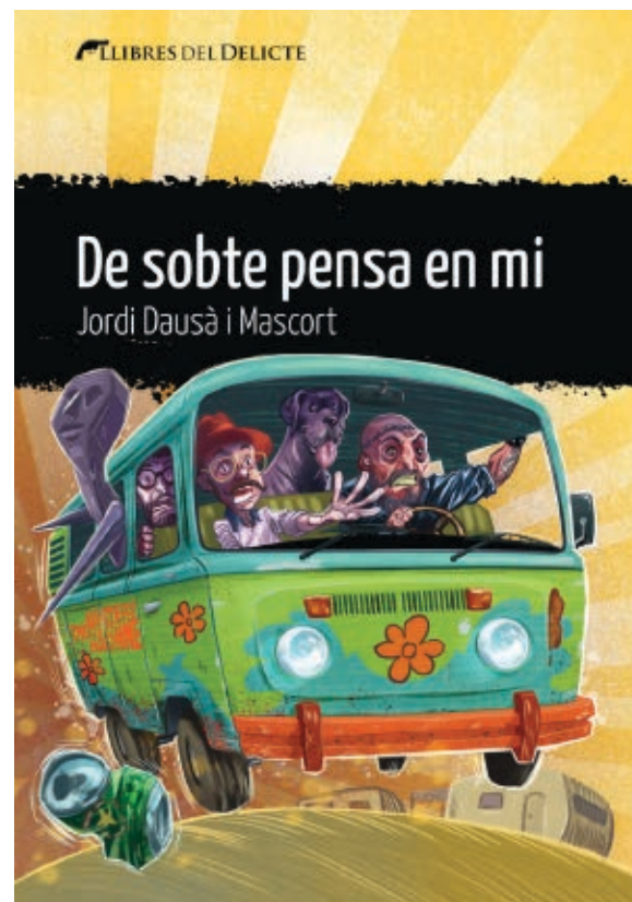
>> Portada de De sobte pensa en mi , una novel·la idònia per analitzar el concepte de suspensió.

El llibre conté intrigues paral·leles que no tenen a veure directament amb els fets narrats, sinó més aviat amb la curiositat del lector