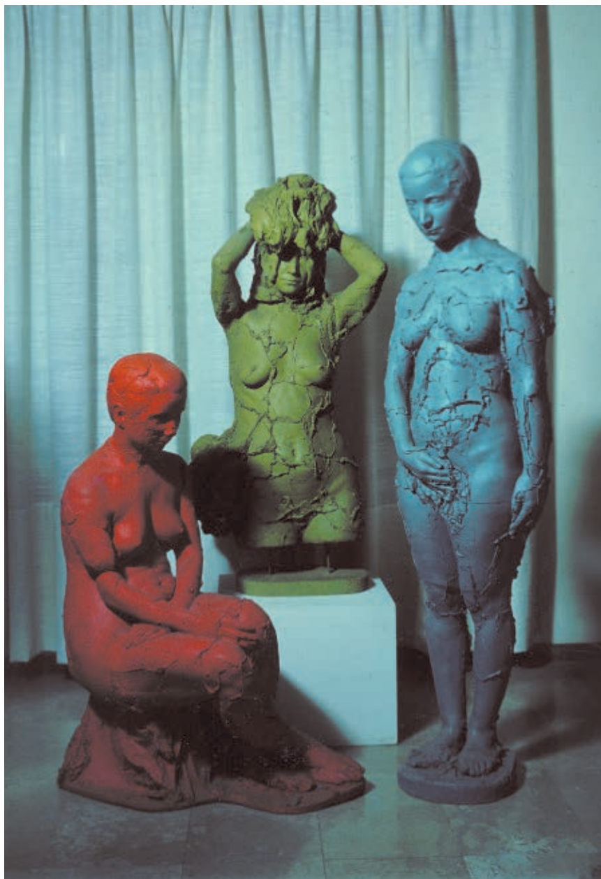
>> Mòmies, 1972-1973, mida natural, poliuretà. Col·lecció Fundació Fita.

catàleg definitiu per saber on és l'obra major i l'obra menor, o bé el cagaferro escorredís. La vastitud de la seva producció haurà de madurar per poder bastir-ne un nou corpus que delimiti els processos creatius, que ens destriï el blat de la palla, que unifiqui tots els seus conceptes artístics i que permeti saber-ne exactament les procedències creatives; on cercar els camins que condueixen a una obra personal trencadora o barrar el pas a la imatge de l'artista que, essent paraplàgic, va poder produir cap a onze mil obres, gairebé un rècord que, massa sovint, el va sepultar en una voràgine imparabile per demostrar-se i demostrar-nos que