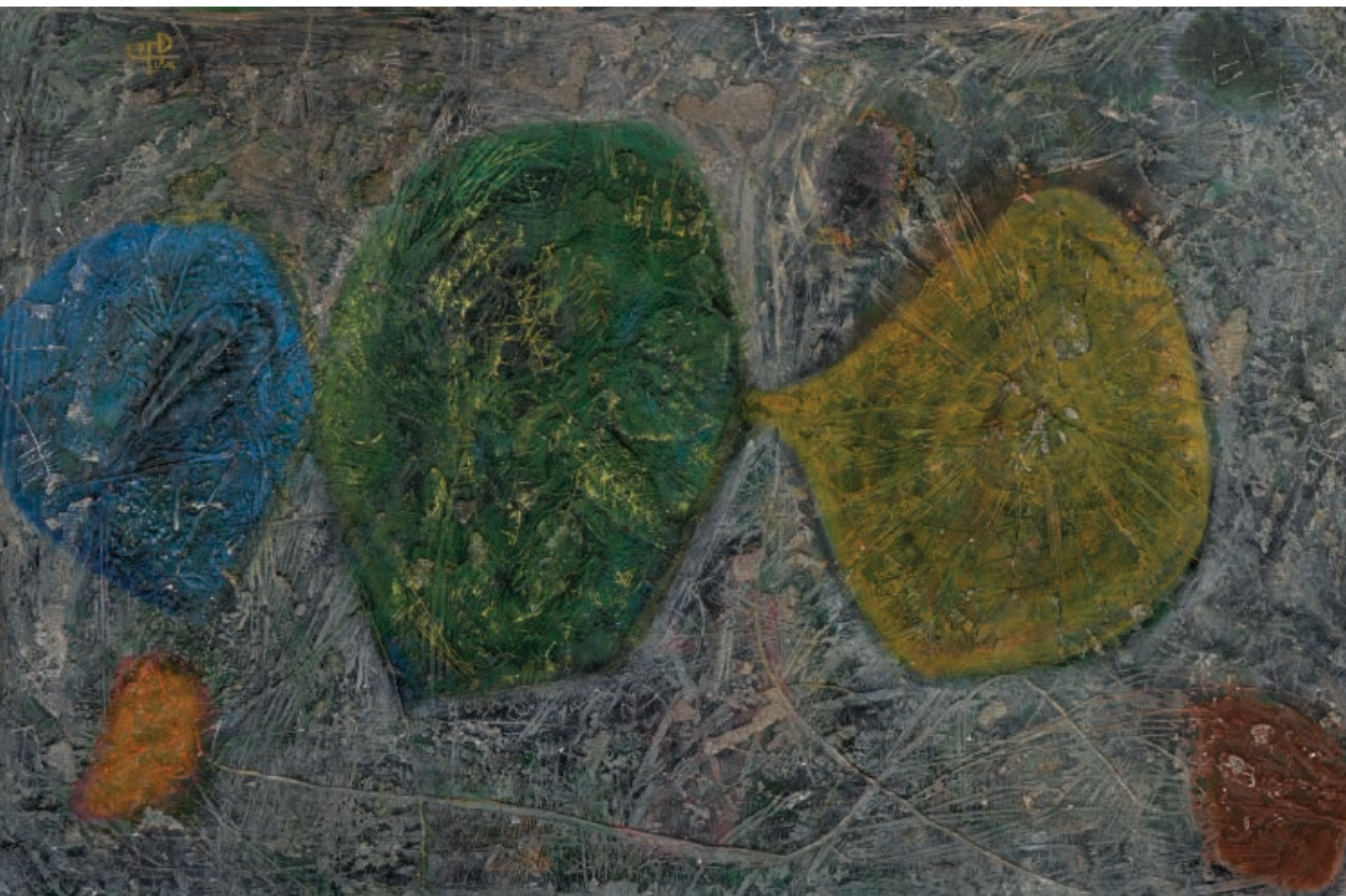
>> Ancestral, 1959, 65 x 100 cm, tècnica mixta sobre tela. Col·lecció privada.

posteriors Fita va ser un alumne eficient i brillant. Com a compensació, la Diputació de Girona va creure en l'artista i en les seves potencialitats i va fer per pagar-li la carrera de Belles Arts a Barcelona. Estudis i coneixences que li amplifiquen l'horitzó viscut a i des de l'Hospici gironí. Professors, amistsats, personal sanitari, didots, monges, foren la seva família.