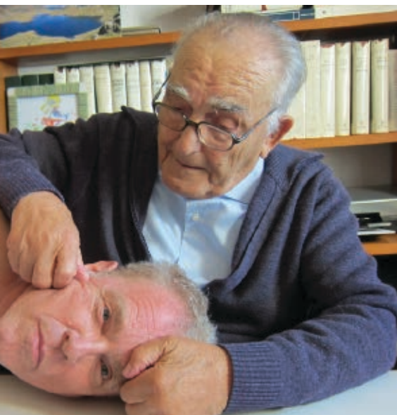
>> Domènec Fita jugant amb el cap de Sebastia Goday.

Una vida, la de Domènec Fita i Molat (10 d'agost de 1927 - 9 de novembre de 2020), que s'omplia segons el que explicava a qui el volia escoltar, en els seus articles o en la copiosíssima i precisa catalogació de la seva vasta producció; una necessitat, un impuls, una voluntat, un pensament dominador, una addicció, un sacerdoti seglar i no tan seglar, una xarxa, una cridòria, sempre, però, immiscint-se en i per la flama artística rebuda en la seva formació i en capacitats innates en temps i en geografies de vida no massa donades a la llibertat: franquisme irredempt, Opus Dei, paraplegia, sempre es deixava revertir per l'art, pel seu concepte de l'art, après a l'Hospici amb el mestre Joan Carrera, a Olot, a Belles Arts de Barcelona, amb els del grup Flamma, en no gaires viatges. En Fita, el Fita que tots admiràvem i admirarem i que, de tant en tant, ens provocava una certa i indulgent commiseració en saber-lo aparentment discapacitat i, alhora, una gran i reverencial admiració en veure'l irreductible, infatigable treballador, amic dels amics, lliure; era l'artista integral, integrat, integrador.