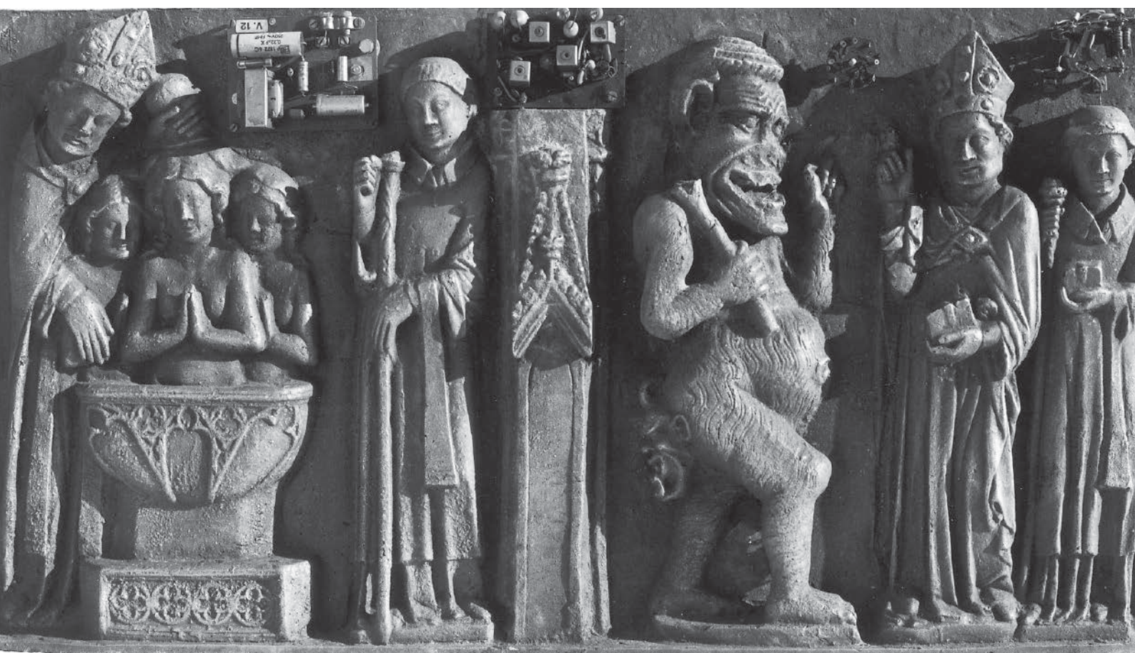
>> Sarcòfag de sant Narcís, 1977, 73 cm d'amplada, bronze i circuits incorporats.