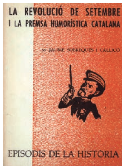
>> La Revolució de Setembre i la premsa humorística catalana (1965).