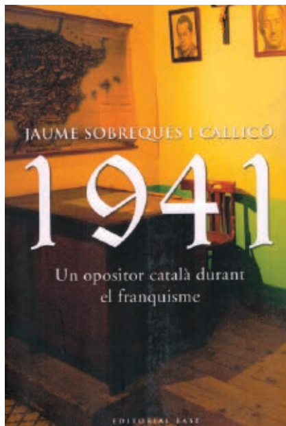
>> 1941: Un opositor català durant el franquisme (2004).

>> Sobrequés envoltat de llibres i arxivadors