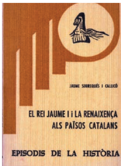
>> El rei Jaume i la Renaixença als Països Catalans (1981).

En la dècada dels anys vuitanta va començar una carrera professional. Vau publicar Els arxius per a la història del nacionalisme català (1982).