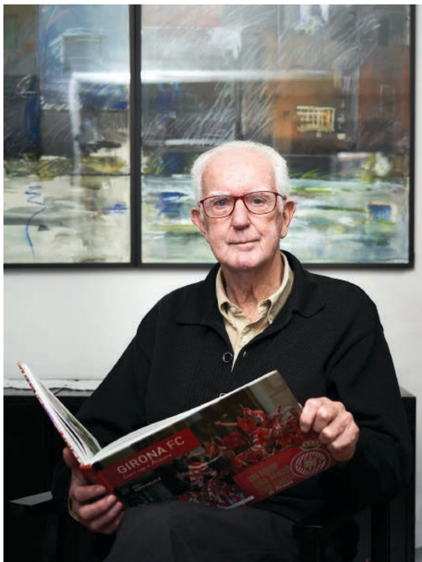
>> Fullejant un llibre sobre el Girona FC.

més gran que ha patit el país, sovint amb la complicitat de partits catalans. Haver consentit això posa a les portes de la mort la mateixa existència de la nació catalana, i redueix la nostra classe política a ser una joguina de l'Estat espanyol. Constató, però, en aquest sentit, que una societat i una classe política que consenten l'existència de presos polítics i exiliats al segle XXI són una societat en risc de mort i una classe política també greument malalta. No hi veig remei; s'ha claudicat massa. A Espanya, es riuen del fet que reunim un milió de persones al carrer, i els polítics espanyols, també.