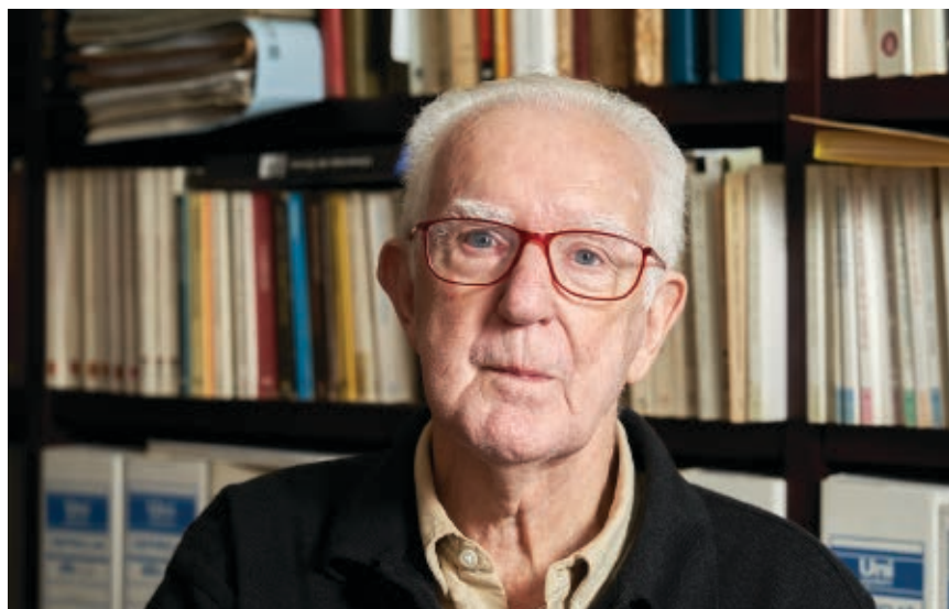
>> L'historiador davant de la seva biblioteca.

Just l'endemà de la mort del dictador, vaig considerar que calia recuperar un passat del país que s'havia amagat. La fundació d'Undarius, una tasca unipersonal feta només amb els recursos que tenia com a professor i funcionari municipal, respon a aquesta voluntat. Undarius va publicar els primers textos sobre autonomia, la Segona República, el manifest comunista, Rovira i Virgili...; encara no una vintena de llibres, que varen tenir un èxit excepcional. Del meu llibre sobre l'11 de setembre, se'n van vendre set-cents exemplars en la concentració que va tenir lloc a Sant Boi el 1976 i uns vint mil en total.