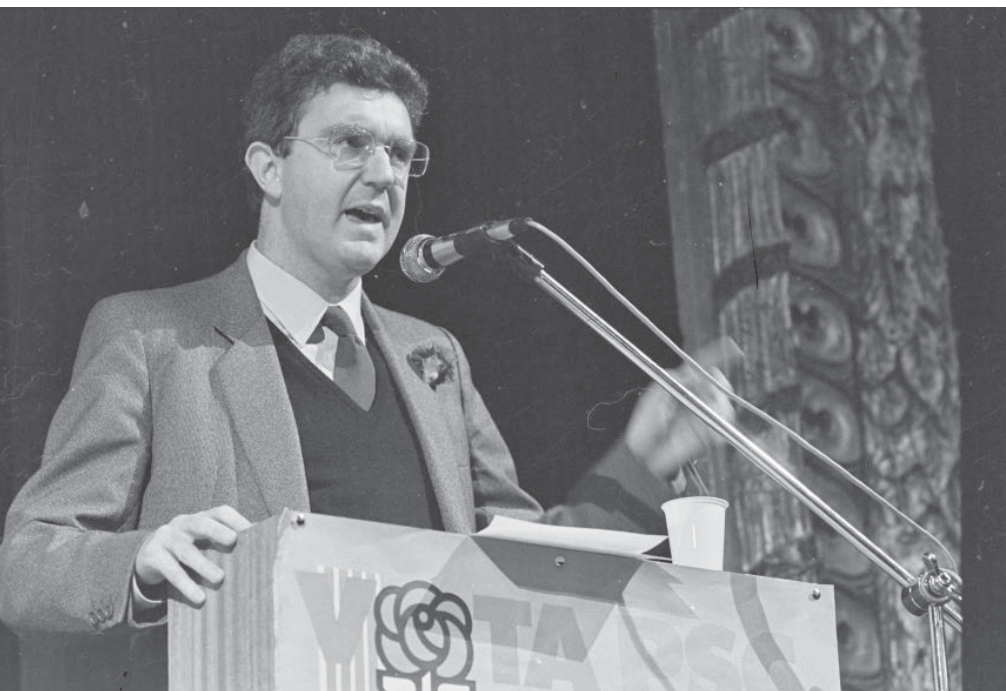
>> Discurs durant un míting del PSC al Teatre Municipal de Girona, el 1992.