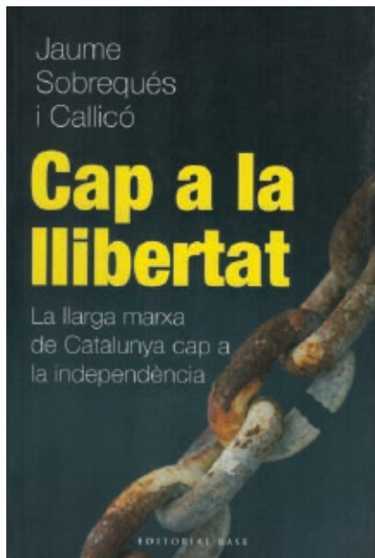
>> Cap a la llibertat (2013).