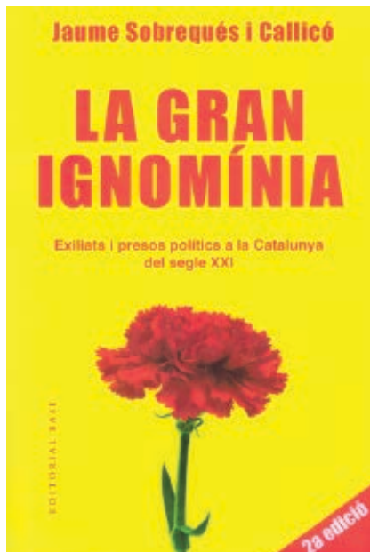
>> La gran ignomínia (2018).