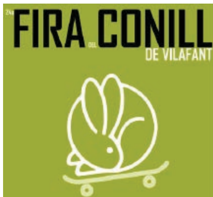
>> Cartell de la Fira del Conill de Vilafant.

Altrament, Figueres, de moment, obre al veïnat de la zona de migdia de la ciutat els 5.730 m 2 que envolten l'antiga presó; l'edifici (1917) queda per merèixer. Tot i que una part es destinarà a aparcaments, es tracta d'espais verds, i precisament els barri de la presó i de la Creu de la Mà, amb pocs indrets enjardinats, eren dels que més en necessitaven. Curiositat: per fer-hi efectiu l'accés dels contribuents caldrà enderrocar la paret que exhibeix el mural de ceràmica (que caldrà traslladar) Cinc visions d'un espai empordanès , d'Anson, Lleixà, Ministral, Pujolboira i Roura (el Grup 69), que van pintar el 1984 en homenatge a Dalí.