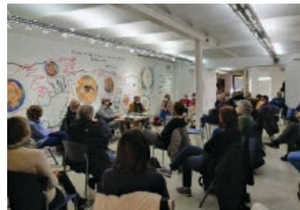
>> Presentació del dietari 2017 a l'Espai Eat Art, a Banyoles.