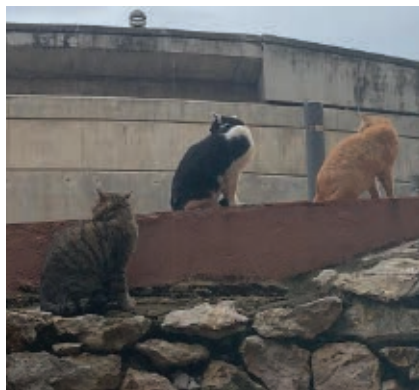
>> Tres gats d'una de les colònies de Figueres.

Gats | A Figueres hi ha sis-cents gats sense amo, agrupats de deu en deu en seixanta colònies. Totes les xifres són rodones, entre altres raons perquè hi ha gats esquerps que canvien de bombolla. SOS Mininus de Carrer reuneix trenta veïns voluntaris que en tenen cura, a raó de dues colònies per cap, acompanyats per la regidoria de Medi Ambient i Espai Públic.