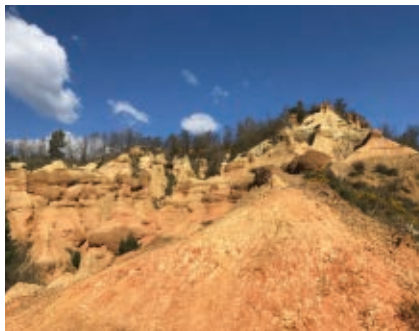
>> Els esterregalls d'All.

El país dels Esterregalls | El Centre d'Interpretació del País dels Esterregalls d'All, al municipi d'Isòvol, acaba d'obrir les portes just sota la plaça de l'església de Santa Maria d'All. Aquest nou espai, finançat pels FEDER i la Diputació de Girona, reuneix els aspectes culturals i geològics del municipi. D'una banda, es poden visitar les restes del cementiri medieval del segle IX, algunes cases i un tram de carrer del poble del segle XIV. De l'altra, un audiovisual i diversos plafons expliquen les particularitats geològiques i el jaciment arqueològic dels Esterregalls. Es coneix amb aquest nom una zona plena de xaragalls o badlands que destaquen entre el paisatge cerdà per les incisions erosives produïdes per l'aigua quan s'escorre sobre