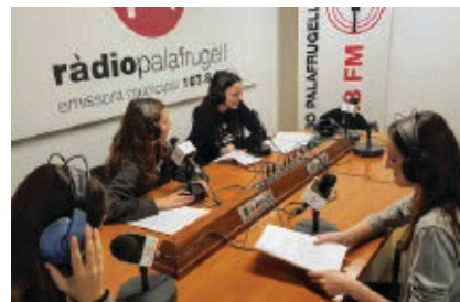
>> Alumnes d'ESO fent un programa de ràdio.