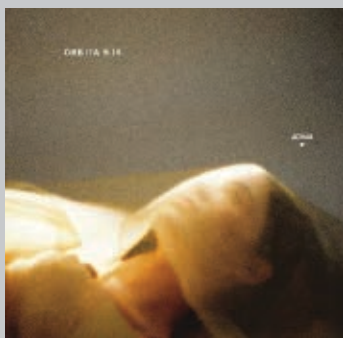
JOINA. Òrbita 9.18 . Microscopi, 2021. < www.joinacanyet.com >

bé cal fer una mirada als interessants videoclips de promoció que hi ha al web de la cantant i compositora.