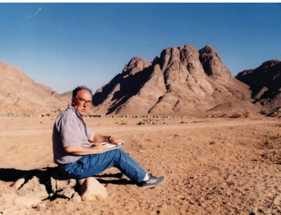
>> Al Sinai l'any 1997.

viure sense llegir és perillós, perquè obliga a conformar-se amb la vida pedrada.