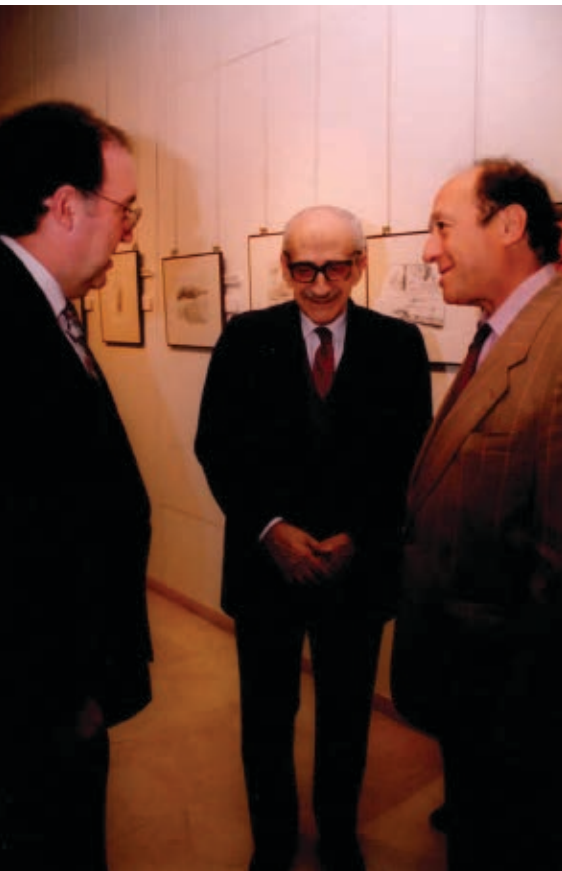
>> Amb Ramon Sala i Manuel Gutiérrez Mellado a Madrid, l'any 1992.

«Trobo trets comuns entre Pla i Azorín: la manca de petulància, la contemplació del dia a dia, una gran importància de l'adjectiu i una certa sintaxi afrancesada»