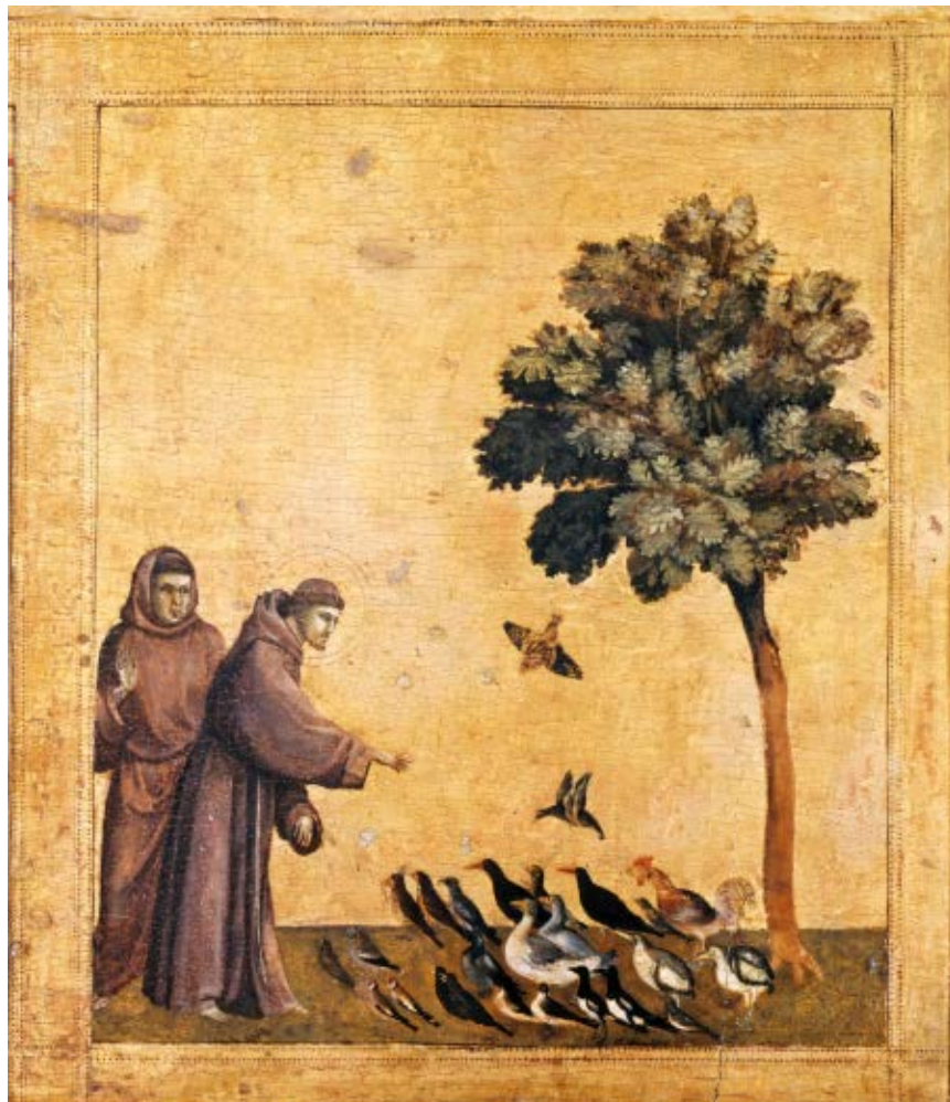
>> Francisc d'Assís alimentant els ocells, de Giotto.

Al Llibre dels àngels , Eiximenis es refereix a un clergue que, en comptes de seguir «la doctrina i les petjades de Nostre Senyor Jesucrist», actuava com el franciscà panxut i mandrós de la tradició literària medieval. Aquest clergue destinava els «béns del patrimoni de Jesucrist» a tenir «grassa taula», és a dir, a menjar i beure bé, en comptes de fer-los servir per ajudar els pobres i les causes pies. Amb els seus textos, Eiximenis no només va denunciar, com a moralista, aquestes males pràctiques, sinó que, com a conseller polític, va donar eines per ajudar els qui, com va dir en el Llibre de les dones , «sofreixen una pobresa i una misèria terribles amagadament en llurs cases».