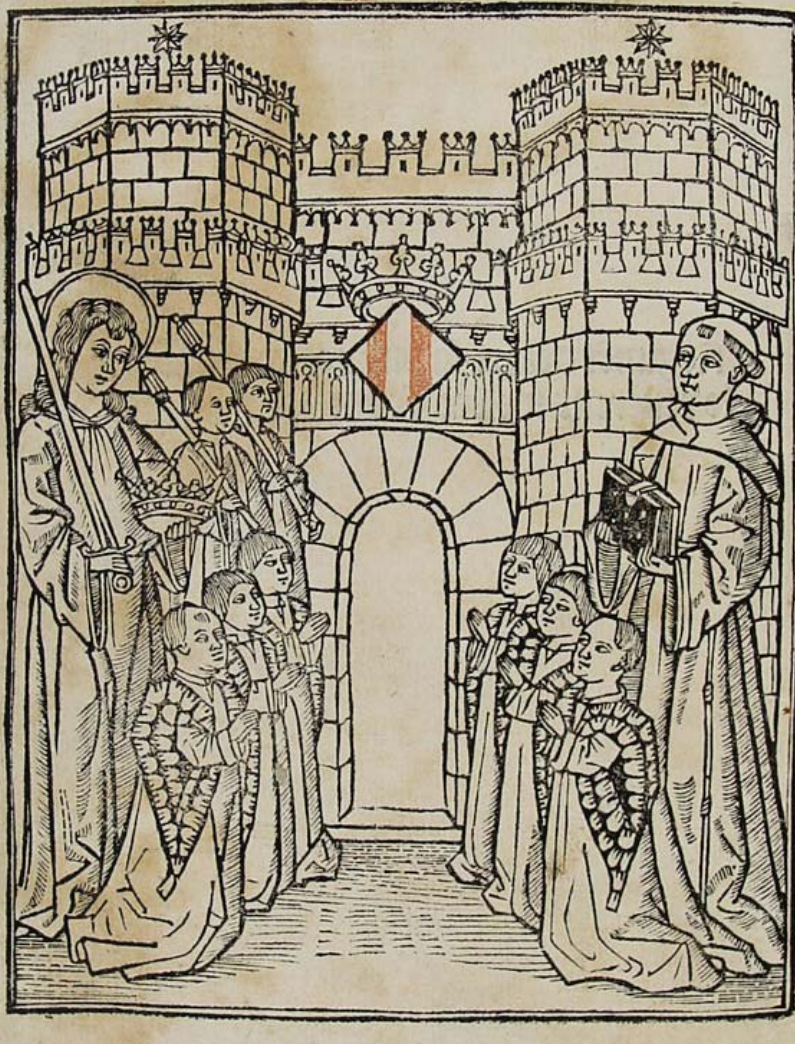
>> Eiximenis lliurant el Regiment de la cosa pública als jurats de l'Ajuntament de València.

«a temps cert», és a dir, en un període determinat de temps.