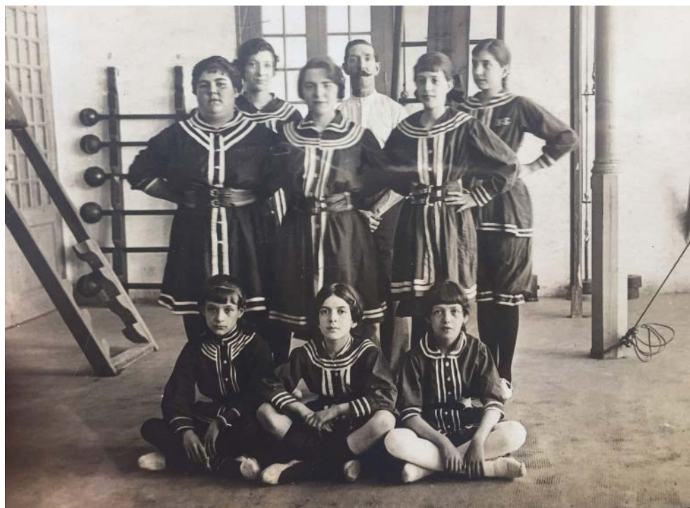
>> Un grup de noies gimnastes amb el seu professor, a la primera dècada del segle XX, guarnides amb xandalls de l'època, molt semblants als banyadors. Si bé l'autor i la localització són desconeguts, podria tractar-se de la classe femenina de Ramon Balme, a l'actual Fontana d'Or.

sius que els espectadors contemplaven fascinats. És en aquest context que, des de la iniciativa privada, arreu d'Euro-