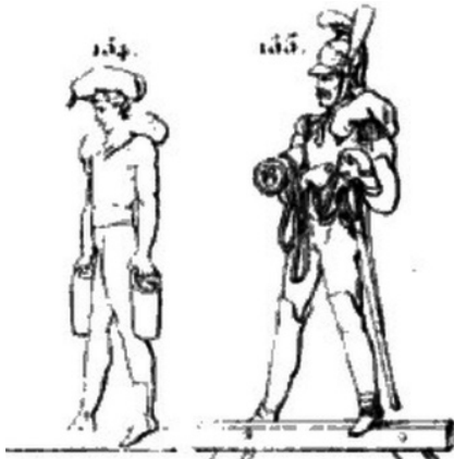
>> Imatge d'una làmina del manual de gimnàstica de Francisco Amorós, que representa la preparació (esquerra) per aguantar les càrregues que havia de portar un soldat (dreta).

pa comença la penetració progressiva de la gimnàstica civil i la promoció dels seus beneficis per a la salut corporal, moment en què la nova burgesia s'apropriaria dels valors d'aquesta i relegaria les primeres com a manifestacions marginals i contraculturals.