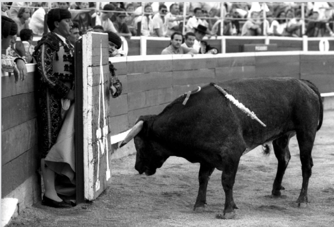
>> Un torero i un banderiller protegint-se del toro rere la barrera.