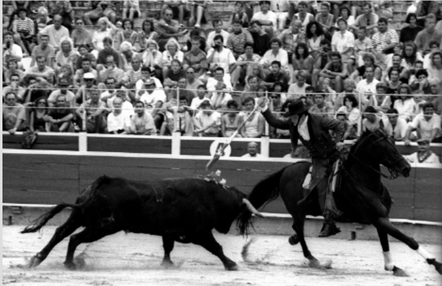
>> Un picador en acció.