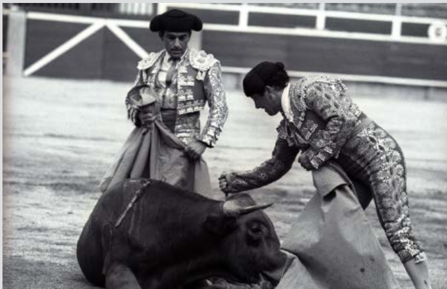
>> El toro, rematat amb un punyal.