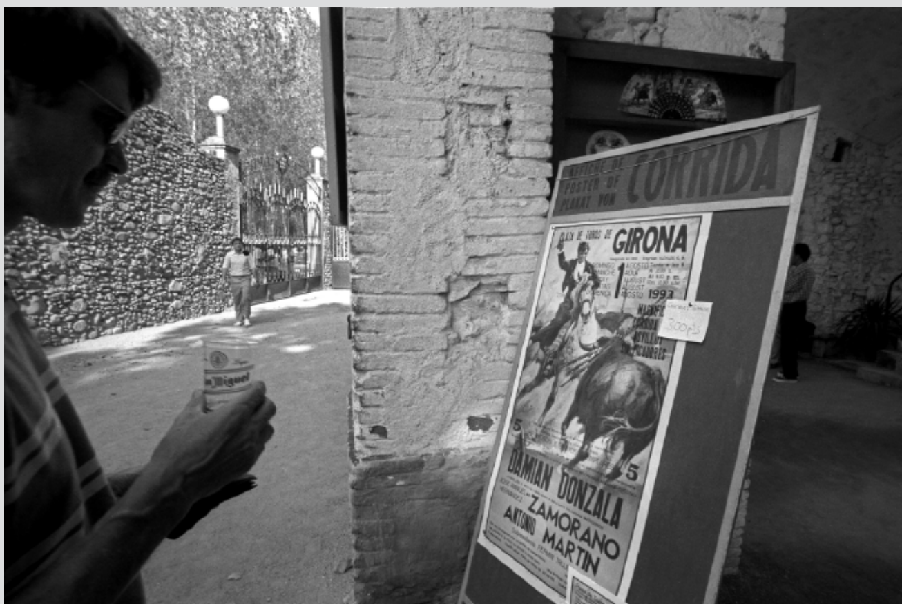
>> Cartell de la cursa de braus celebrada l'1 d'agost de 1993 a Girona.