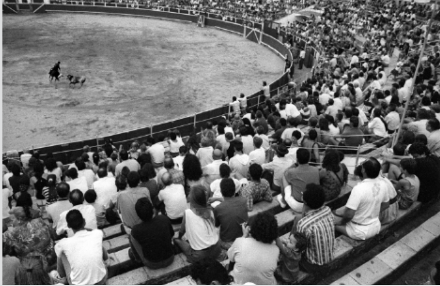
>> Un moment de la cursa.