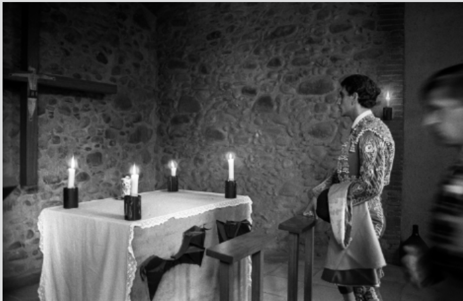
>> Un torero resant abans de sortir a l'arena.

Veig les imatges que Lluís Serrat va aconseguir de la plaça de toros de Girona i torno a la sensació de tedi. De tarda inacabable. De món que no puc entendre de cap de les maneres. I el tedi torna amb força amb la foto que retrata la banda de música, cares pansides, ulls fatigats, com si toquessin després de dinar en un bar de menús. Fins i tot el torero que tria l'espasa per a l'estocada sembla un turista a la recerca d'un abans de tornar al grup de l'agència de viatges.