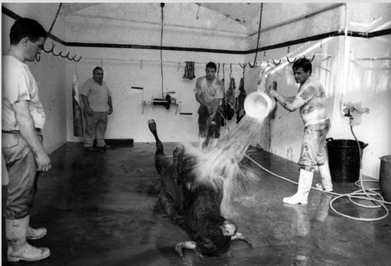
>> Un operari llançant un cubell d'aigua sobre el toro mort.