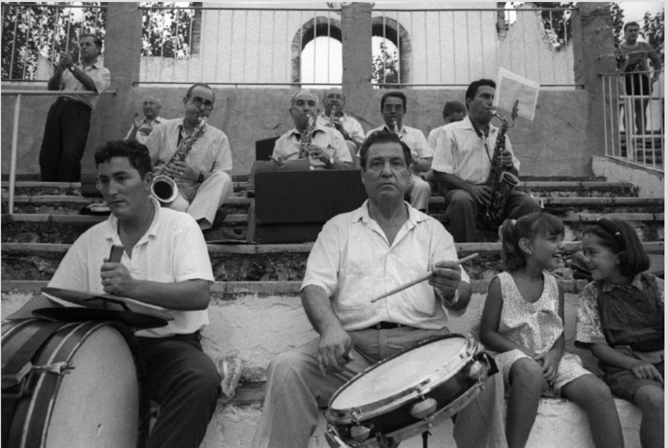
>> Una banda de música actuant durant la cursa.