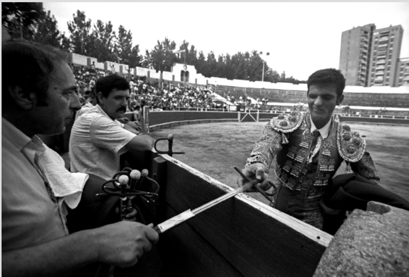
>> Un torero agafant l'espa.