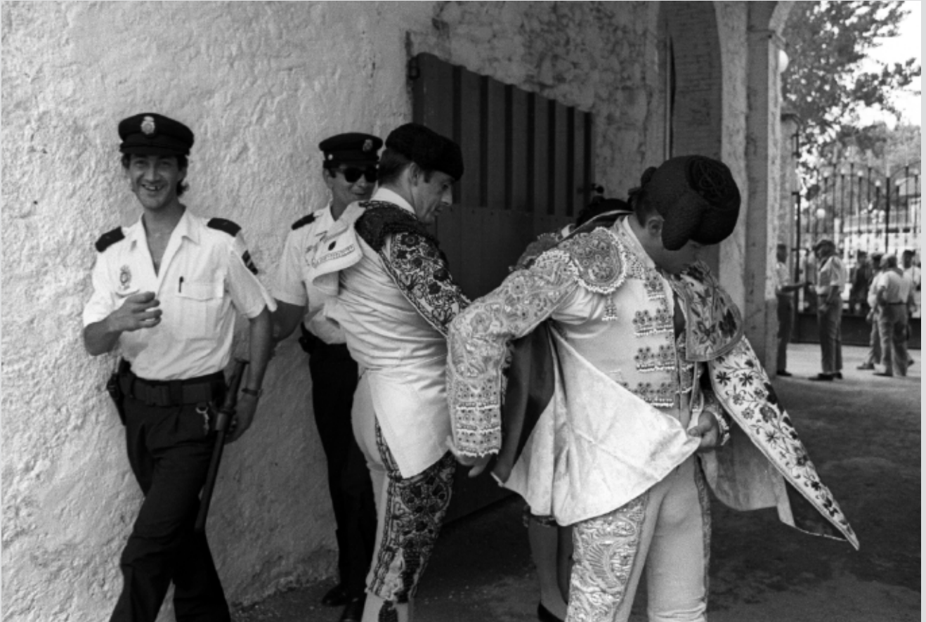
>> Toreros preparant-se en presència de dos policies.