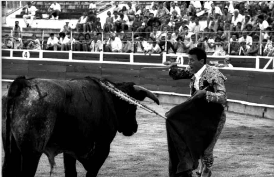
>> El torero just abans de clavar l'espasa al toro.