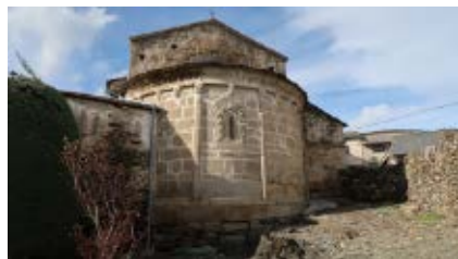
>> L'església de Sant Esteve de Guils, Bé Cultural d'Interès Nacional (BCIN) en la categoria de monument històric.

Aquest títol no només protegeix l'edifici, sinó que pretén evitar que s'alterin els voltants de l'església, per preservar-ne el valor i la bona visua-