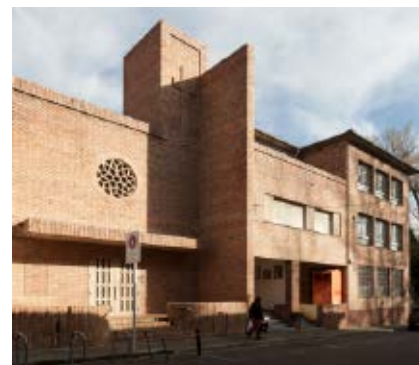
>> L'antic convent de la Divina Providència, ara propietat de l'Ajuntament d'Olot.

El festival Sismògraf, impulsor d'un projecte europeu | S'ha creat una iniciativa nova, la Big Pulse Dance Alliance, en la qual dotze festivals i cases de la dansa contemporània d'arreu de la Unió Europea treballaran de forma conjunta per enfortir el sector. Serà finançada per la Unió Europea i tindrà una durada de quatre anys. El festival Sismògraf és un dels participants en aquest projecte, que junt amb els dels altres països col·laborarà en les produccions d'espectacles nous, buscant el talent i fomentant el lideratge de la dansa, entre altres objectius. Una de les voluntats d'aquesta acció és diversificar la programació de gran format i arribar a un públic més ampli a través de la programació a l'aire lliure.