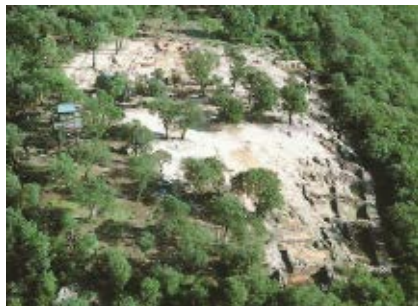
>> Vista aèria del jaciment de Montbarbat.