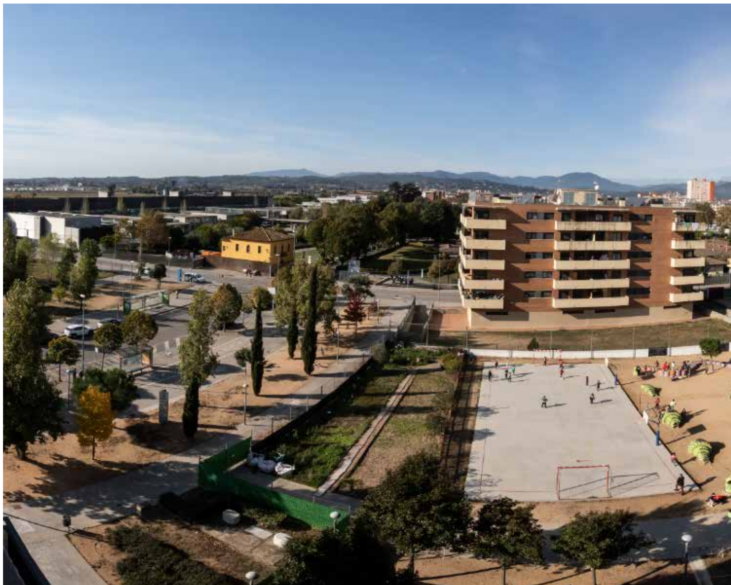
>> Un edifici de Salt que va ser ocupat, al costat d'una zona esportiva.

ronines, que s'expliquen per aquesta tendència de voler marxar de la ciutat que dèiem més amunt o per una qüestió menys clara, com podria ser empadronar-se a la segona residència perquè en cas que es doni un altre confinament, es pugui fer en els molt apreciats entorns empordanesos, garrotxins, ceretans... L'Agència Catalana de Notícies informava aquest estiu de diversos ajuntaments que reflectien aquests creixements: Castell-Platja d'Aro; el Port de la Selva; Cadaqués; Cruïlles, Monells i Sant Sadurní de l'Heura, o Bolvir. I a final de setembre La Vanguardia parlava dels casos de Ger, Meranges i Palau-sator.