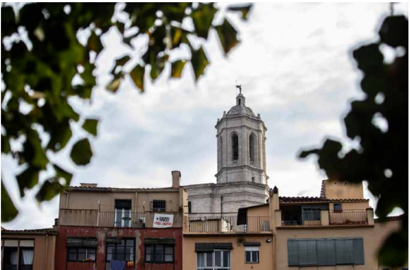
>> Els habitatges turístics han generat polèmica al Barri Vell de Girona.

Resultat d'això són, per exemple, les notícies sobre els increments sobtats d'empadronaments a molts municipis petits, entre els quals en figuren molts de les comarques gi-