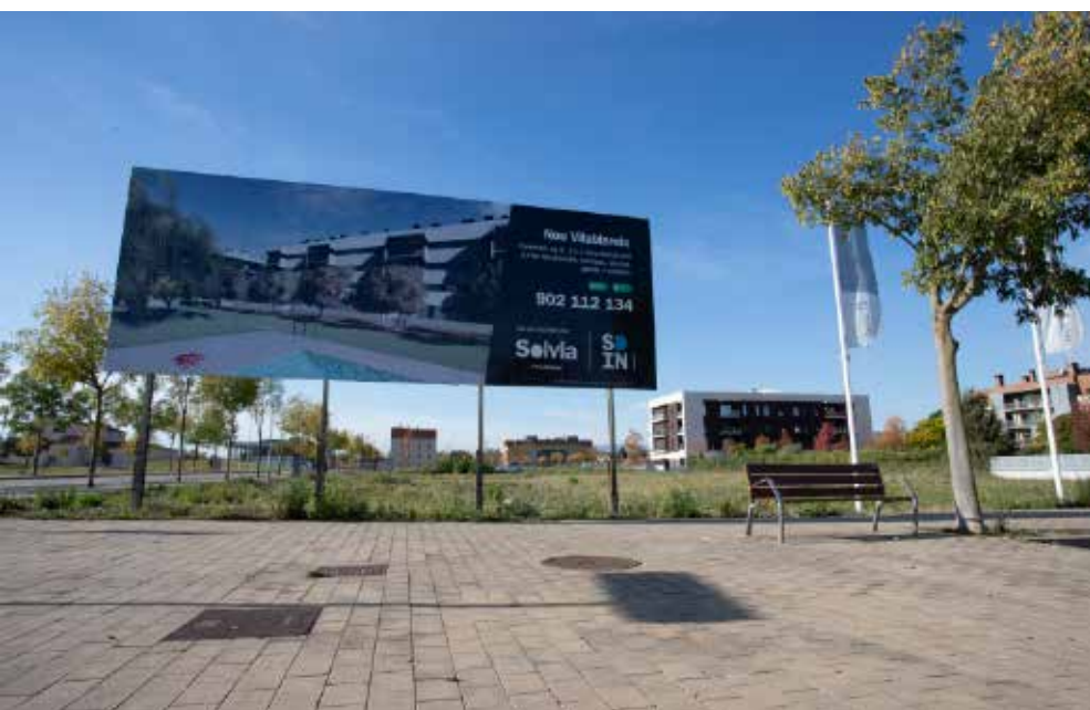
>> Oferta de sòl i habitatges en venda entorn de Girona.

Davant tot això, les administracions poden fer bàsicament dues coses: esperar que passi (o no), o fer que passi. Per dir-ho en termes positius, s'obre una nova oportunitat per reactivar alguns territoris i ciutats que prou que ho necessiten, i preparar-los perquè sigui ben aprofitada és una responsabilitat ineludible: les polítiques públiques d'habitatge allà on no n'hi ha, els projectes de renovació de centres urbans i barris anèmics, el reforç de les xarxes de serveis públics i de la mobilitat col·lectiva, la preservació dels espais lliures de les perifèries (hortes, rieres, boscos...) que donen la qualitat de vida i de paisatge quotidians, etc. són polítiques sempre necessàries, però ara, de nou, més que mai.