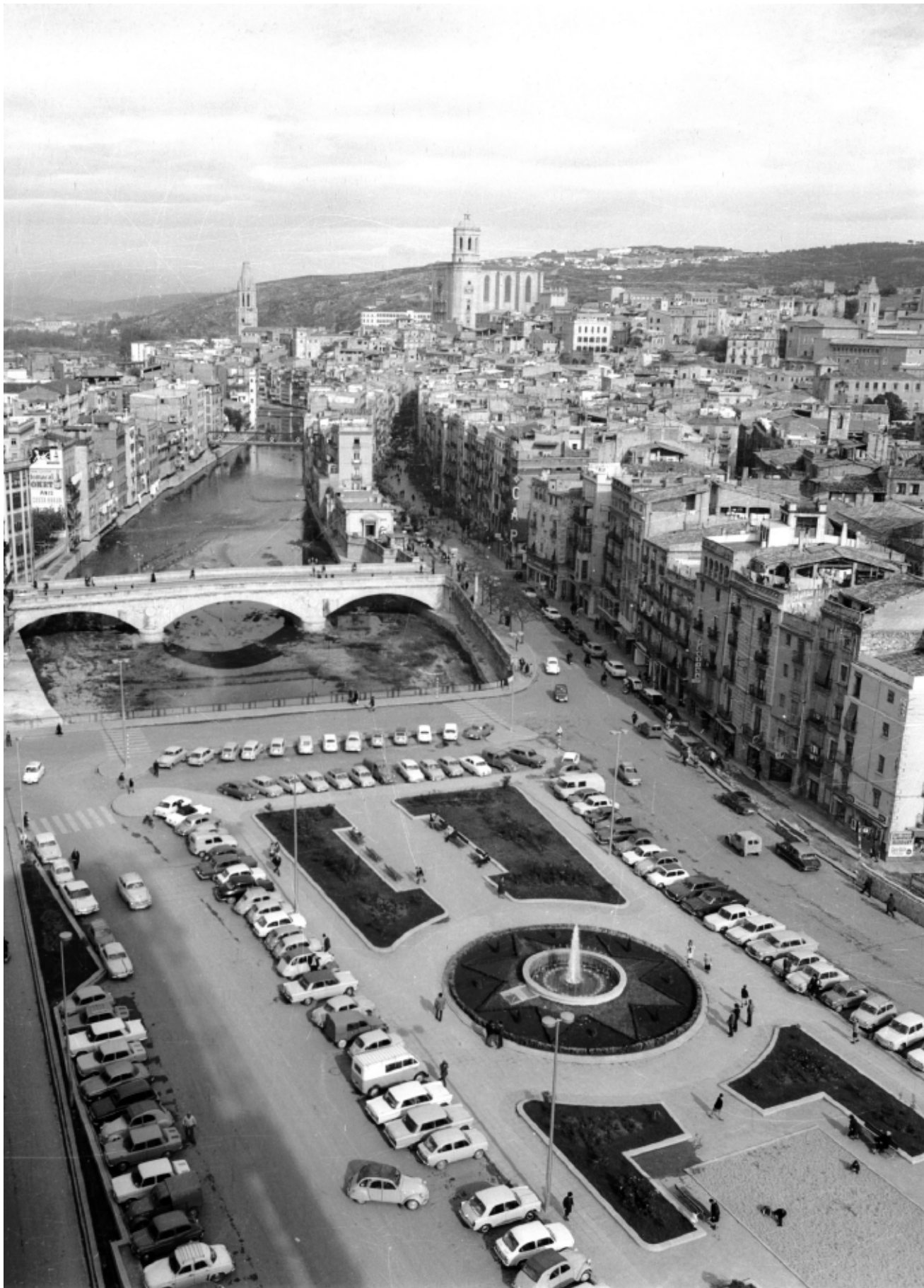
>> Vista aèria de la plaça de Catalunya de Girona, amb la Catedral al fons.