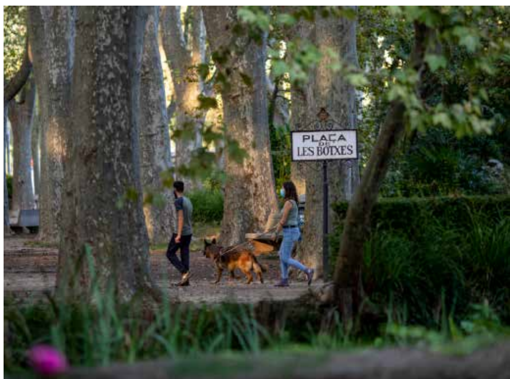
>> A dalt, gent passejant per la plaça de les Botxes. A baix, una escultura emergeix de la verdor, als jardins.

La carretera general va delimitar durant quasi un segle la Devesa, especialment a partir de final dels anys cinquanta, en què l'economia va fer un gran salt i el transport per carretera va començar a viure un moment accelerat amb els Ebros, Barreiros i Pegasos, i la socialització del turisme i els turismes. A partir del 1925, la premsa gironina es va omplir d'articles molt crítics contra l'asfaltatge de