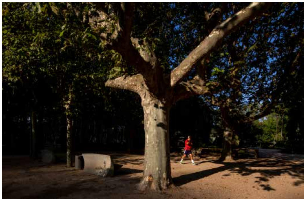
>> Banc, plàtan i caminant.

La ciutat d'aleshores valorava molt la Devesa i, a la seva manera, l'omplia de contingut, a imatge de la també excèntrica Casa de Campo de Madrid. Mentre es feien les obres per endreçar l'animat mercat del bestiar dels dissabtes al baluard de Bournonville, el 1960 l'Ajuntament va sentir la necessitat de portar-hi les Fires de Sant Narcís, les atraccions i el Certamen Industrial, Agrícola i Comercial, que fins aleshores s'instal·laven a la Gran Via de Jaume I. El centre de la ciutat començava a sentir la pressió dels cotxes, que propiciarien que no només la Devesa, sinó tot Girona quedessin buides de gent els caps de setmana.