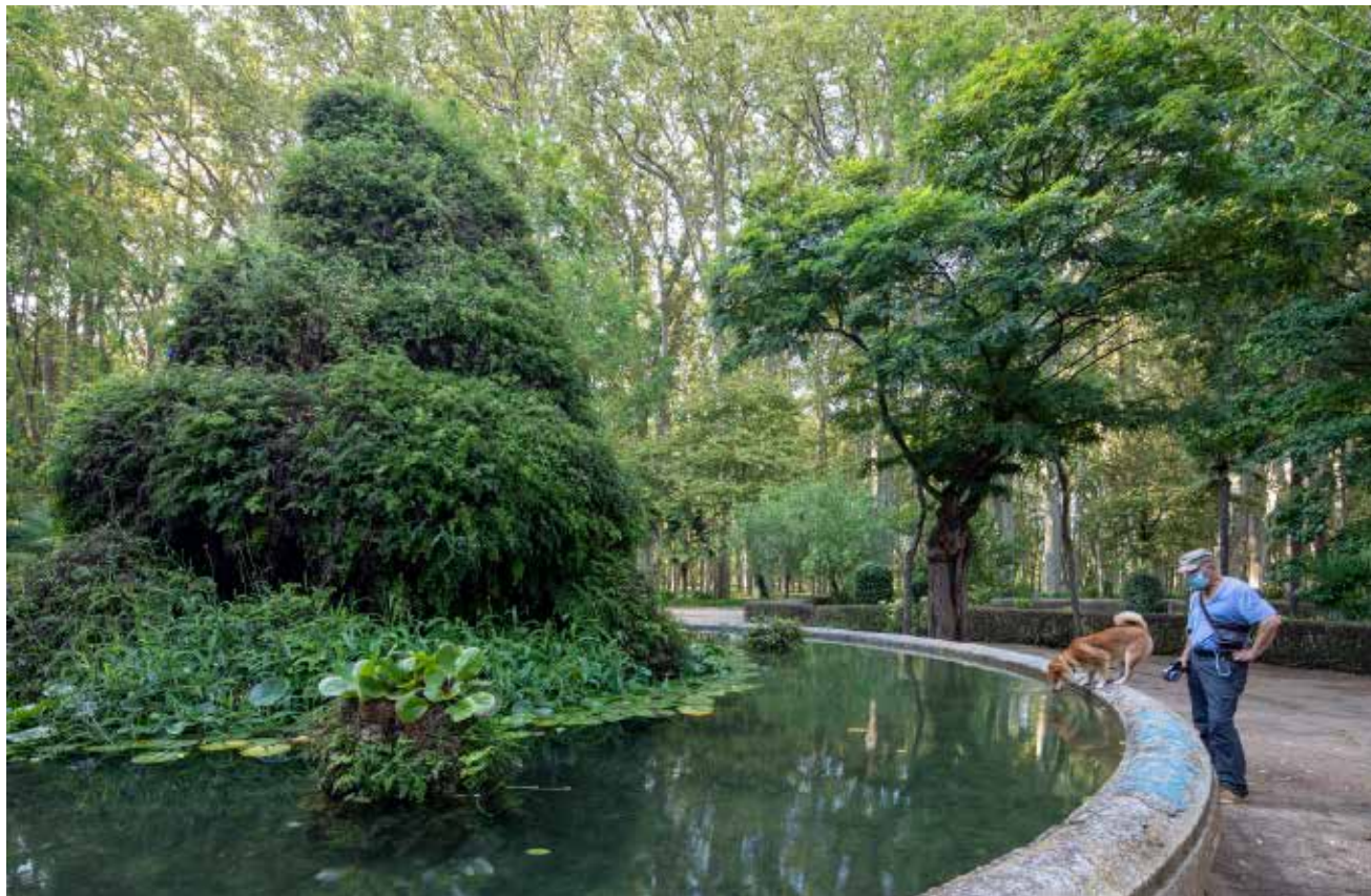
>> Home amb un gos al costat del brollador dels jardins.

Llistosella i Xavier Montsalvatge, que donava les claus per canviar l'espai i transformar-lo en com es coneix ara. I així, passades les Fires del 1987, van començar les obres del Palau de Fires, que van implicar la tala de vint plàtans, el trasllat d'una vintena més d'exemplars als vivers municipals i l'enderrocament, el mes de juny del 1988, d'una part del pavelló municipal de la Devesa. Del pavelló es va mantenir l'anomenat «hivernacle», avui frontera entre el Palau de Fires i l'Auditori Palau de Congressos. Precisament, el projecte de Llistosella i Montsalvatge preveia que l'hivernacle fos una mena de gran saló distribuïdor, un gran hall , foyer , rebedor o com es vulgui dir, d'accés al Palau de Fires i al Palau de Congressos que completava el seu projecte. El seu auditori no es va construir i els nous projectistes el van aixecar mirant al riu i sense integrar-lo al Palau de Fires.