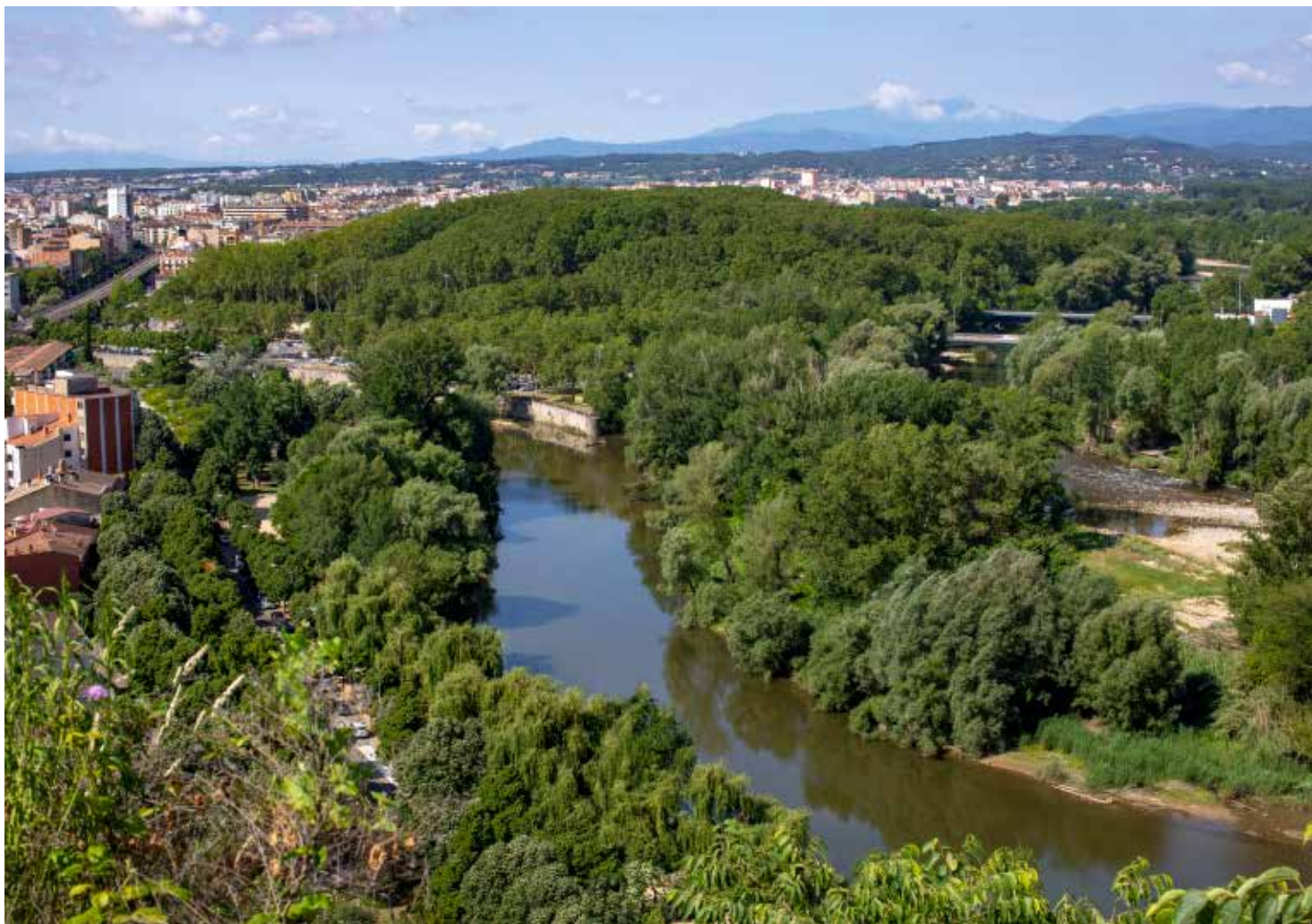
>> La Devesa i el Ter.

Perpinyà, al costat del Ter. Assenyala els més esvelts i els situa al passeig que condueix de l'actual esplanada de la Copa fins a la plaça de les Botxes: «Els diàmetres dels arbres del Cours Palmarole de Perpinyà i els de la plaça de les Botxes són molt similars: oscil·len entre els tres i els cinc metres».