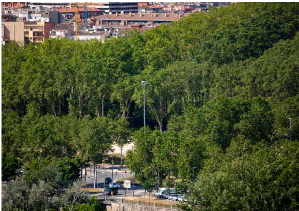
>> El nus de la Devesa.