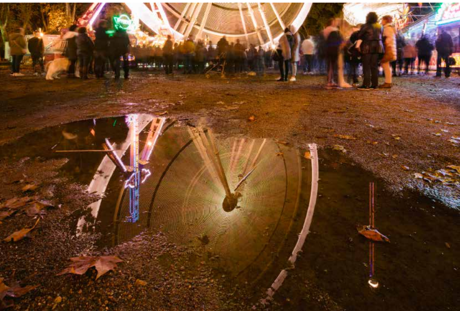
>> Bassa i gent al costat de la sínia que va ser instal·lada per les Fires de Sant Narcís del 2019.