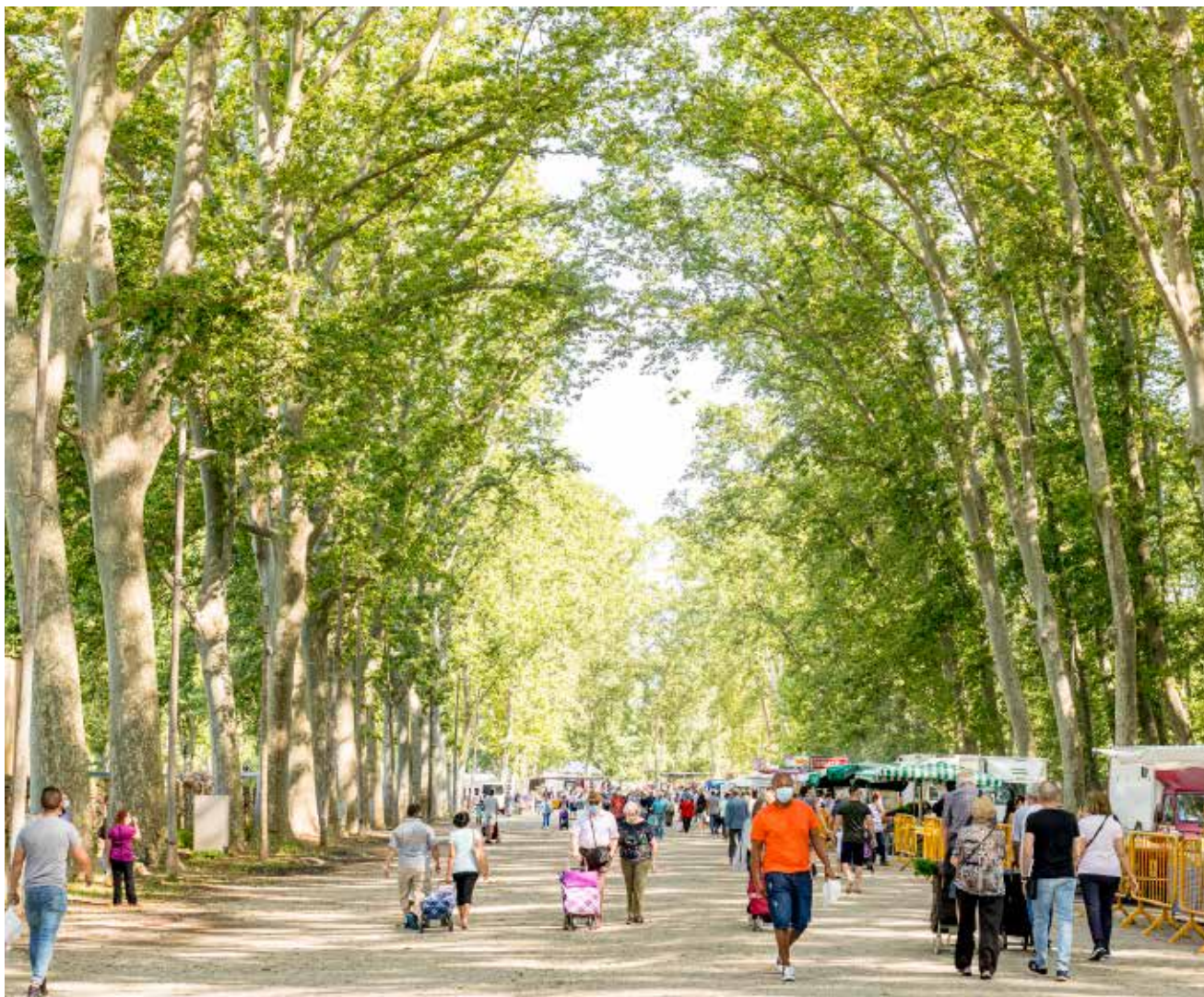
>> El mercat de la Devesa un dia de primavera del 2020.

maig del 1996, en què, coincidint amb el dia inaugural de Girona, Temps de Flors, es va obrir el pla d'accessos o nus de la Devesa, i els gironins van poder trepitjar la icònica rajola amb forma de fulla de plàtan, símbol i marca de Girona. La seva configuració definitiva va arribar quan a la punta nord-oest es va aixecar l'Auditori Palau de Congressos, que es va construir entre el 2001 i el 27 de maig del 2006, data en què es va inaugurar el nou equipament.