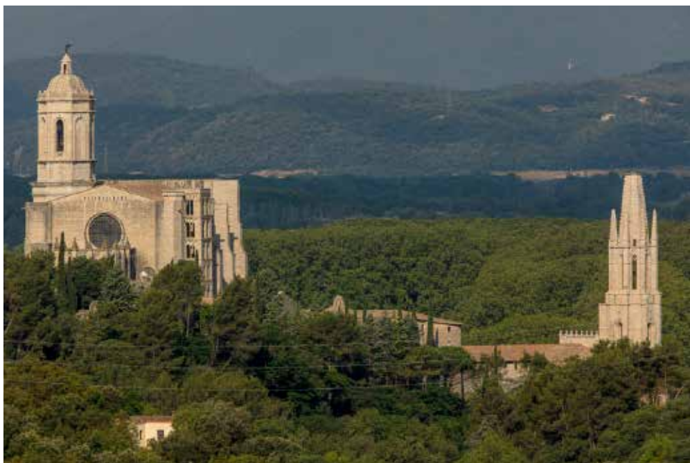
>> La Catedral, la Devesa i la basilica de Sant Feliu.

«Com és de suposar, he analitzat la realitat de la Devesa molt més enllà del fet purament botànic. D'altra banda, sobre la Devesa s'ha escrit molta literatura i costa dir coses purament originals. No he volgut fer una recopilació de dades i d'informacions, sinó una síntesi