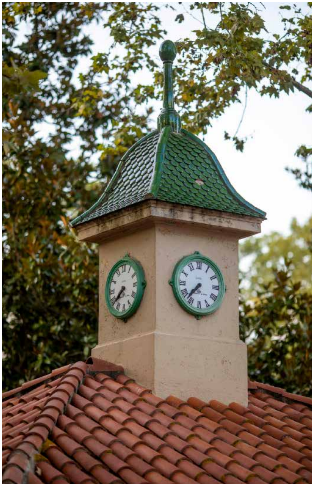
>> L'icònic rellotge de la Devesa.

De prop, on els arbres no deixen veure la Devesa, o de lluny, on els plàtans no deixen veure el parc, la Devesa continuarà marcant el ritme de les estacions i els gironins en parlaran quan algú s'anima a encetar un altre debat.