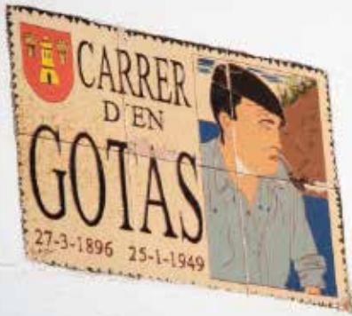
>> En Gotas era un pescador que es reia del piragüista nazi.

els enviava articles que publicaven amb un pseudònim.