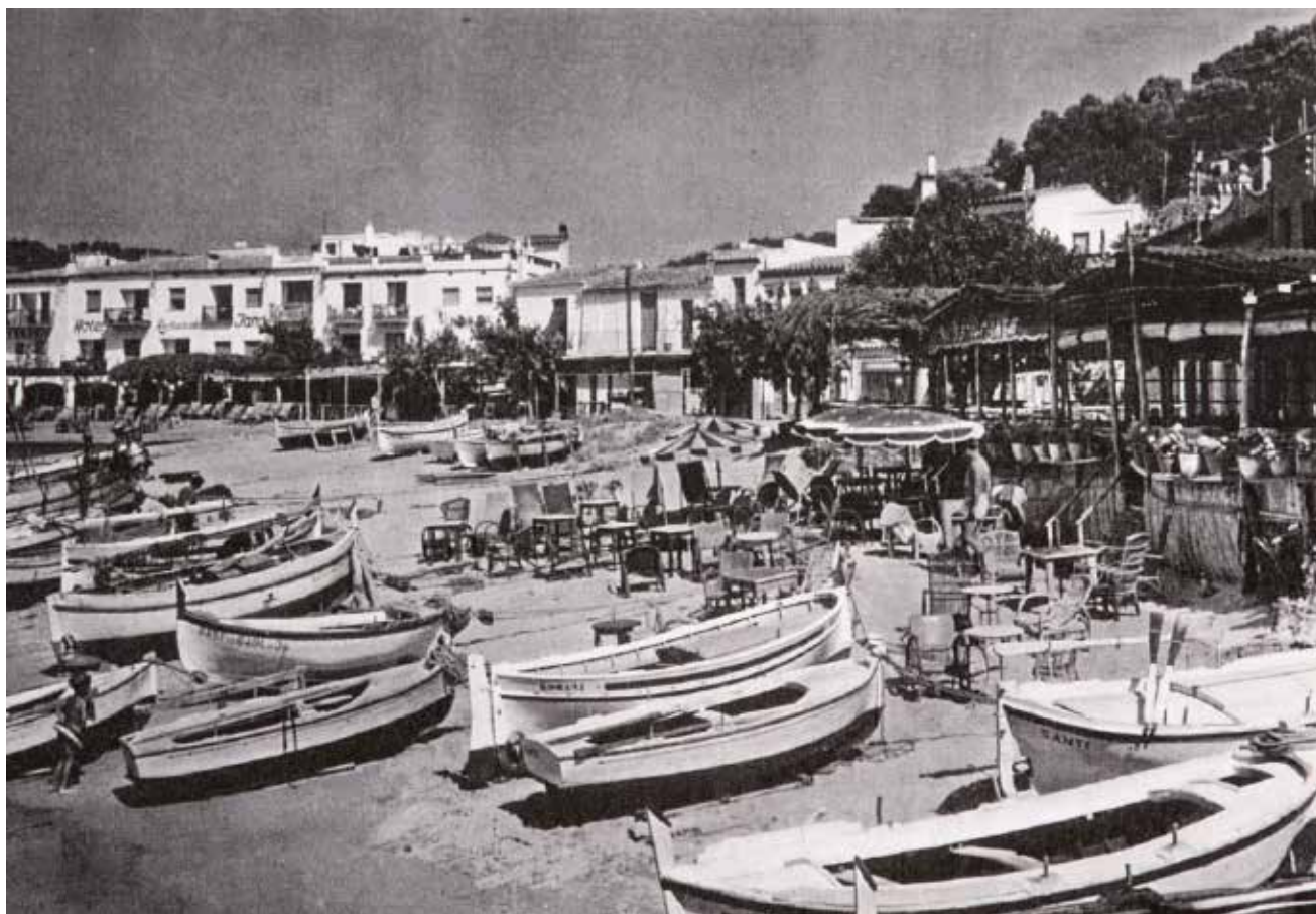
>> La platja de Tamariu als anys quaranta.

A Fidrmuc se'l qualificava d'espia brillant, i els aliats sospitaven que tenia milions a Suïssa —no es va demostrar. L'estada a Alemanya va ser curta, i els americans, encara que Fidrmuc fos reclamat per Txecoslovàquia, el van alli-