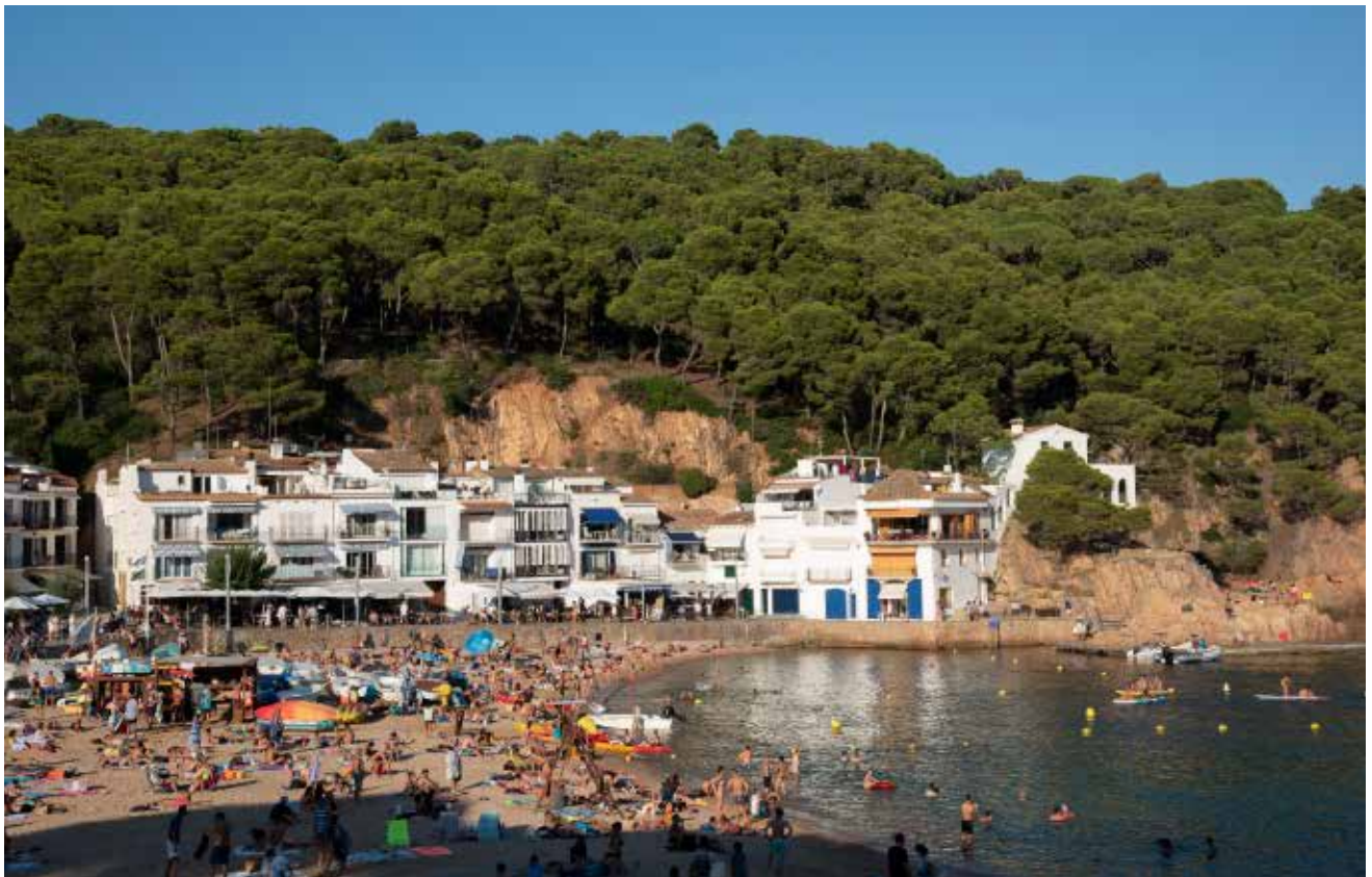
>> El passeig del Mar de Tamariu.

Quan la gent de Tamariu va descobrir que l'Aleman parlava d'ells en un llibre, es van sorprendre. Tothom el volia tenir. Ningú no havia tingut en compte que la platja de Tamariu es coneixia com la platja dels pobres . La gent benestant anava a Calella o a Llafranc.