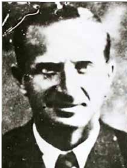
>> Una de les poques fotos que hi ha de l'espia nazi.

S'explica, i Fidrmuc ho explicava, que quan ell va enviar un informe