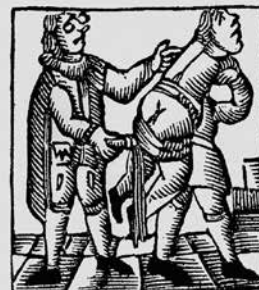
El mestre de miryons, segons una aca d'ofici del set-cents.

Generalitat de Catalunya Departament d'Ensenyament