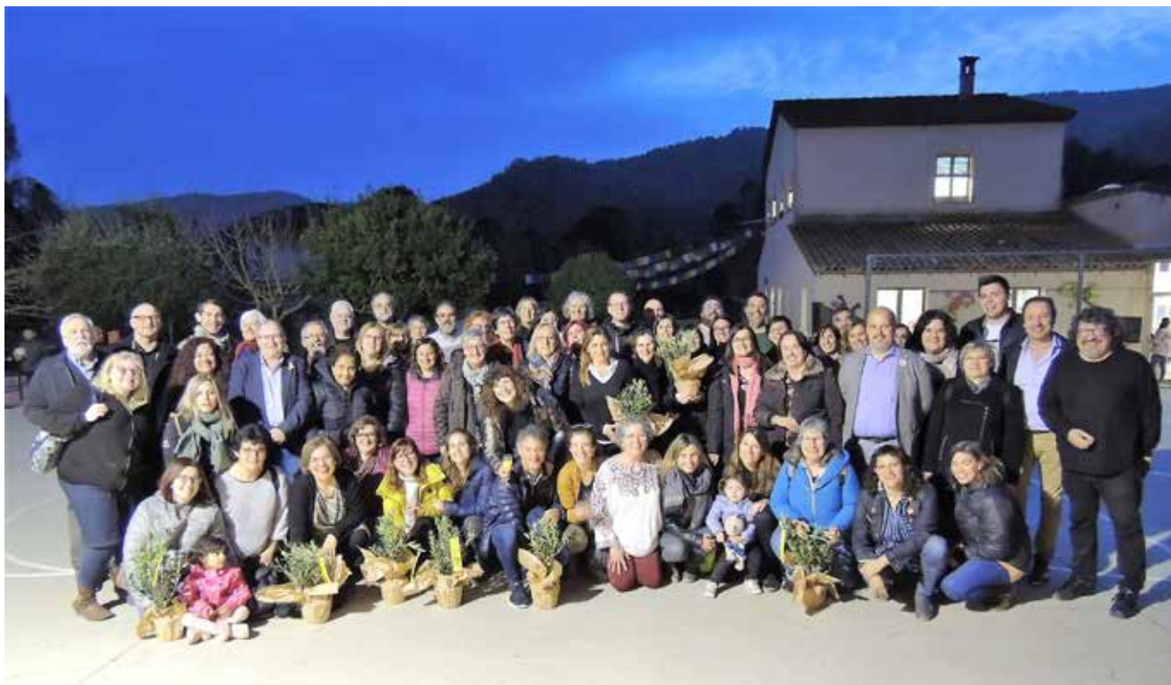
>> Participants in the act of celebration of the thirty years of the first rural school zones, at the school El Frigolet de Porqueres, on 29 February 2020.