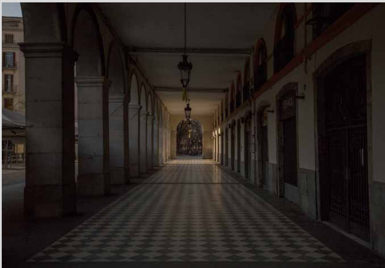
>> Les voltes de la plaça de la Independència de Girona.