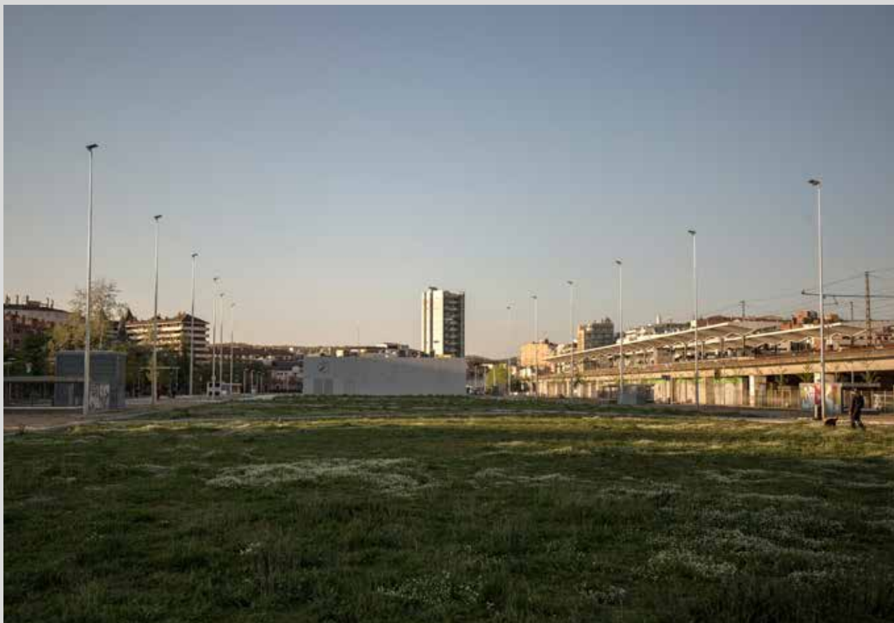
>> El parc Central de Girona.