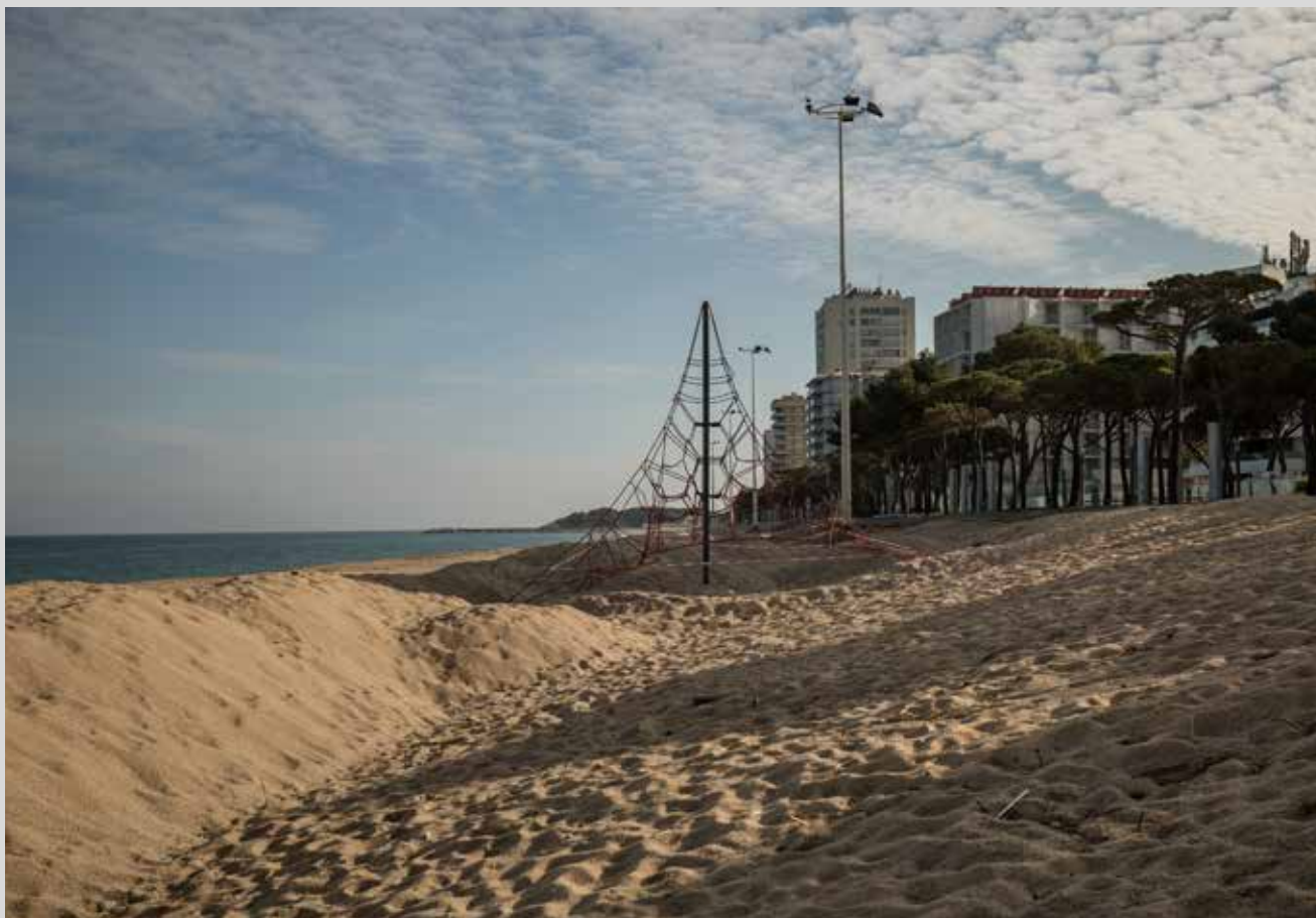
>> Platja d'Aro.