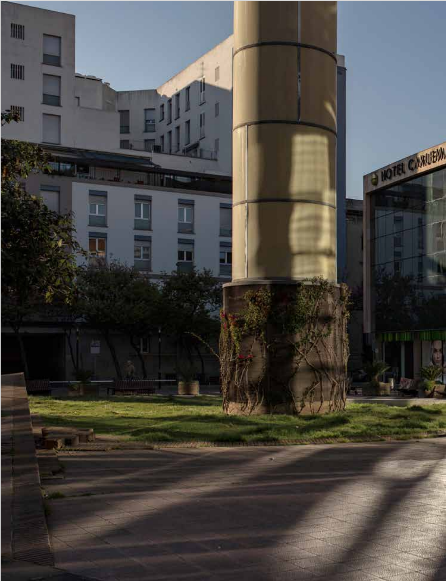
>> La plaça de Miquel Santaló de Girona.