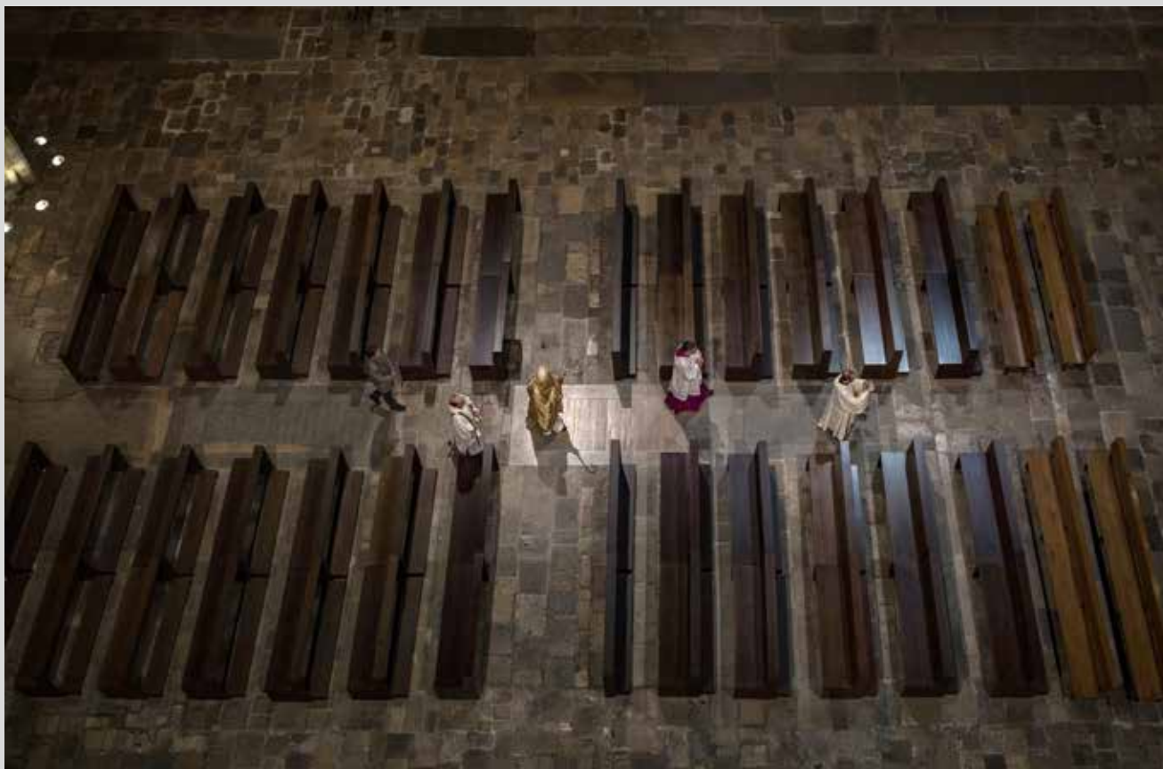
>> La catedral de Girona el Divendres Sant.