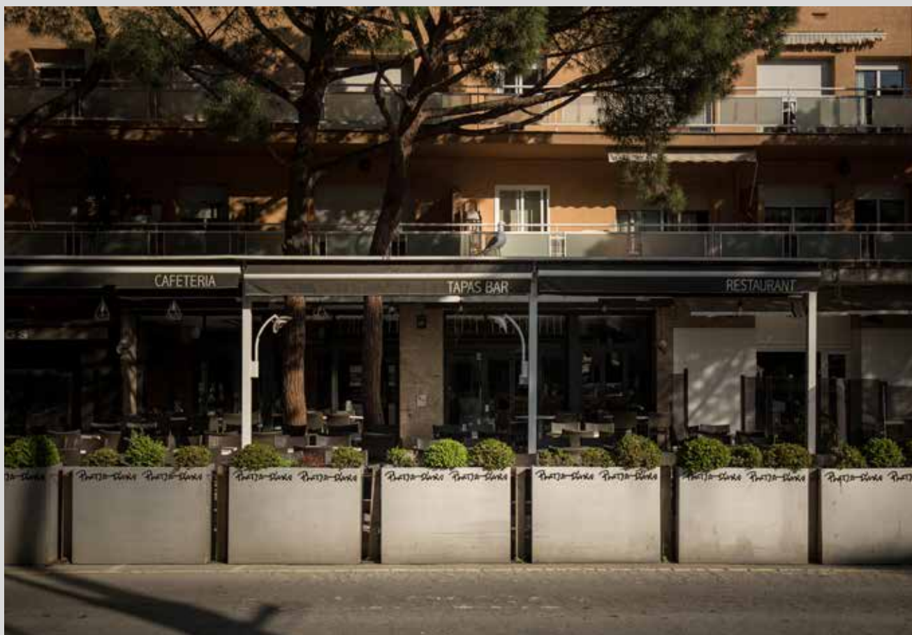
>> El passeig de Platja d'Aro.