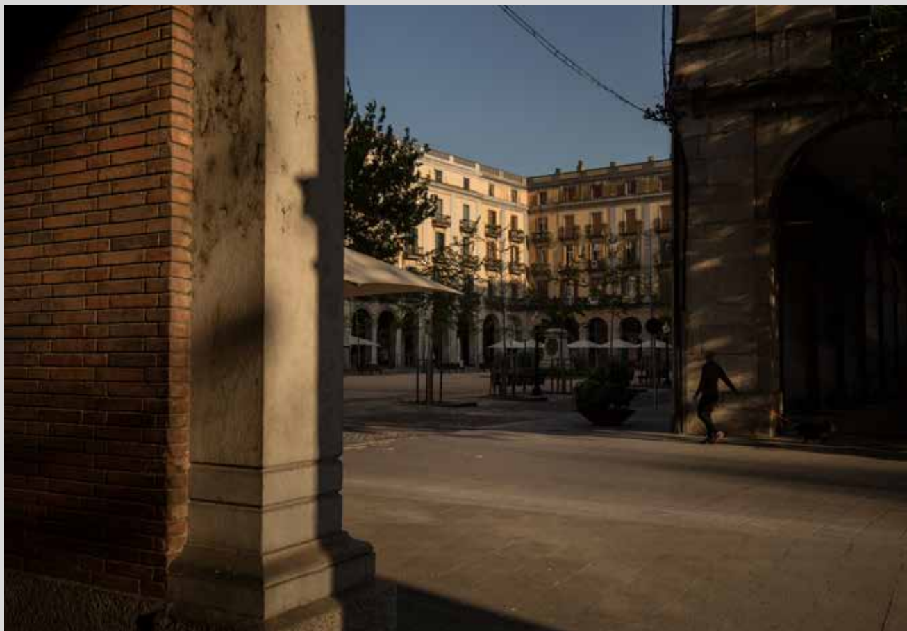
>> La plaça de la Independència de Girona.