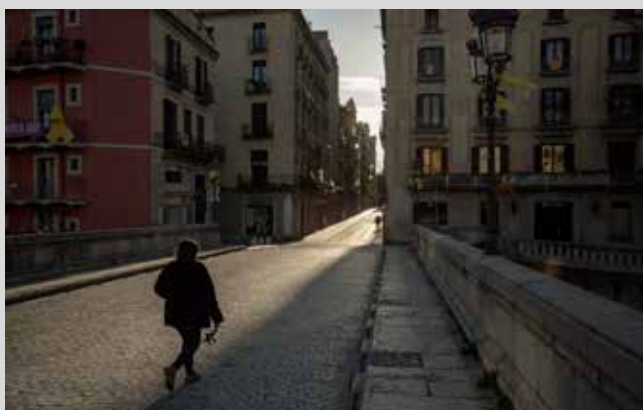
>> El pont de Pedra de Girona.