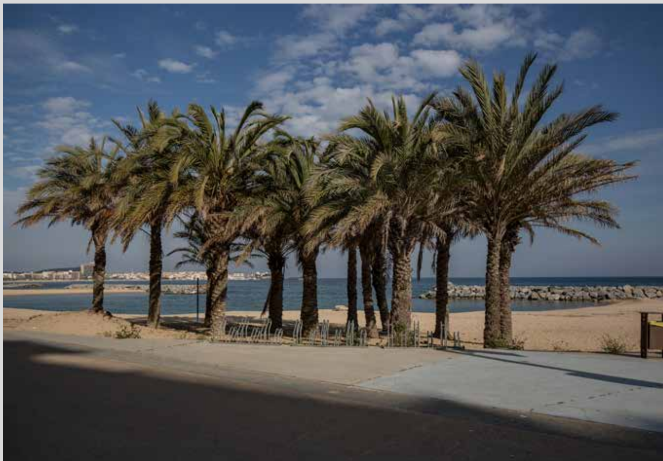
>> La platja de Sant Antoni de Calonge.