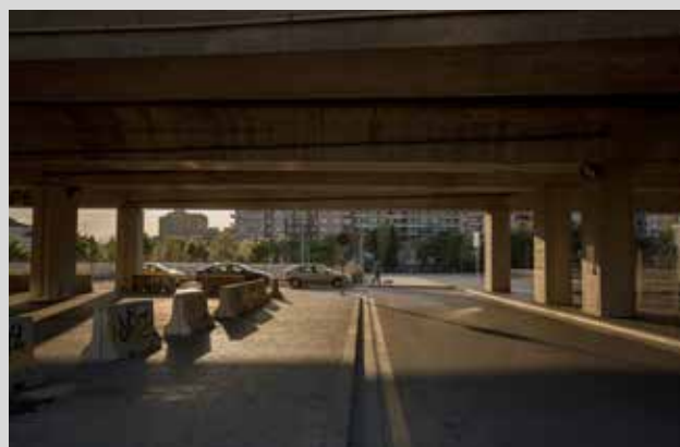
>> Un espai sota el viaducte, a Girona.

cara, si haurà valgut la pena sacrificar-se. Per a molts dels qui patiran el silenci dels éssers estimats que han perdut en aquesta guerra despietada, normalitzar l'allunyament humà obligat haurà estat un preu minúscul, comparat amb la pèrdua irreparable de la mort sense sentit ni lògica.