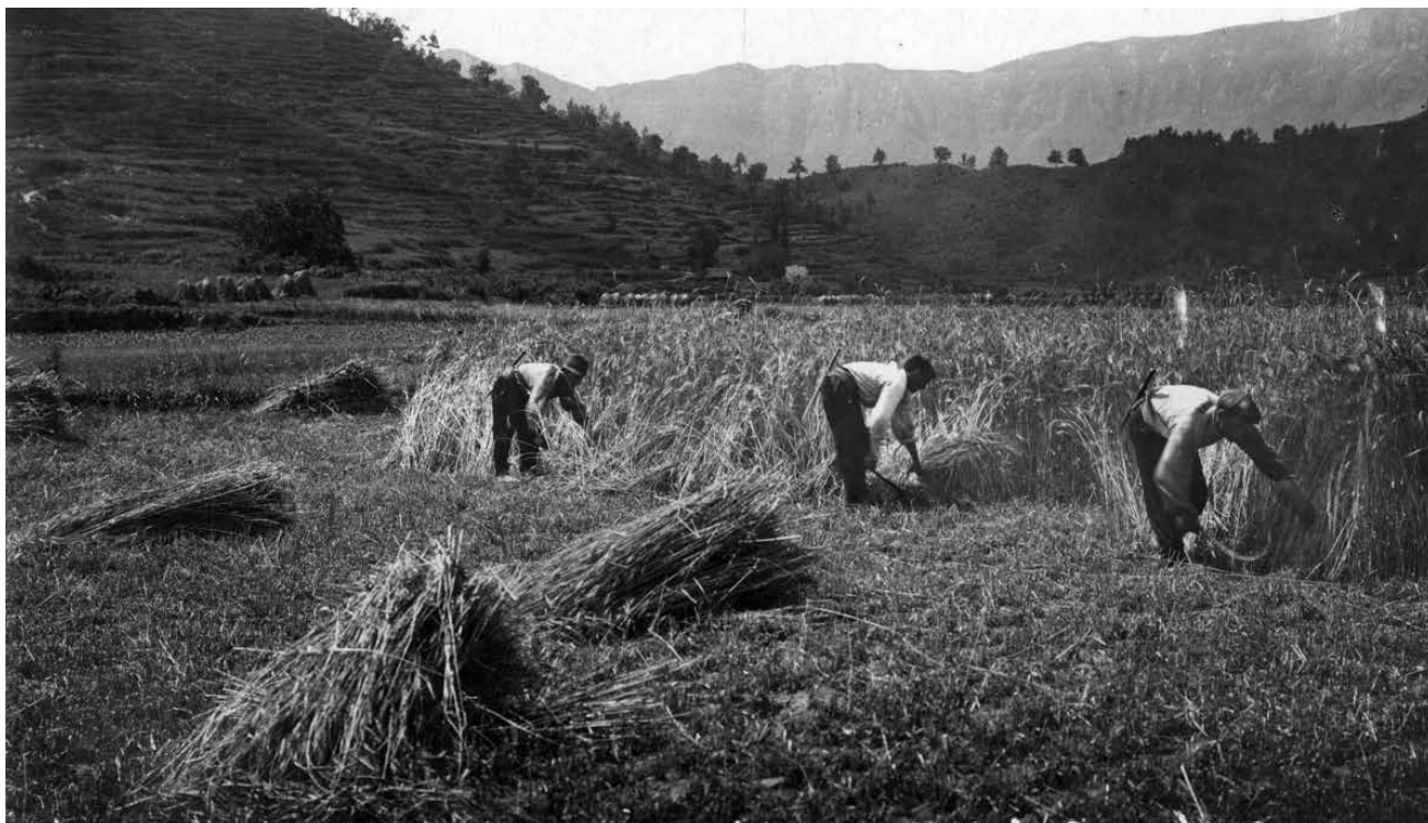
>> Segadors segant el blat amb falçs als voltants d'Olot, 1911-1944.

ciar-se als Països Baixos i a Anglaterra en el segle XVII i que es fonamentava en un cultiu més intensiu de la terra, amb rotacions sense guaret i una integració més gran de la ramaderia dins les explotacions agrícoles.