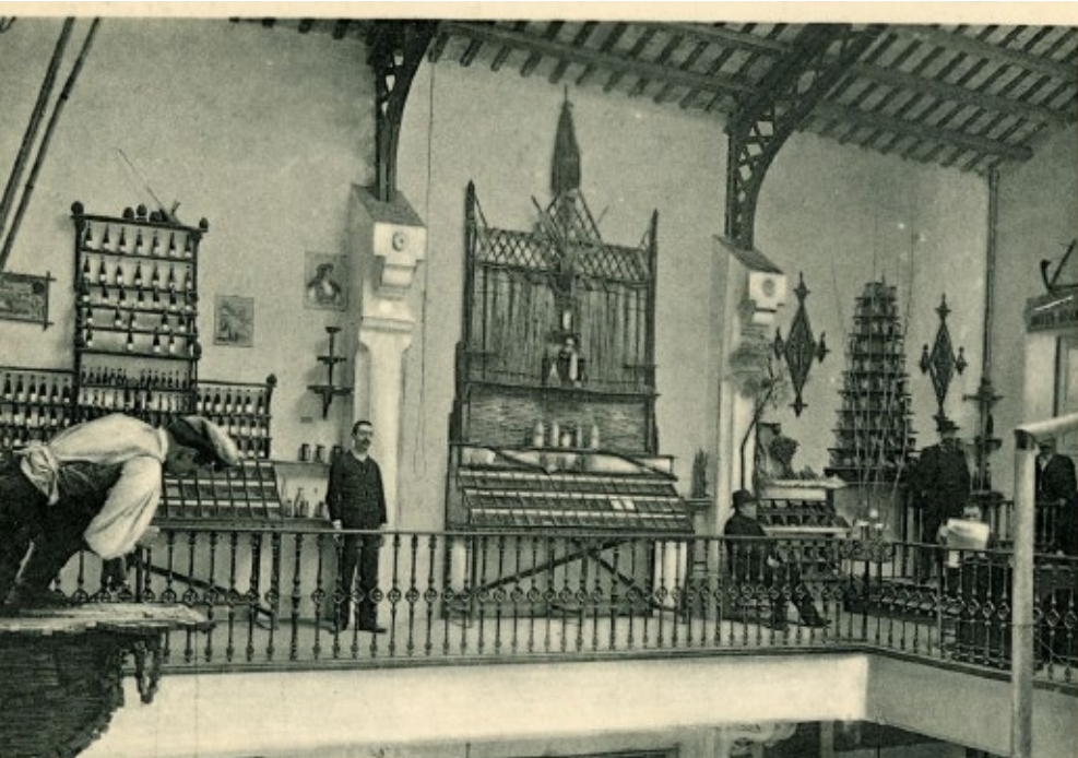
>> Exposició permanent de productes de la Cambra Agrícola de l'Empordà, creada l'any 1900.

sent de caràcter biennal, basades en l'alternança del blat amb un segon any de faves o blat de moro, però destaca que al partit judicial de Santa Coloma es practica una rotació a tres anys: el primer any se sembrava mestall (blat i sègol); el segon any, blat de moro i mongetes, i el tercer any, tramussos o patates (que podien, alhora, alternar-s'hi, i donaven lloc així a un cicle de sis anys).