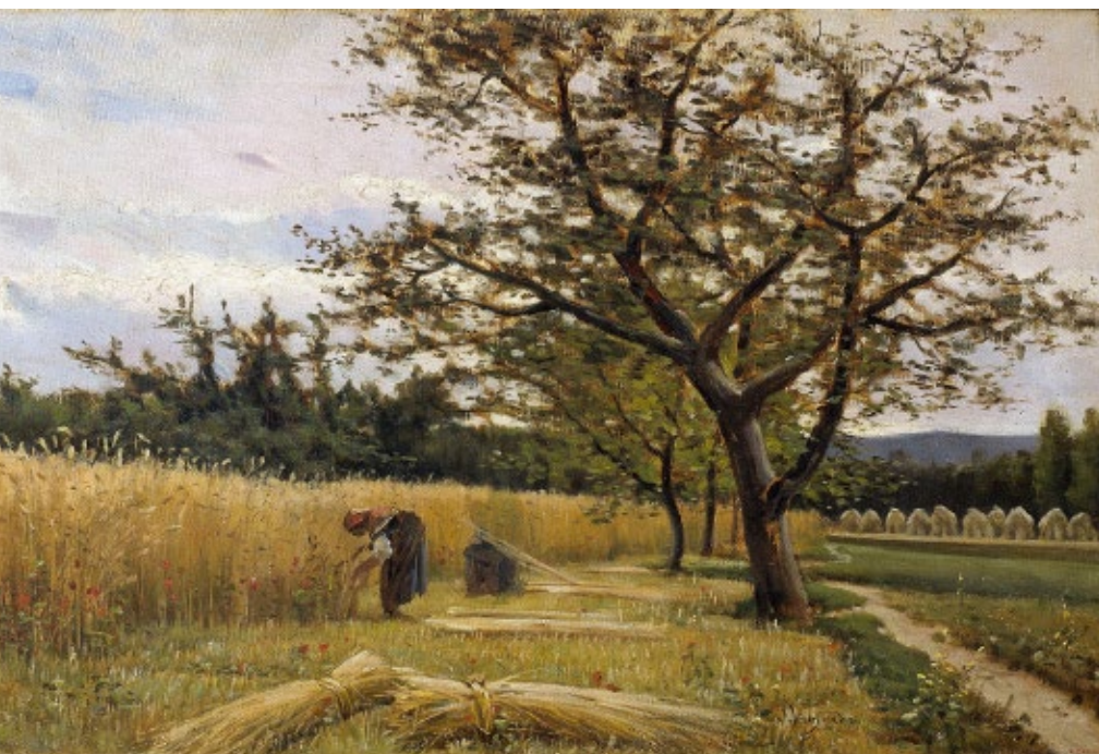
>> La sega, de Joaquim Vayreda (1881).

A aquesta peculiaritat cal afegir que, a les comarques gironines i fins ben entrat el segle XX, els principals canvis tècnics en l'agricultura varen estar poc relacionats amb enginys i màquines, els veritables símbols del progrés industrial. Com a mínim fins a l'adveniment del paquet tecnològic de l'anomenada segona revolució agrícola , que va difondre's a mitjan segle XX, els canvis tècnics més importants tenien a veure amb la manera com es gestionaven els nutrients i l'aigua per tal de millorar els rendiments dels cultius. Certament, algunes eines hi podien ajudar, especialment les arades, però les principals innovacions mecàniques servien per estalviar treball, i això no era una prioritat per a molts agricultors gironins, que utilitzaven sobretot mà d'obra familiar. El marc dels canvis tècnics que varen tenir lloc en l'agricultura gironina, catalana i de bona part d'Europa abans de la Primera Guerra Mundial era encara el de la primera revolució agrícola moderna, aquella que va ini-