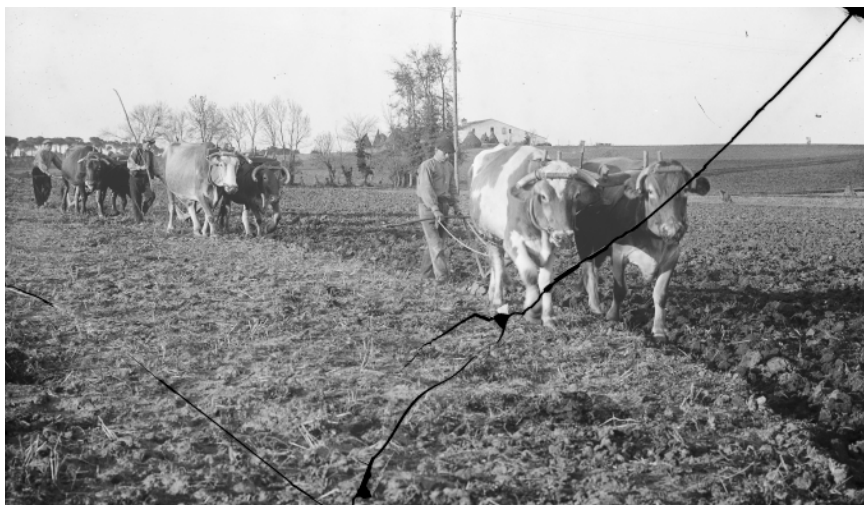
>> Bous llaurant un camp en primer terme, i el Mas Alsinelles de Sils al fons.