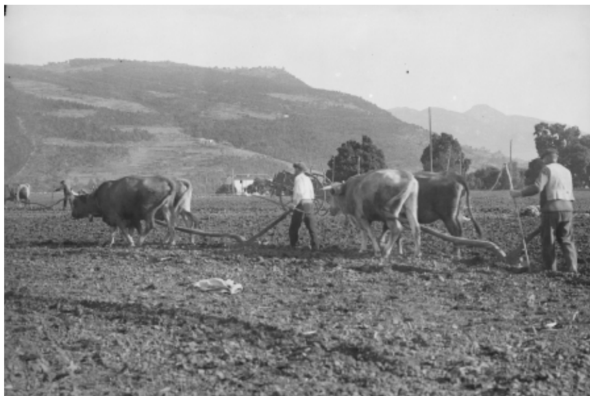
>> Pagesos llaurant un camp de les Funoses de Beguda (1920-1930).