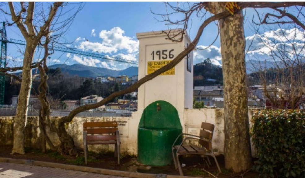
>> Font del Carrer de la Pietat (Arbúcies).