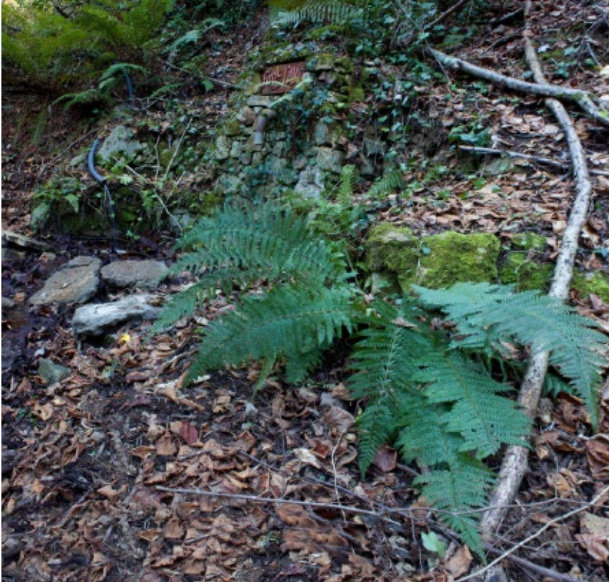
>> Font de l'Avi (Sant Feliu de Buixalleu).