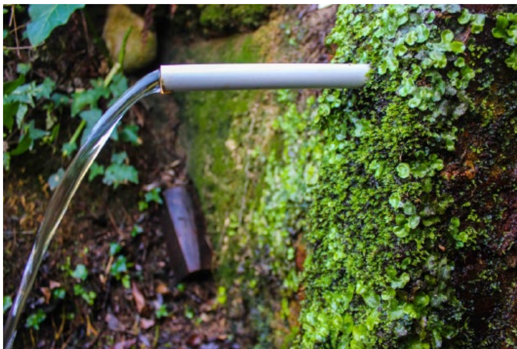
>> Font d'en Duran (Breda).

L'aprovisionament i la comercialització de l'aigua de les fonts és un bon