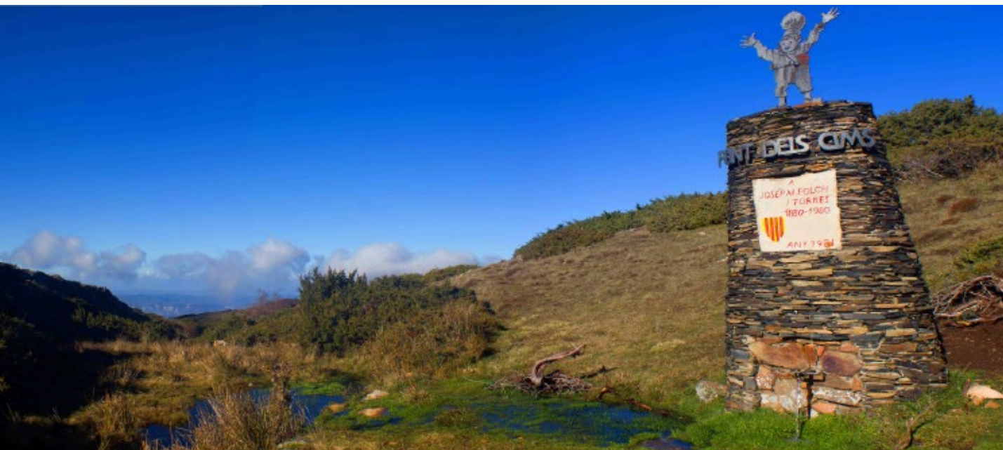
>> Font dels Cims (Viladrau).

de recollir de la font de Can Cassó o de la desapareguda font dels Àngels.