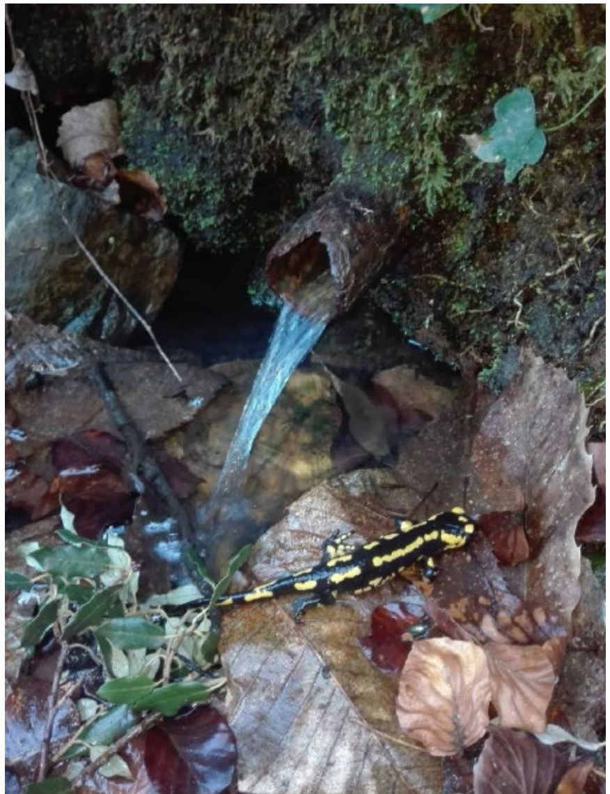
>> Font Canyonal (Riells i Viabrea).

territori i el 45 % de les deus d'aigua de la Reserva de la Biosfera del Montseny. Queda demostrat que les fonts són un gran patrimoni natural, històric i cultural del Montseny en general i del Montseny gironí en particular. Malgrat aquest elevat nombre de fonts, el veritable encant rau en com en són, de variades. Hi ha fonts a gran altitud, a