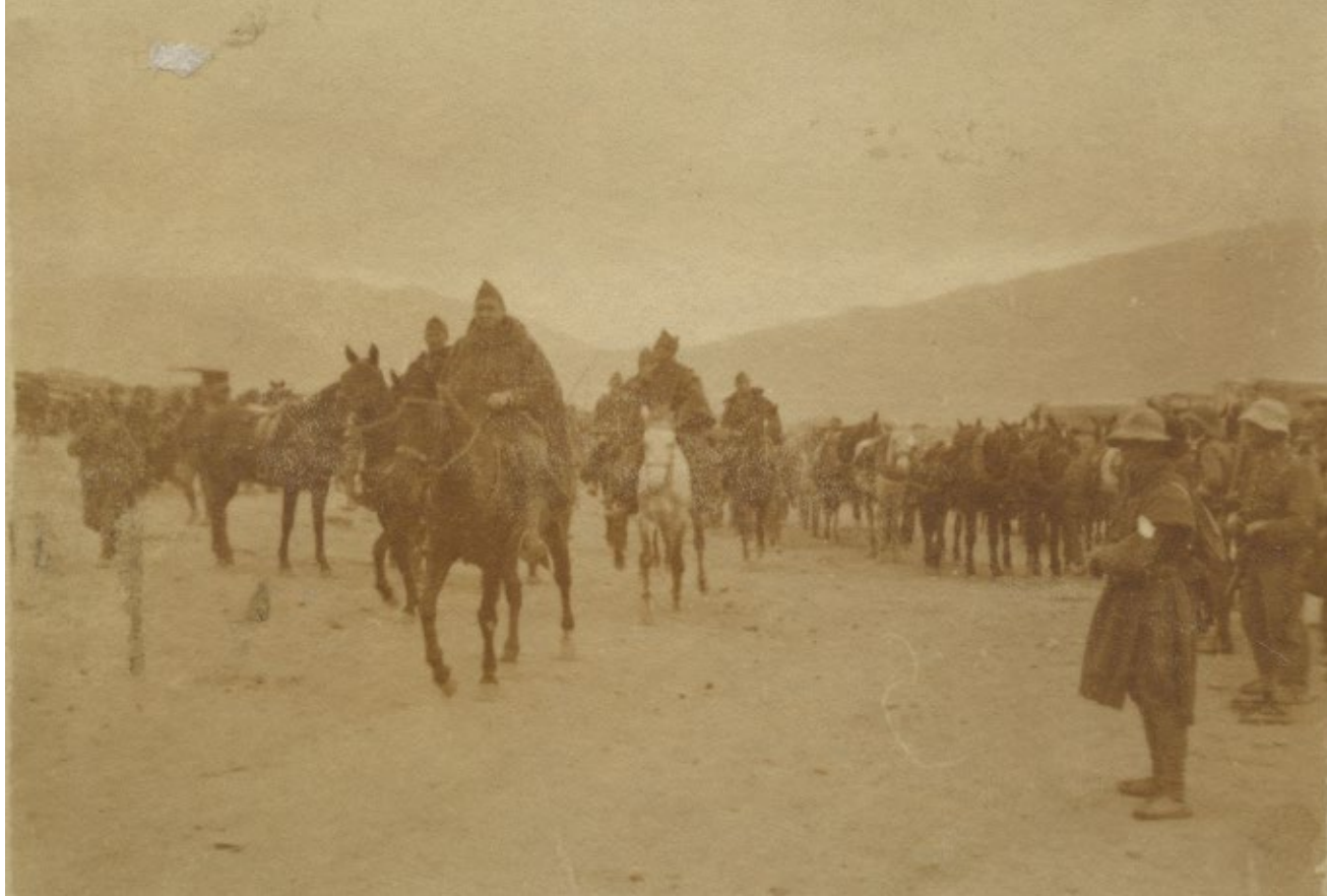
>> Militars a cavall en un dels campaments espanyols a la Guerra del Marroc.

crats. I afegeix: «A medida que se ascendía en el escalafón militar las ventajas se multiplicaban y cabía tener acceso a privilegios que resultaban tan inalcanzables para la mayor parte de la población como los míticos pollos asados de los nada eróticos sueños de Carpanta».