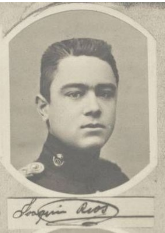
>> Ríos Capapé a l'àlbum de la dinovena promoció del centre de formació militar.

A diferència d'altres figuerencs d'ocasió, Ríos Capapé va mantenir vincles familiars i afectius amb la població natal que, l'any 1939, va declarar-lo fill predilecte. Va morir a Madrid l'any 1963, i va demanar que el sepullessin a la ciutat empordanesa. Resseguint-ne la biografia, tanmateix, hom ratifica allò que va recordar Raymond Aron: «No és veritat que la possessió dels mitjans de producció sigui la font única de poder. La relació és més aviat a la inversa, en el cas de les elits militars o violentes: aquestes darreres s'apoderen primerament del poder, i després, adquireixen la riquesa». Pàtria i patrimoni particular no són, en aquest cas, conceptes incompatibles.