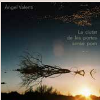
ÀNGEL VALENTÍ. La ciutat de les portes sense pom . RGB Suports, 2020. < www.facebook.com/leirodrums >

Un disc per escoltar però, sobretot, per viure en directe.