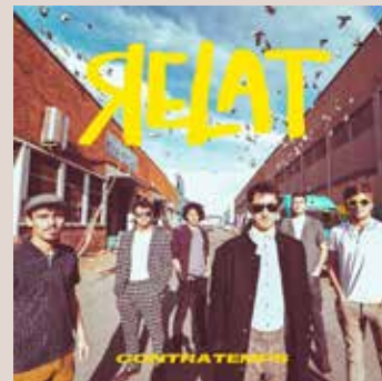
RELAT. Contratemp s. RGB Suports, 2020. < www.relatoficial.com >

Però Relat és també un grup que dona importància a les lletres, amb missatges més o menys directes i altres d'intuïts, en què combinen el català i