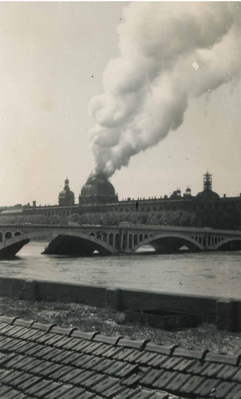
>> Sense títol [Lió durant la retirada alemanya], 1944. Paper al gelatinobromur de plata (fotografia d'àlbum), 6,5 × 10,5 cm.