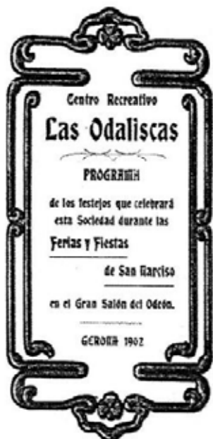
>> El darrer cartell de l'Odèon.

refrigeri per a tots els participants en la cerimònia d'inauguració del pont de Pedra. El 24 de maig de 1881 hi va tenir lloc una exposició de flors ornamentals, en el marc dels actes de commemoració del bicentenari de la mort de Calderón de la Barca, i el 5 de setembre de 1896 s'hi va organitzar una gala benèfica destinada a recaptar fons destinats a socórrer els ferits que arribaven de Cuba.