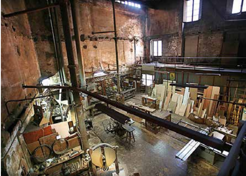
>> Antiga Fusteria Lladó.