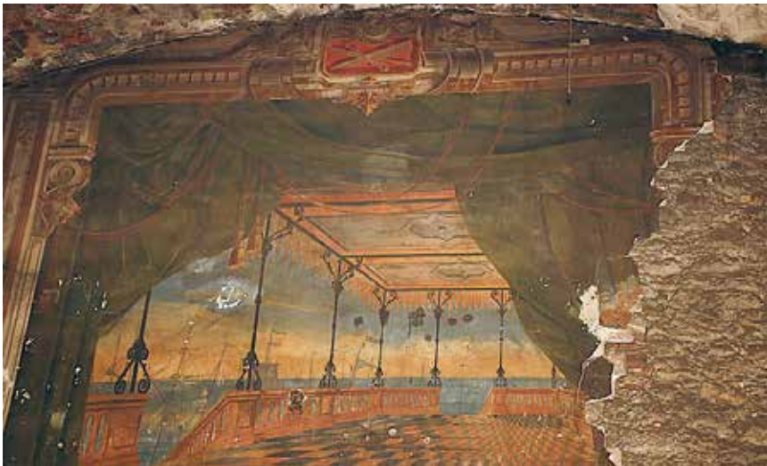
>> Pintura de l'escenari.

de respectar-ne obligatòriament la configuració original.