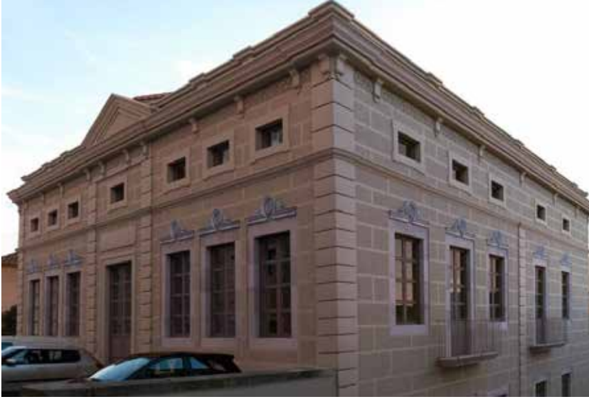
>> El Palau Artau.