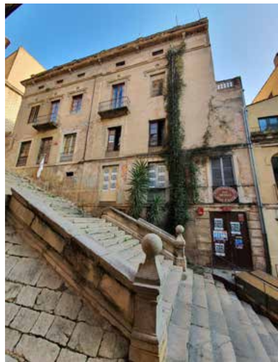
>> Aspecte actual de l'edifici de l'antiga Sala Odèon. (Autoria: JOSEP PASTELLS)

Segons consta a l'Arxiu Històric del Col·legi d'Arquitectes de Catalunya, l'edifici del número 6 de la pujada de Sant Domènec ocupa un terreny d'un gran desnivell que va des de la placeta de Le Bistrot fins a la porta de l'antic Seminari Conciliar (pujada de Sant Martí, 7). Té una planta gairebé rectangular, amb un doble espai i una estructura de suport de pilars de fosa. Comprèn una gran sala a la planta baixa (l'antic teatre) i l'habitatge del propietari al pis superior. Aquest immoble, conegut com el Palau Artau, té més de cinc-cents metres quadrats construïts i cinquanta metres quadrats de terrassa, no té fonaments i s'aguanta des de baix amb unes columnes de nou metres d'altura que, situades a la platea del teatre, suporten la que va ser una luxosa mansió en altres èpoques amb un sistema de bigues de tipus Eiffel. Les columnes varen ser foses a Girona per l'empresa Gallart i Cia.