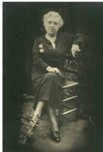
>> Caterina Albert en una fotografia de l'any 1944, aproximadament.