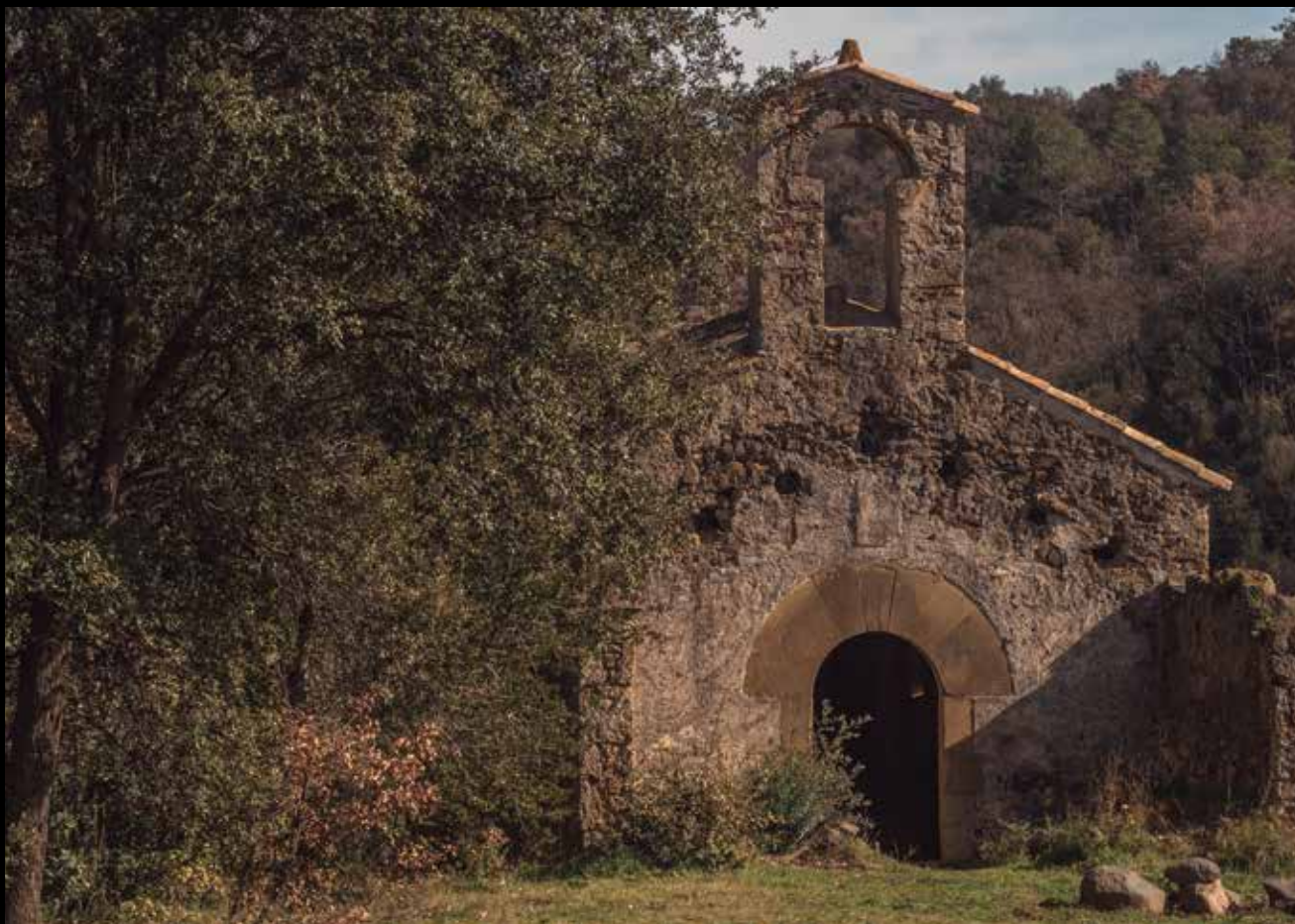
>> Ermita de Sant Medir.