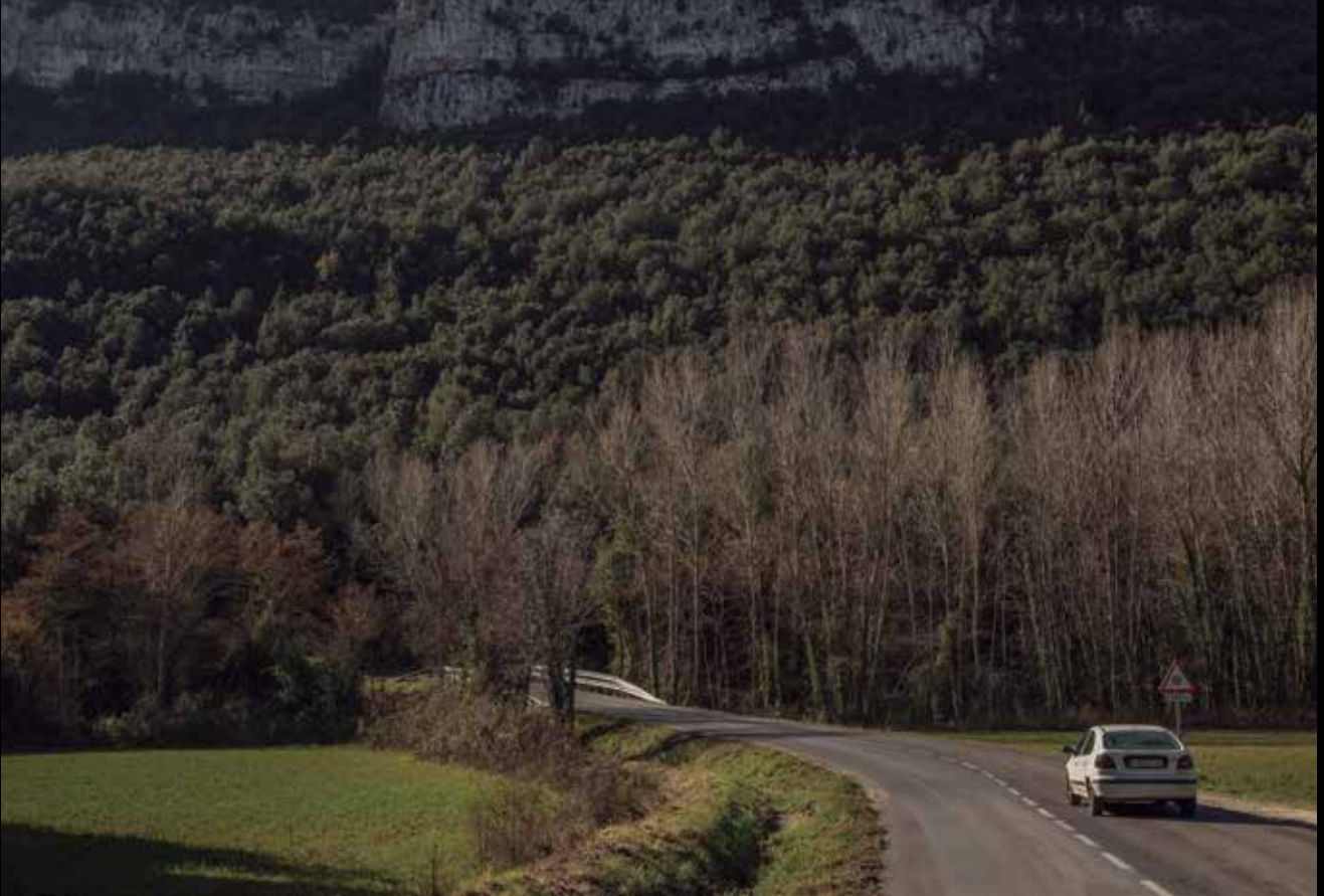
>> Carretera GI-531 al Pla de Sant Joan.