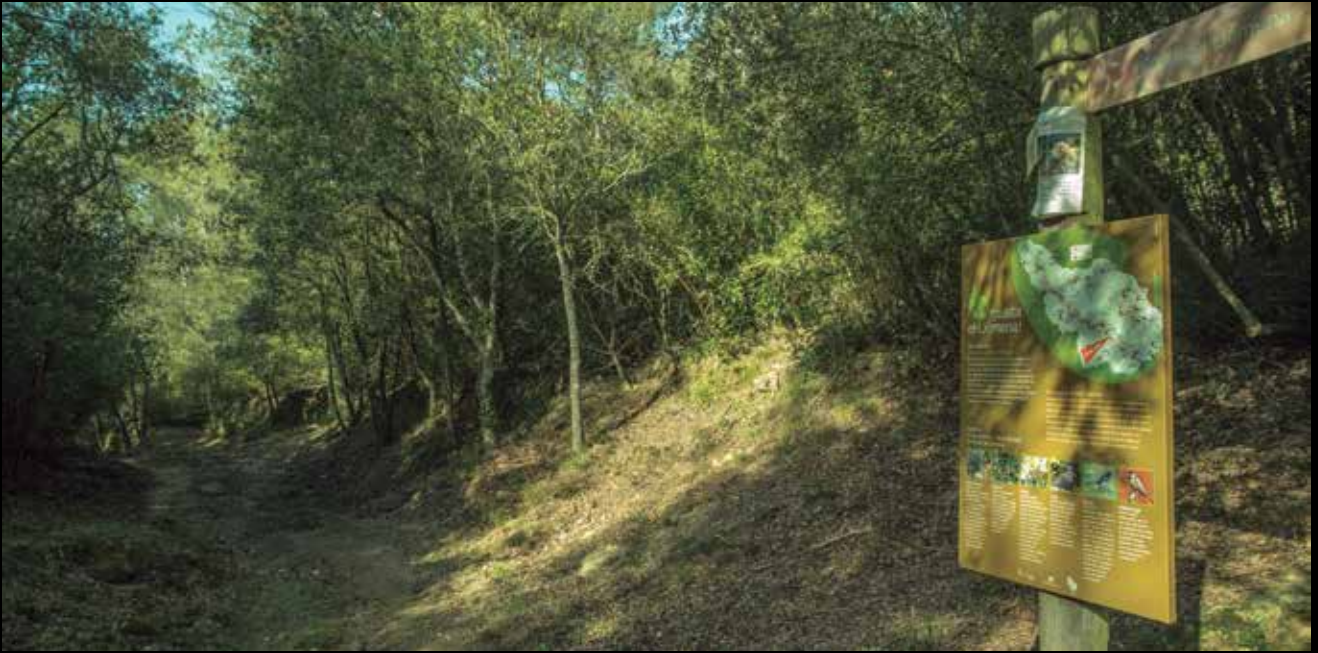
>> Port Sacreu.