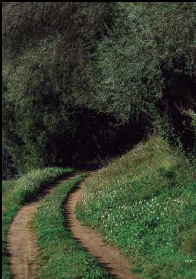
>> Camí entre Domeny i Sant Gregori.