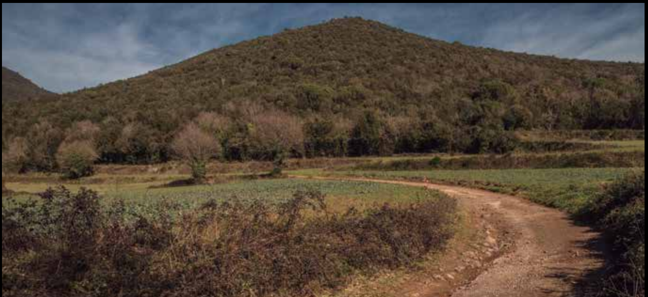
>> Volcà de la Banya del Boc.