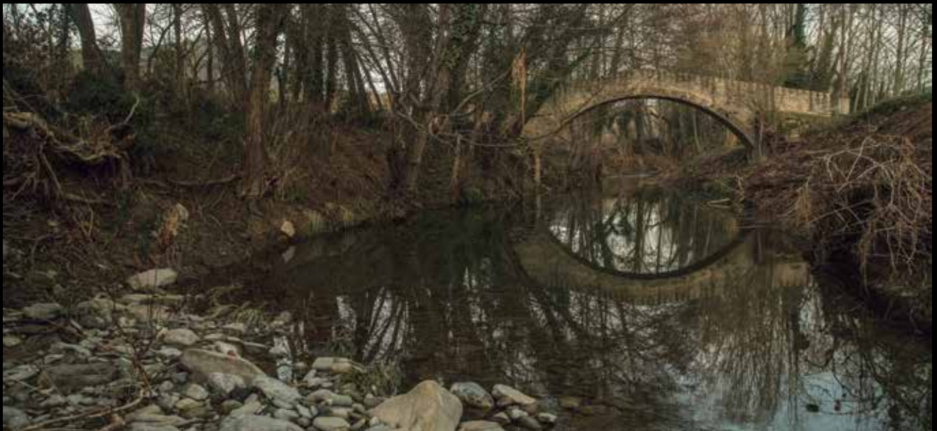
>> Pont de Pedra a Sant Esteve de Llémena.