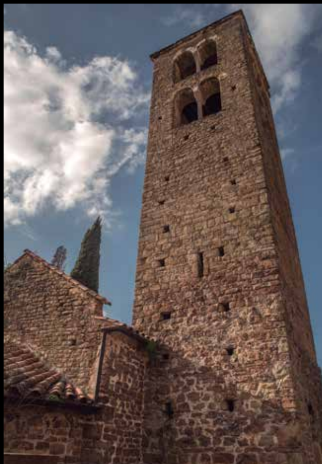
>> Església de Llorà.

Ja no ens aturarem fins que trobem la riera, i seguirem a través d'un camí que la voreja en paral·lel.