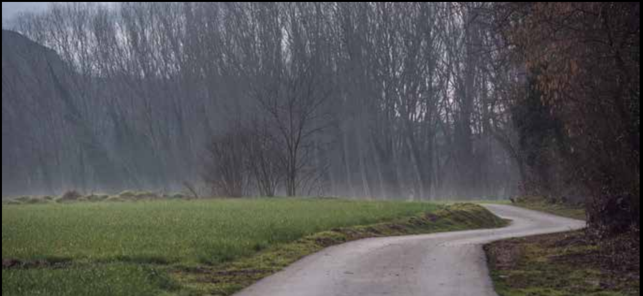
>> Camí ral a prop de Sant Esteve de Llémena.