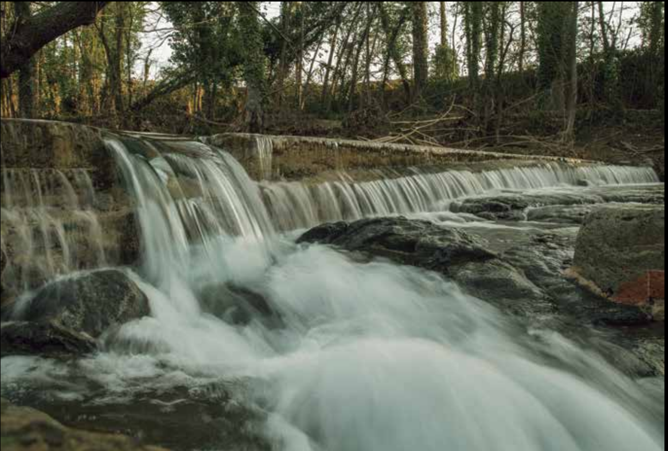
>> Riera de Llémena.