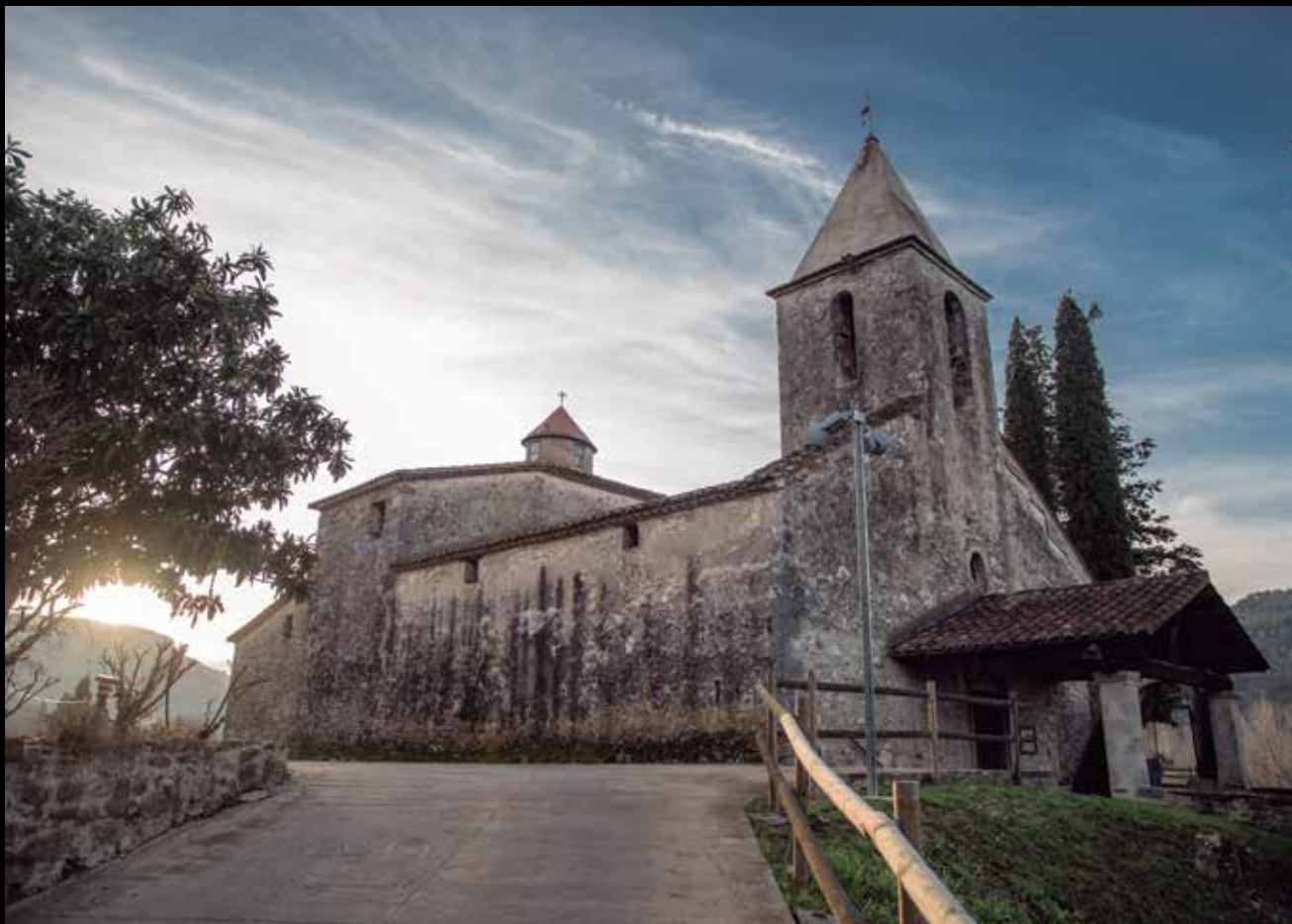
>> Església de Sant Esteve de Llémèna.