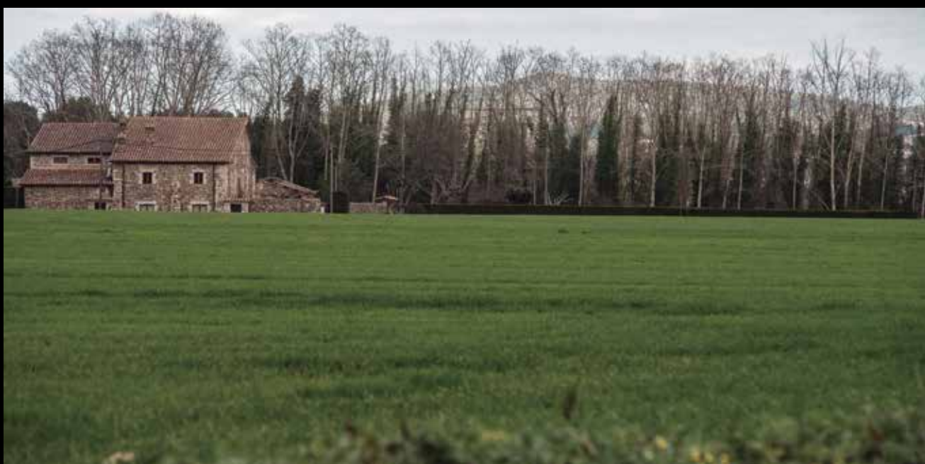
>> Masia a prop de Sant Esteve de Llémena.