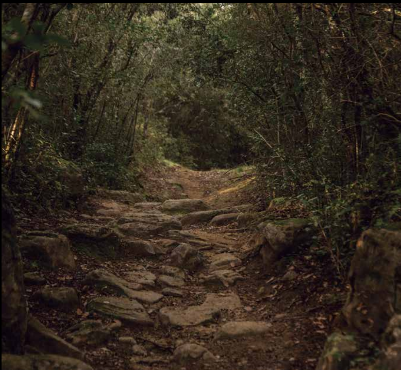
>> Camí ral entre Santa Afra i Ginestar.