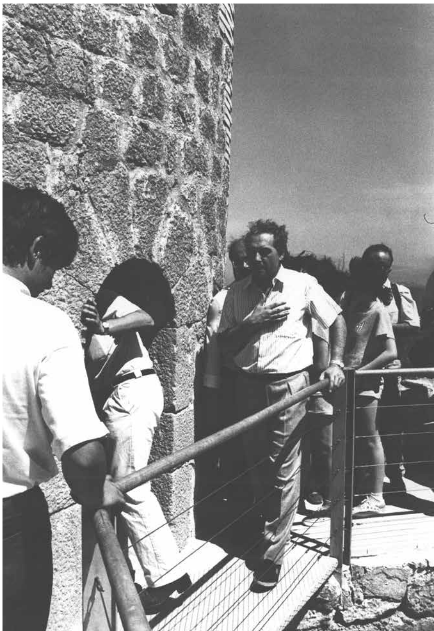
>> El 1989, a la inauguració de la restauració del castell del Montgrí.

havia compartit helicòpter per al transport de material de les obres.