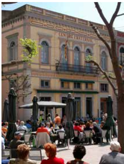
>> El Centre Fraternal de Palafrugell, a la plaça Nova.

del teatre, dedicada sobretot a balls, quines i altres activitats lúdiques. I tot plegat es fa mantenint l'essència històrica, l'esperit d'un poble i d'un local sense el qual la història de Palafrugell no seria la mateixa.