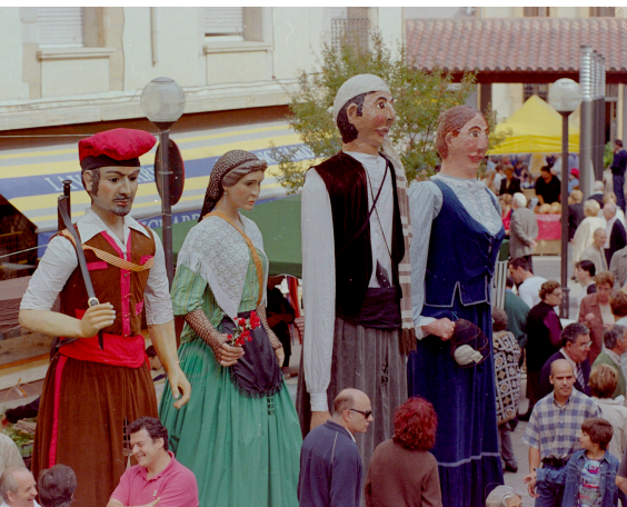
>> Gegants a la fira popular Torna en Serrallonga de Sant Hilari Sacalm.