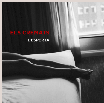
ELS CREMATS. Desperta . Barcelona: Discmedi, 2019. < www.elscremats.cat >

Aquest disc recull de manera íntegra i sense retocs de postproducció el concert que Miquel Abras i la seva banda (a més d'alguns col·laboradors, com ara Cesc Freixas i altres músics bisbalencs) van oferir a les escales de la catedral de Girona el mes de maig passat en el marc del Festival Strenes. Les cançons que componen aquesta nova proposta són les que habitualment es poden escoltar als concerts d'Abras i amb les quals se sent més còmode. Cançons emblemàtiques com «Per amor a l'art», «Et miro, em mires i rius», «La Placeta» o «L'Empordà se'ns crema». I també, en l'apartat dels homenatges, una mirada a Lluís Llach (l'imprecindible «País petit» i «Amor particular»). Un Miquel Abras brillant.